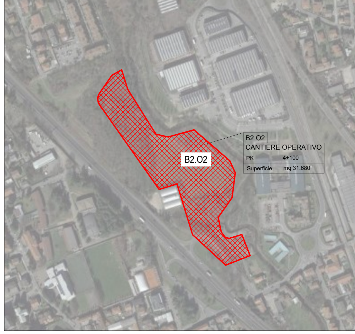
Localizzazione cantiere operativo su ortofoto