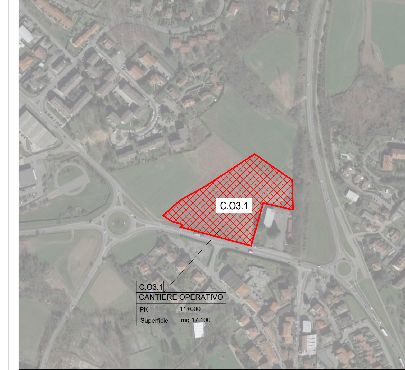
Localizzazione cantiere operativo su ortofoto