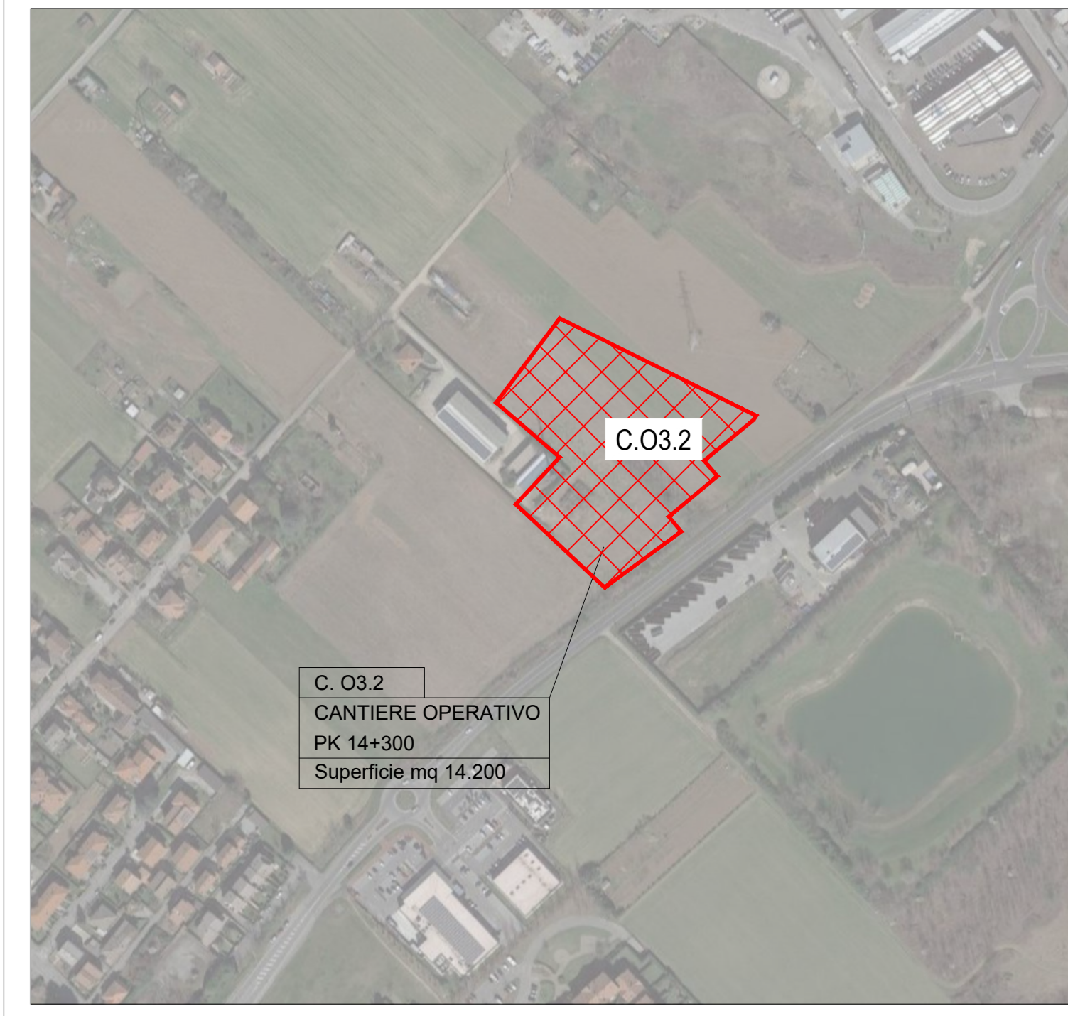
Localizzazione cantiere operativo su ortofoto