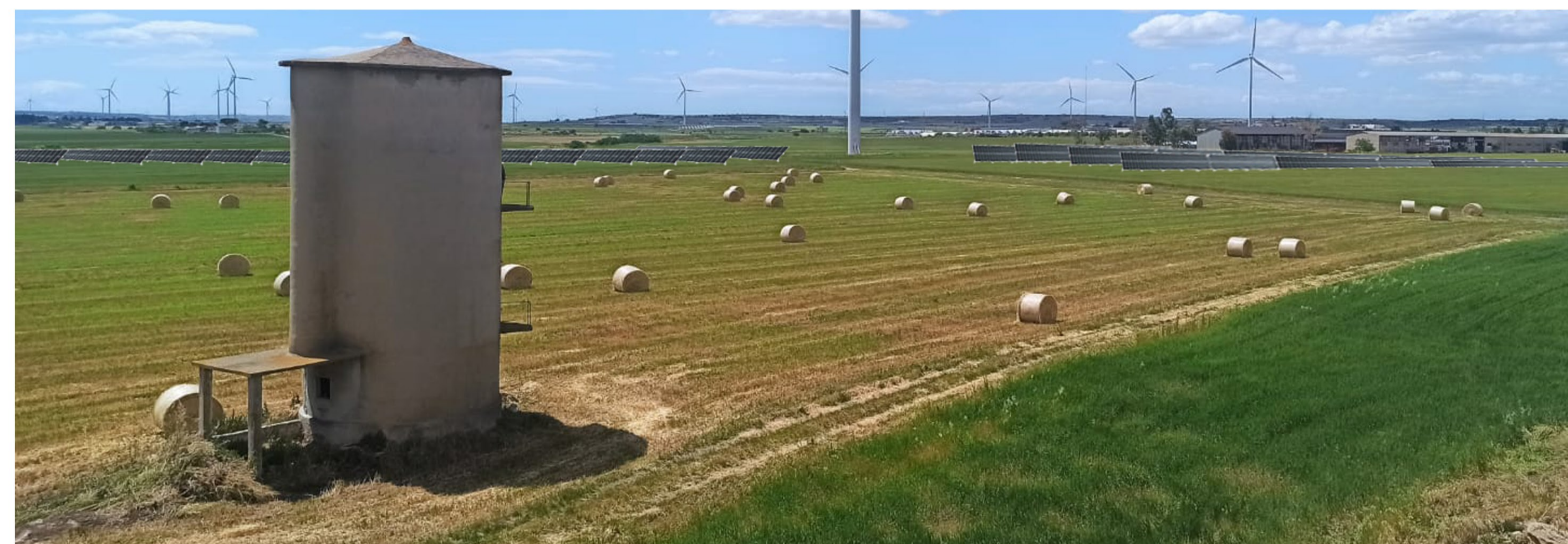
Fotosimulazione della soluzione progettuale