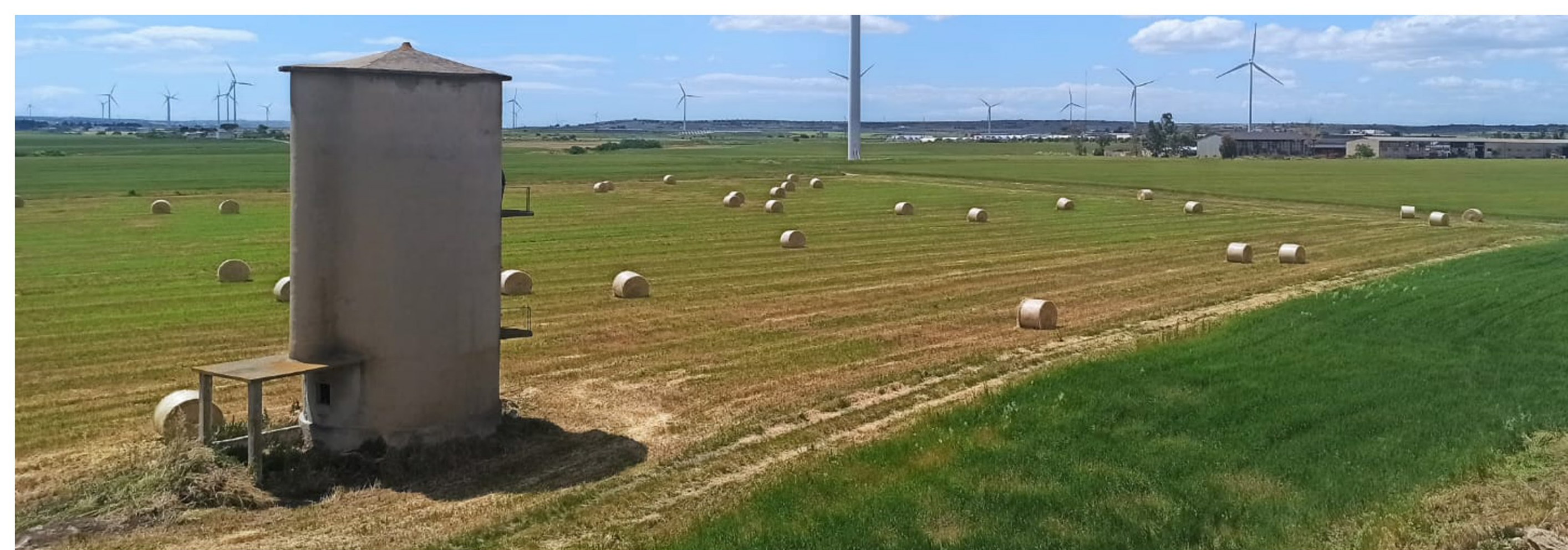
Foto stato dei luoghi settembre 2023