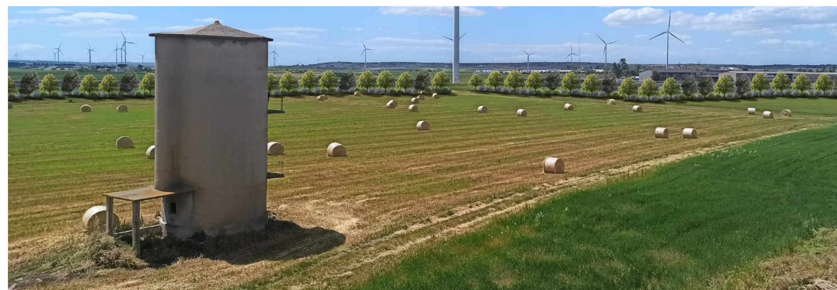
Fotosimulazione della soluzione progettuale con inserimento di misure di mitigazione