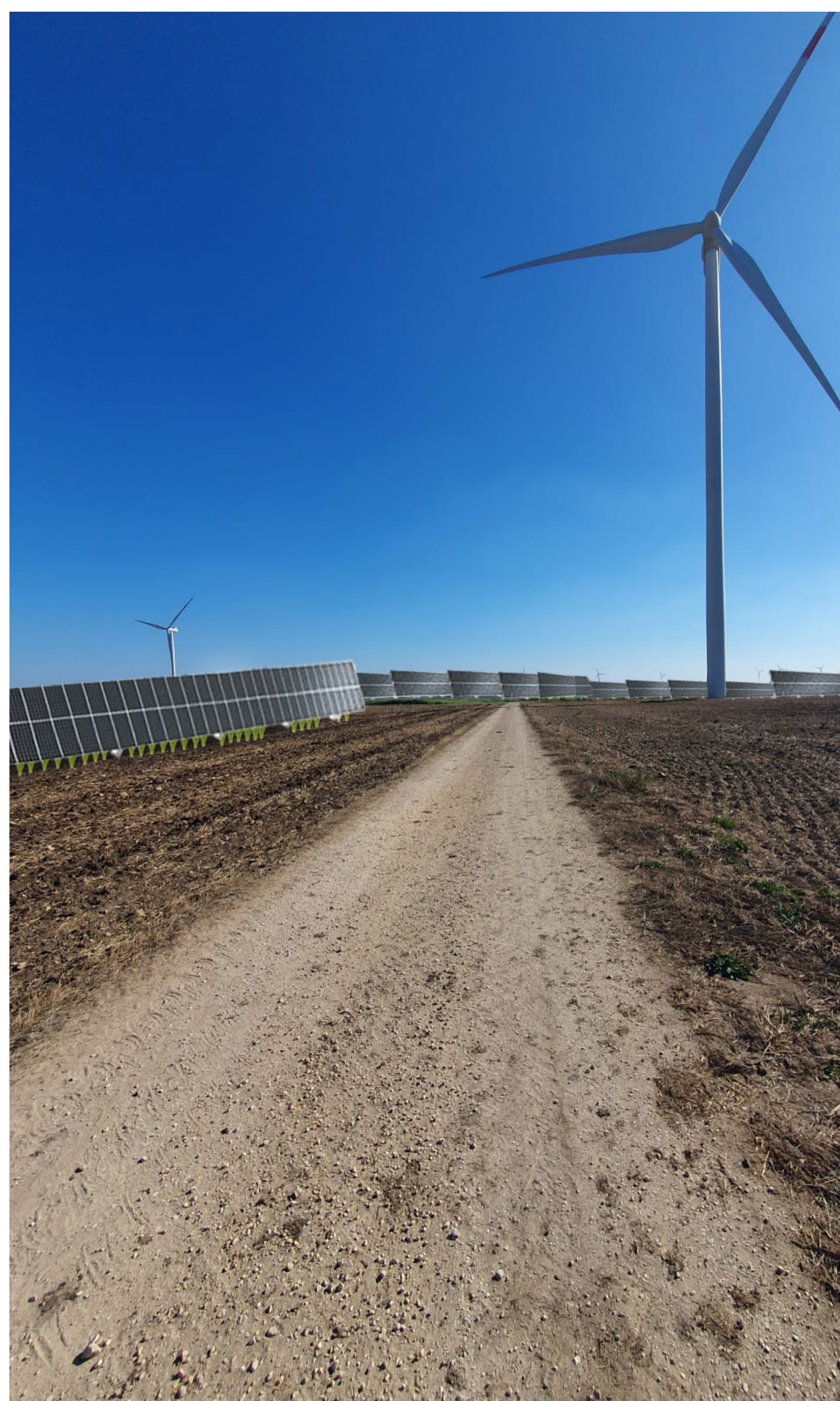
Fotosimulazione della soluzione progettuale