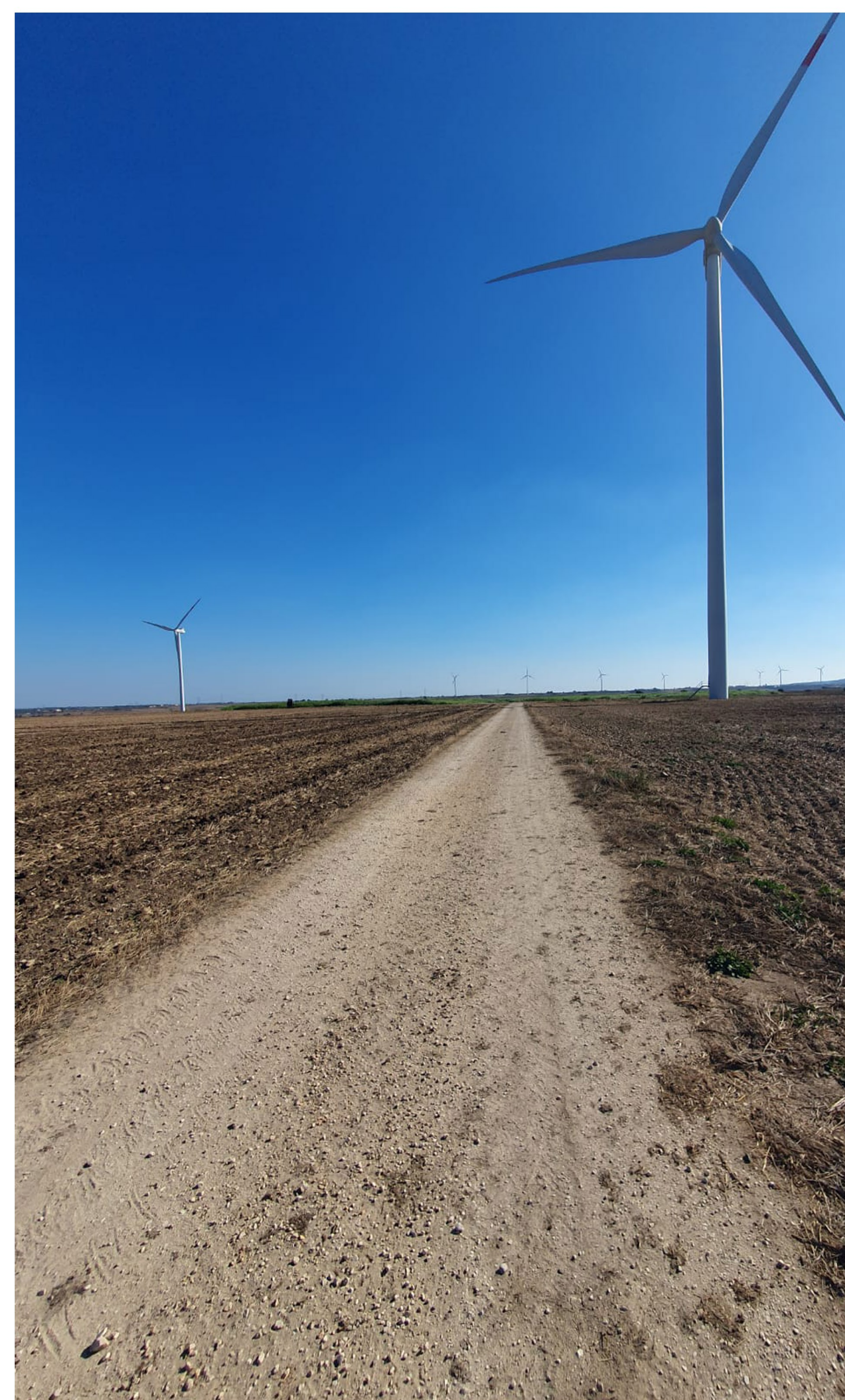
Foto stato dei luoghi 03.10.2023