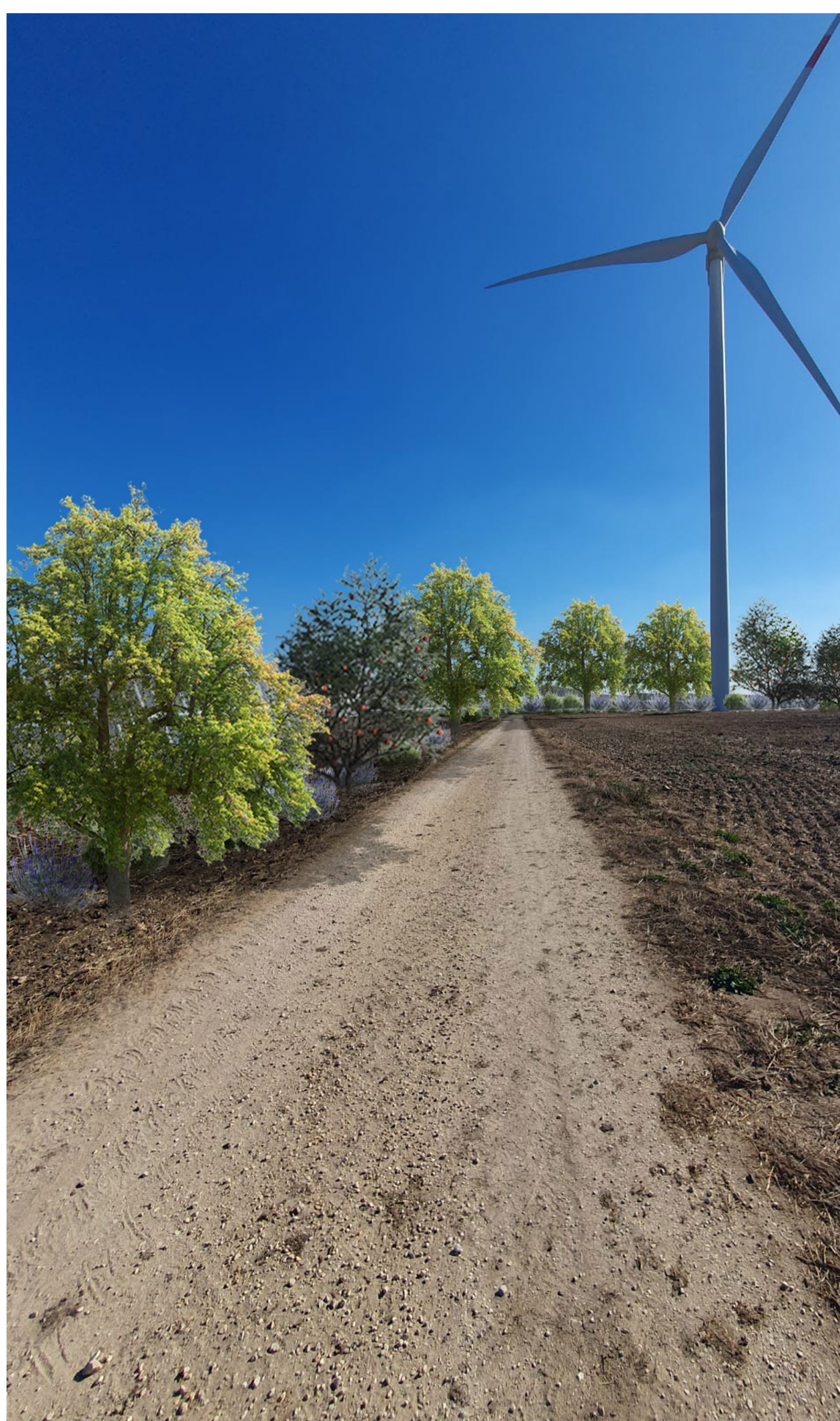
Fotosimulazione della soluzione progettuale con inserimento di misure di mitigazione