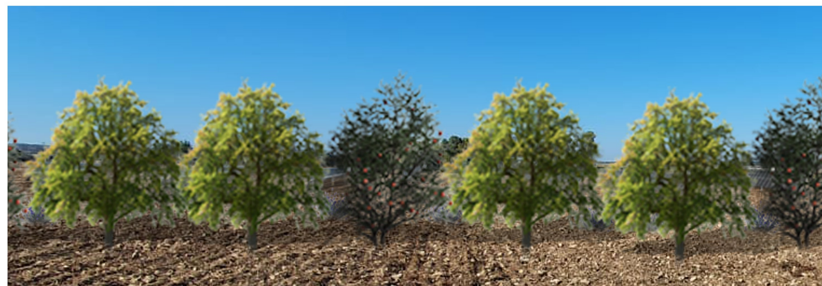
Fotosimulazione della soluzione progettuale con inserimento di misure di mitigazione