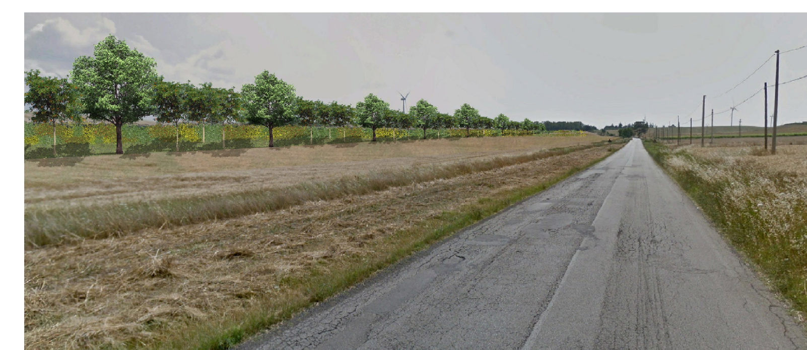
Vista 2: Fotoinserimento impianto agro-fotovoltaico e misure di mitigazione