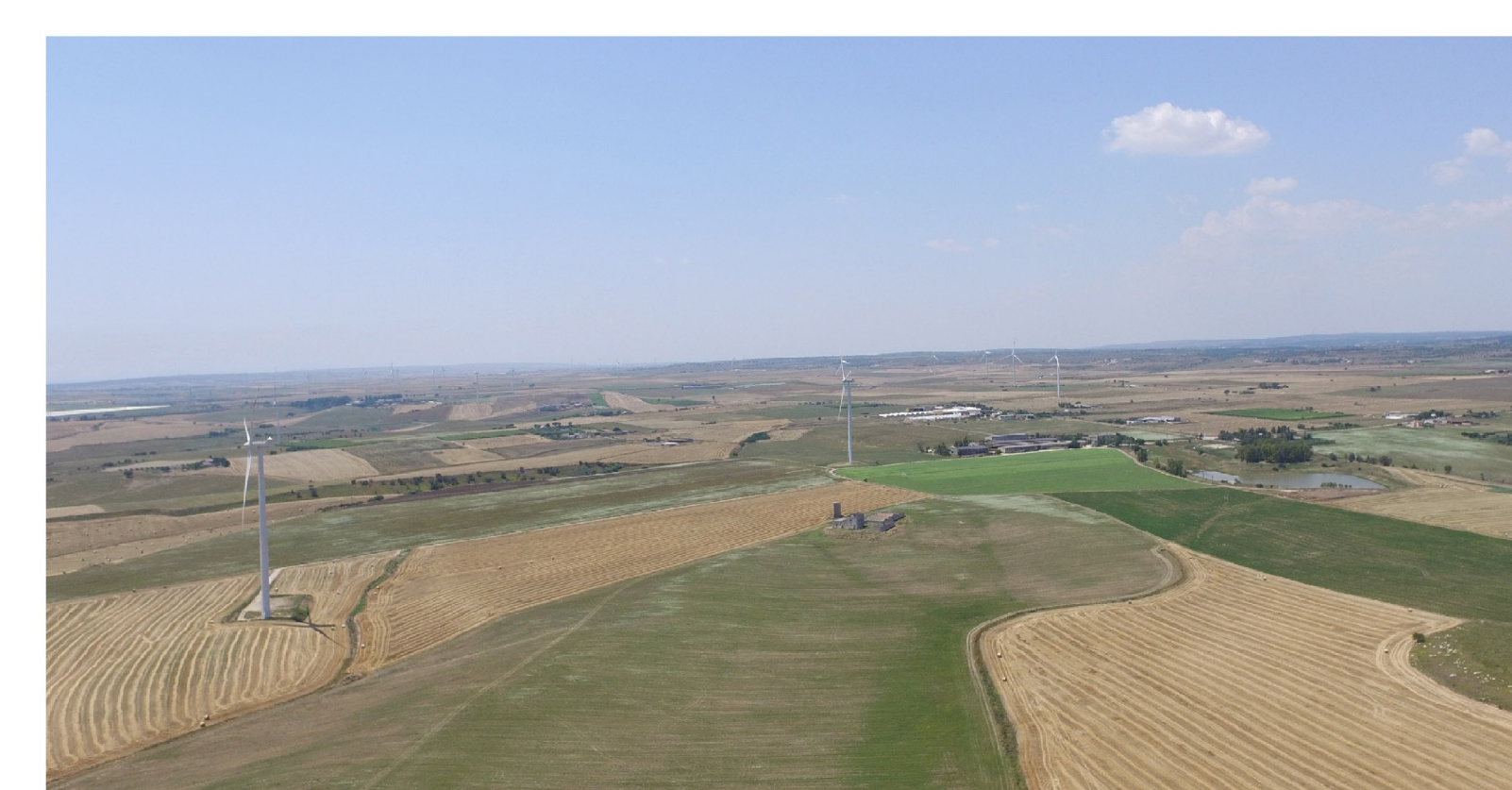
Vista 1: Stato dei luoghi