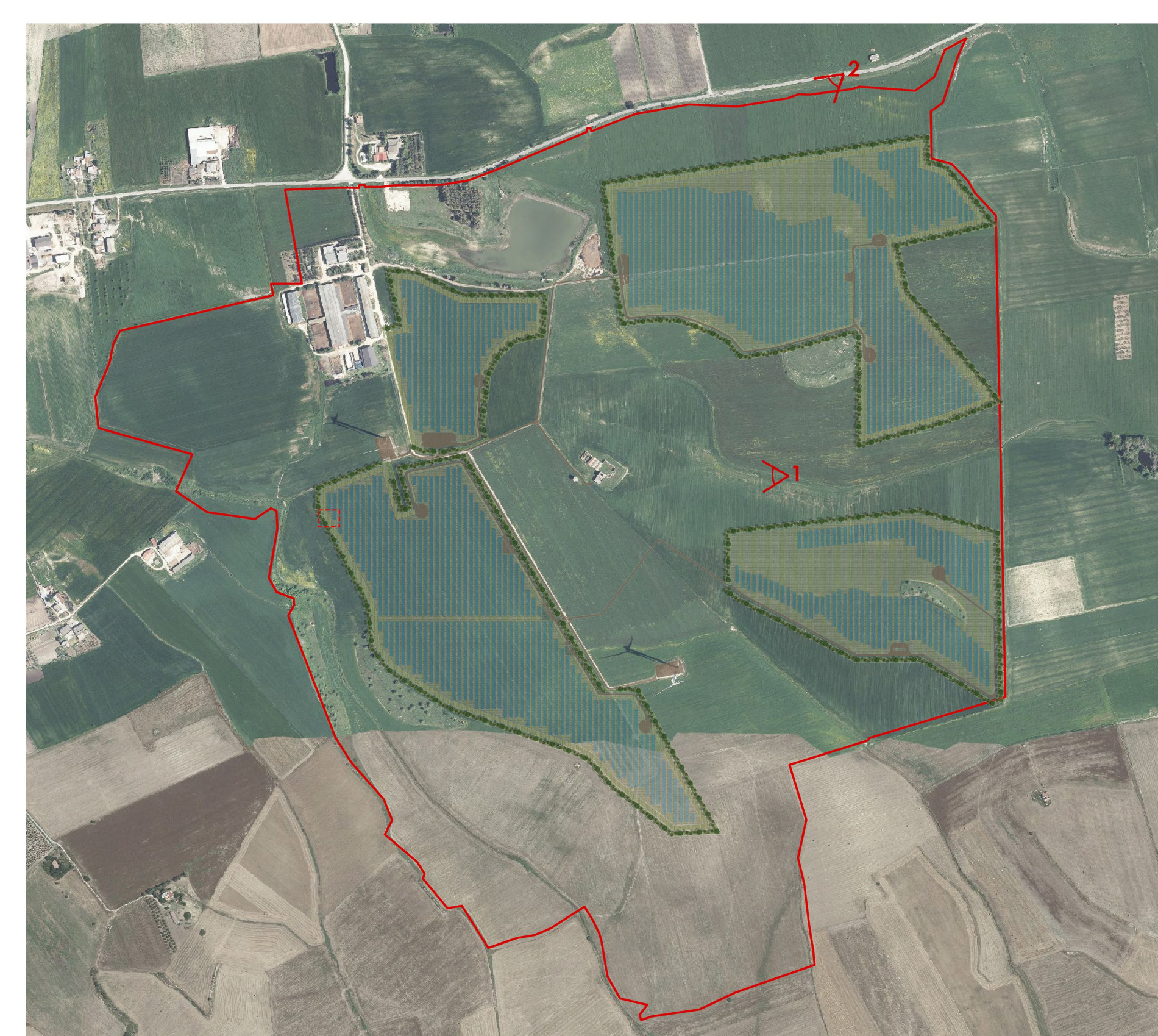
Fotoinserimento impianto agro-fotovoltaico su ortofotocarta