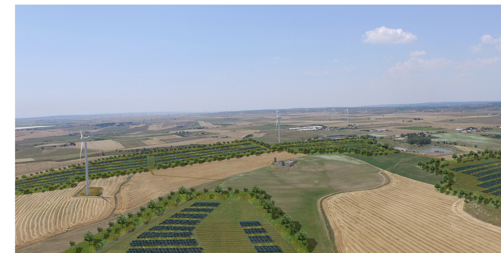
Vista 1: Fotoinserimento impianto agro-fotovoltaico e misure di mitigazione