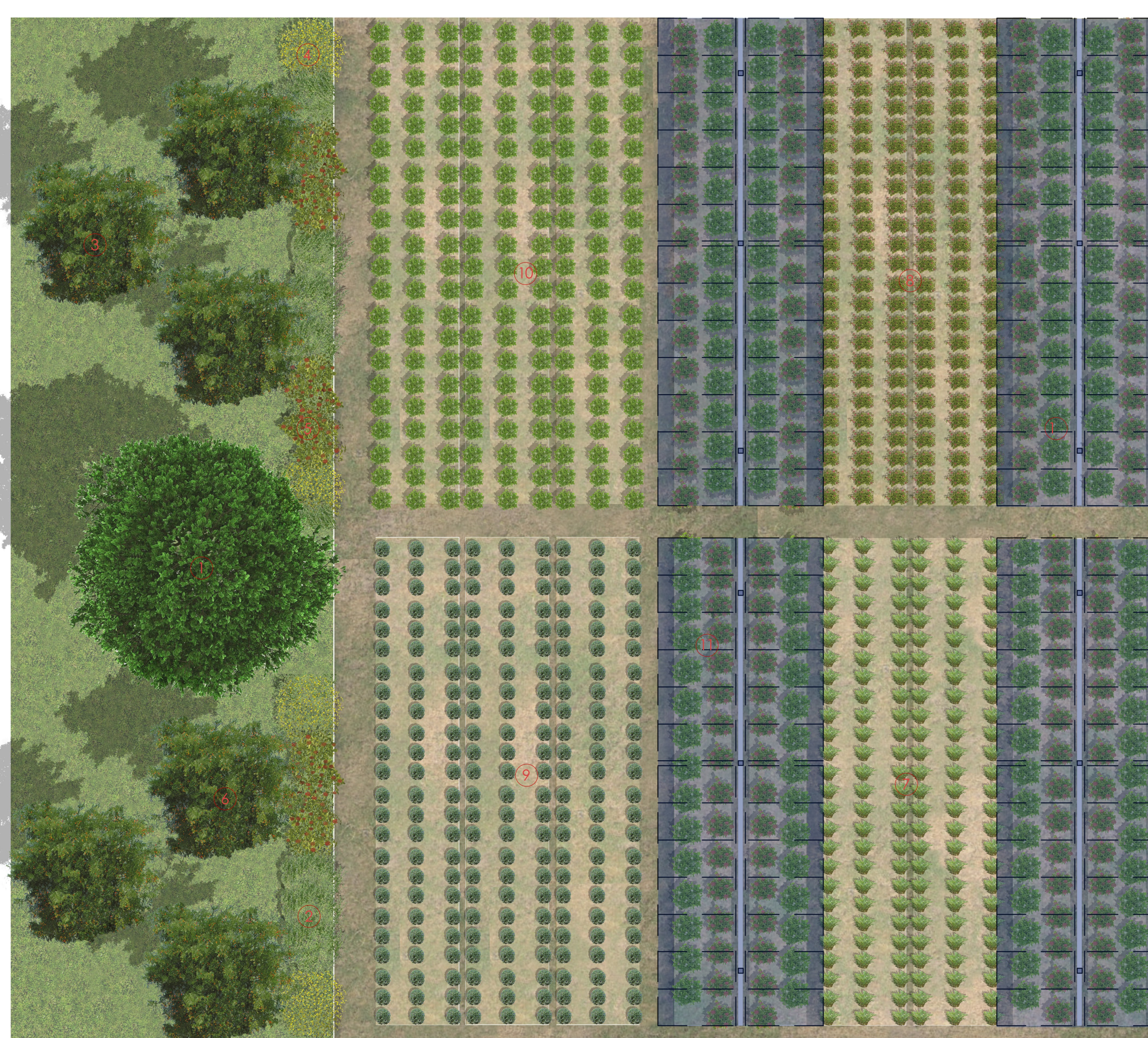
Stralcio di progetto - scala 1:100