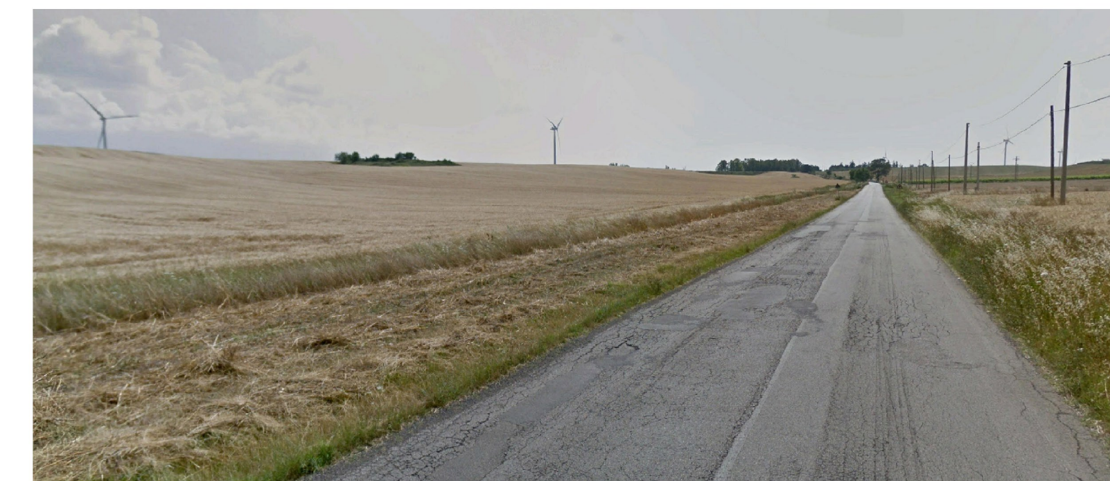
Vista 2: Stato dei luoghi