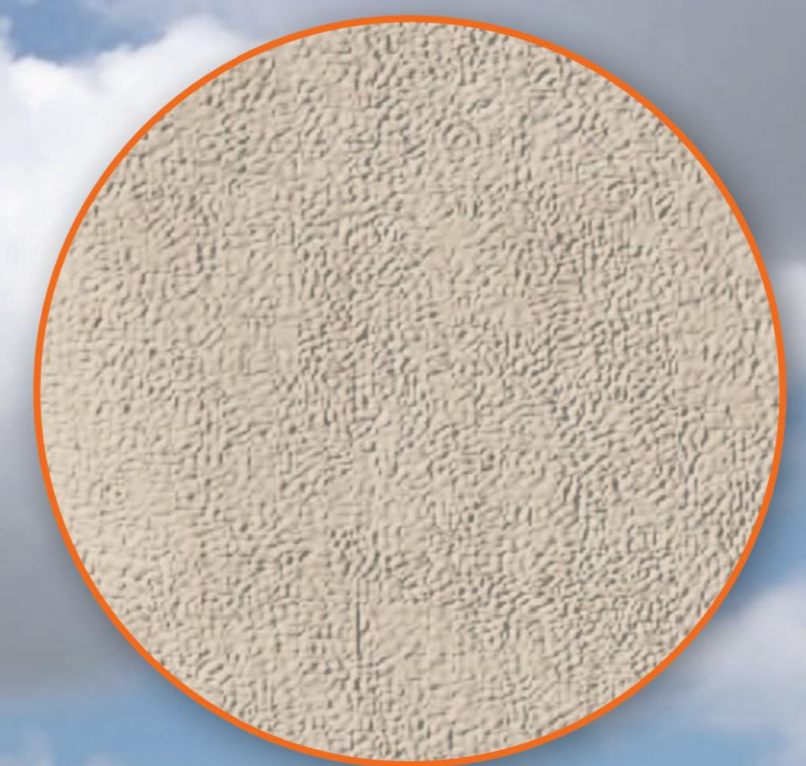
DETTAGLIO TEXTURE SABBIATURA DEL CALCESTRUZZO