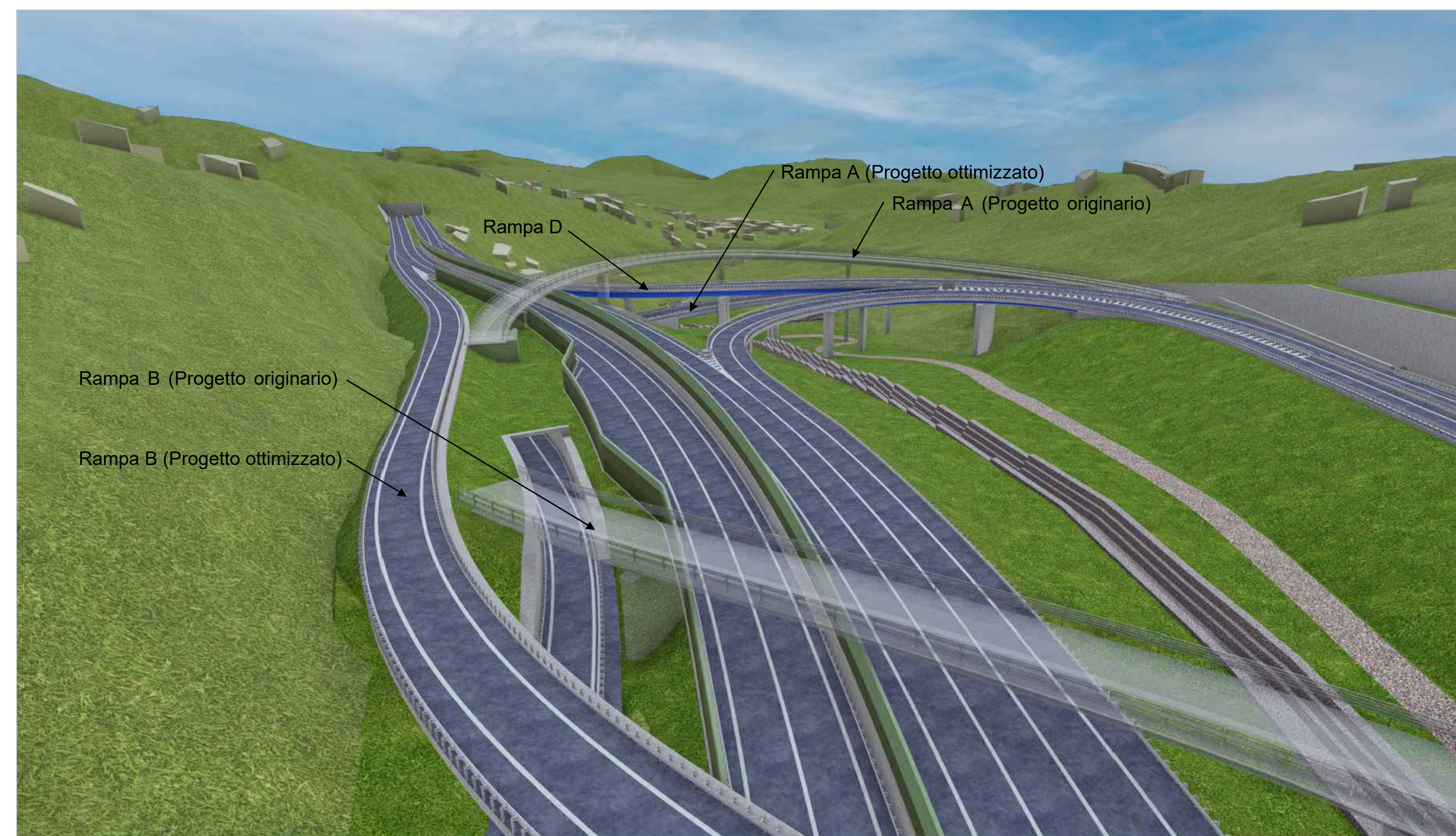
Punto di vista 04 - Progetto ottimizzato