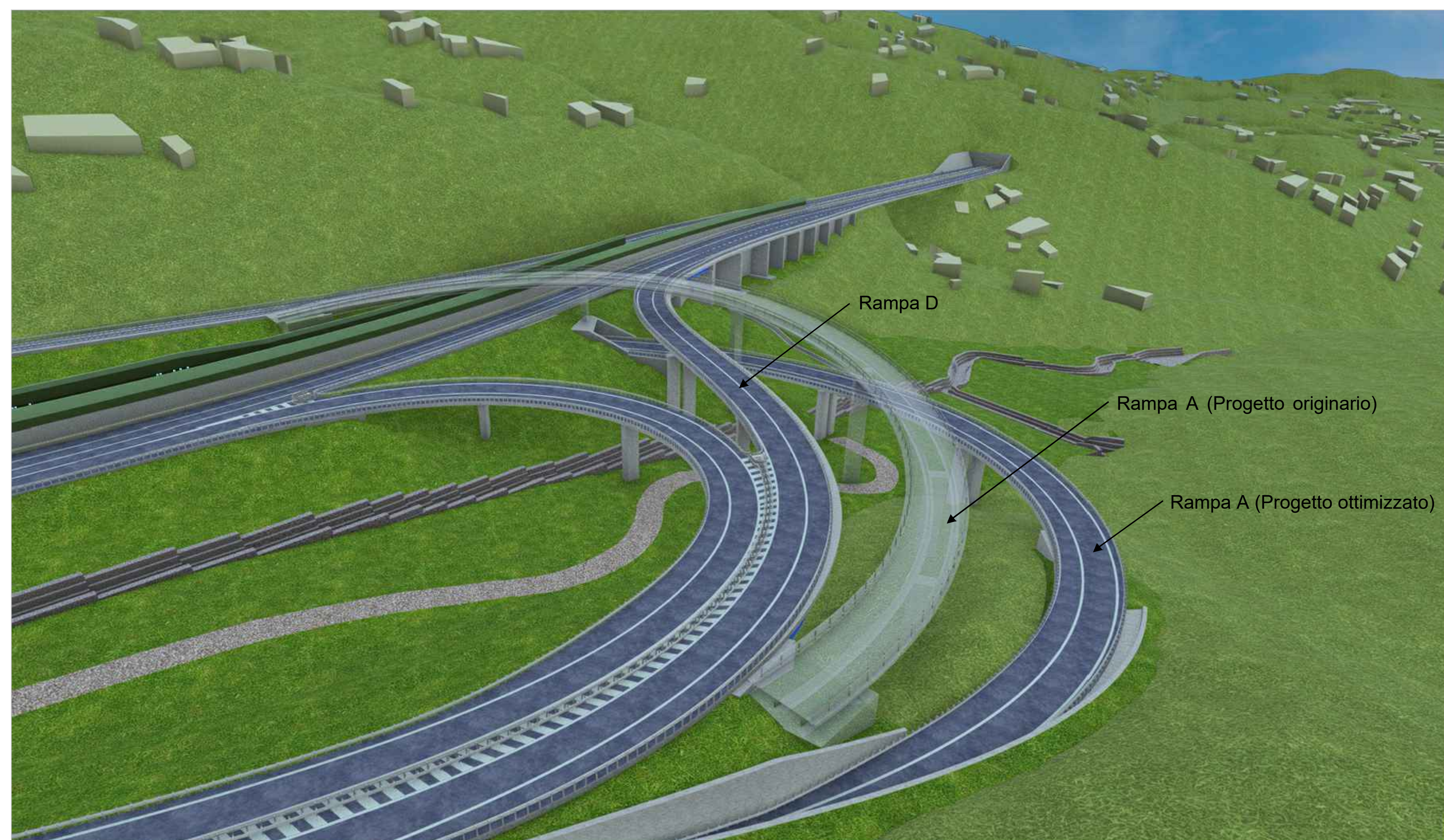
Punto di vista 03 - Progetto ottimizzato