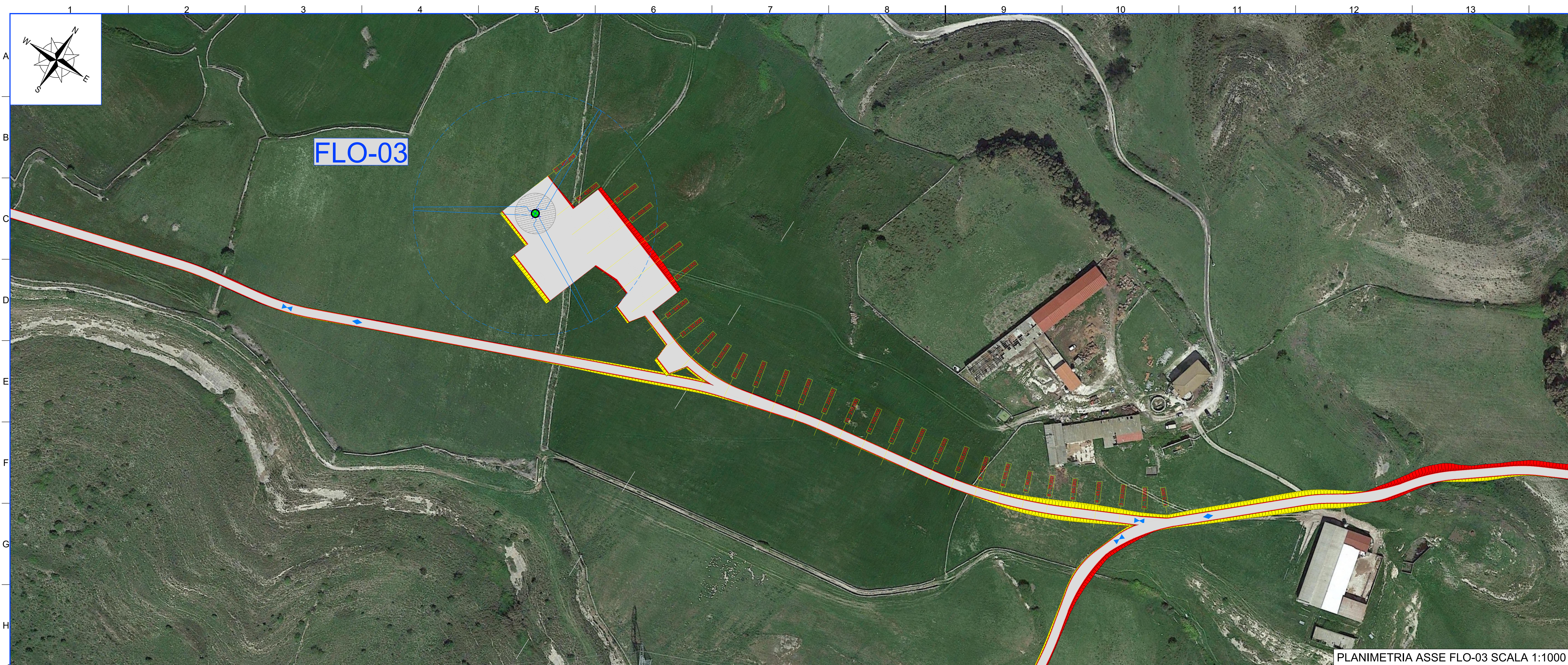
PLANIMETRIA ASSE FLO-03 SCALA 1:1000