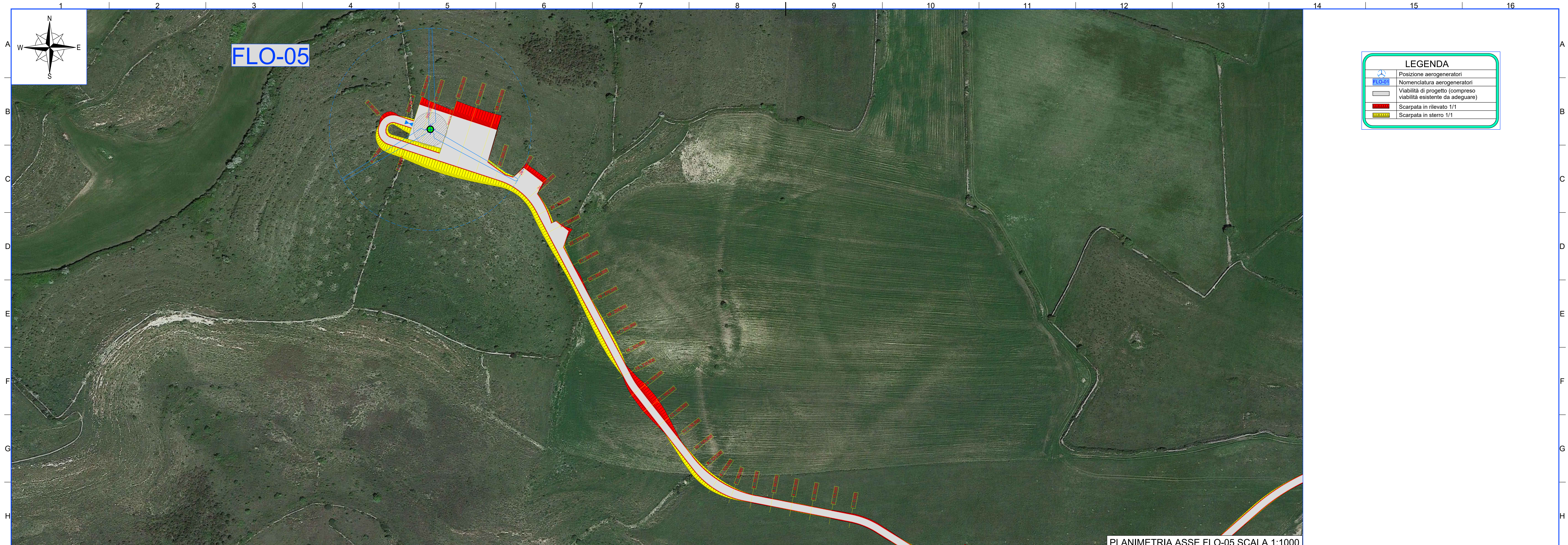
PLANIMETRIA ASSE FLO-05 SCALA 1:1000