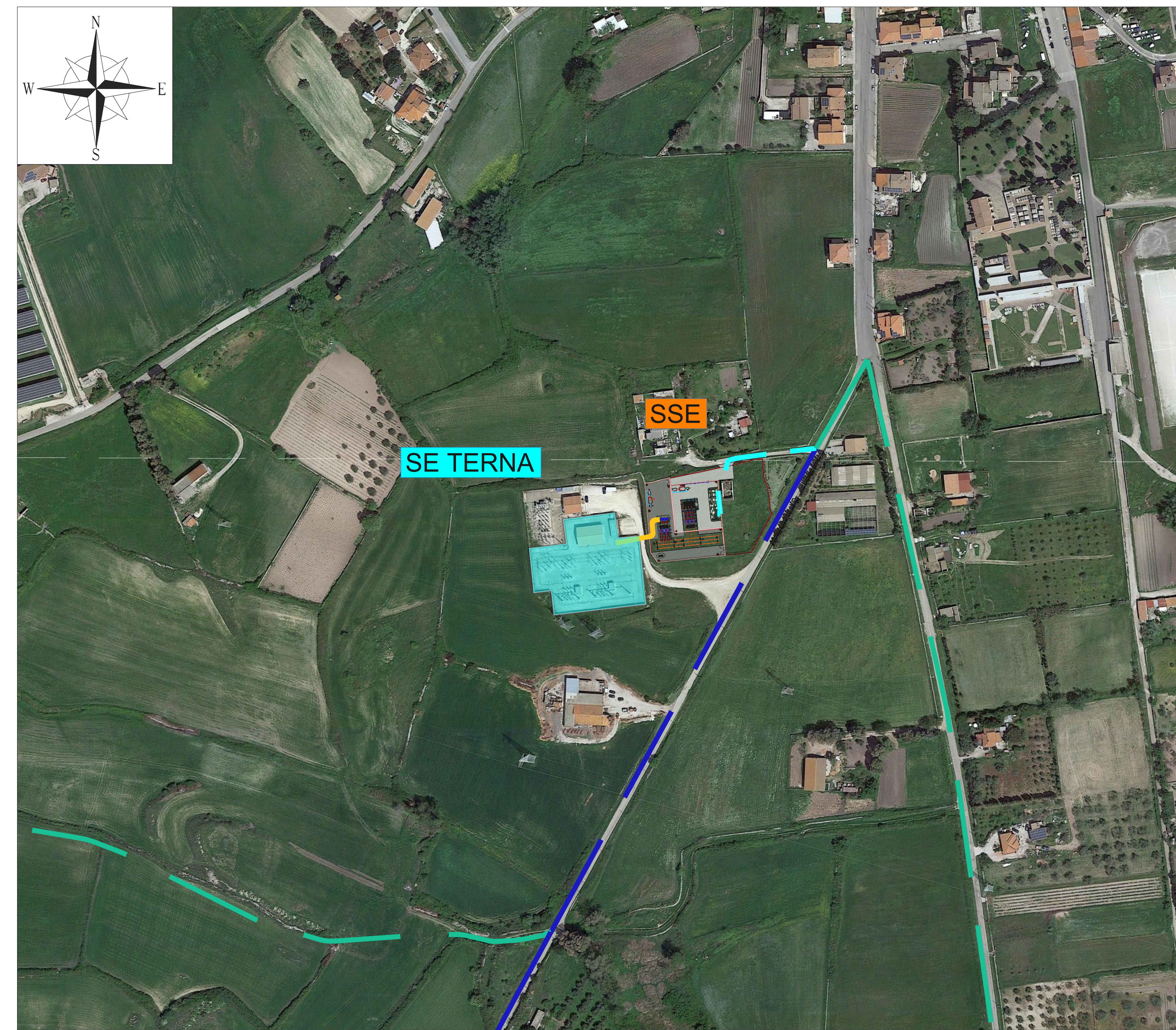
INQUADRAMENTO SU ORTOFOTO SCALA 1:2000