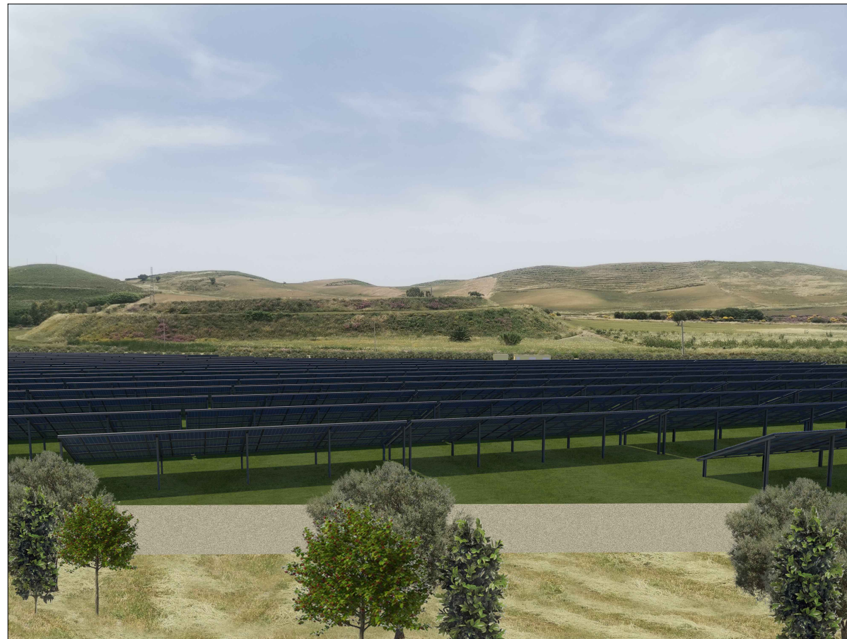
VISTA DETTAGLIO 4