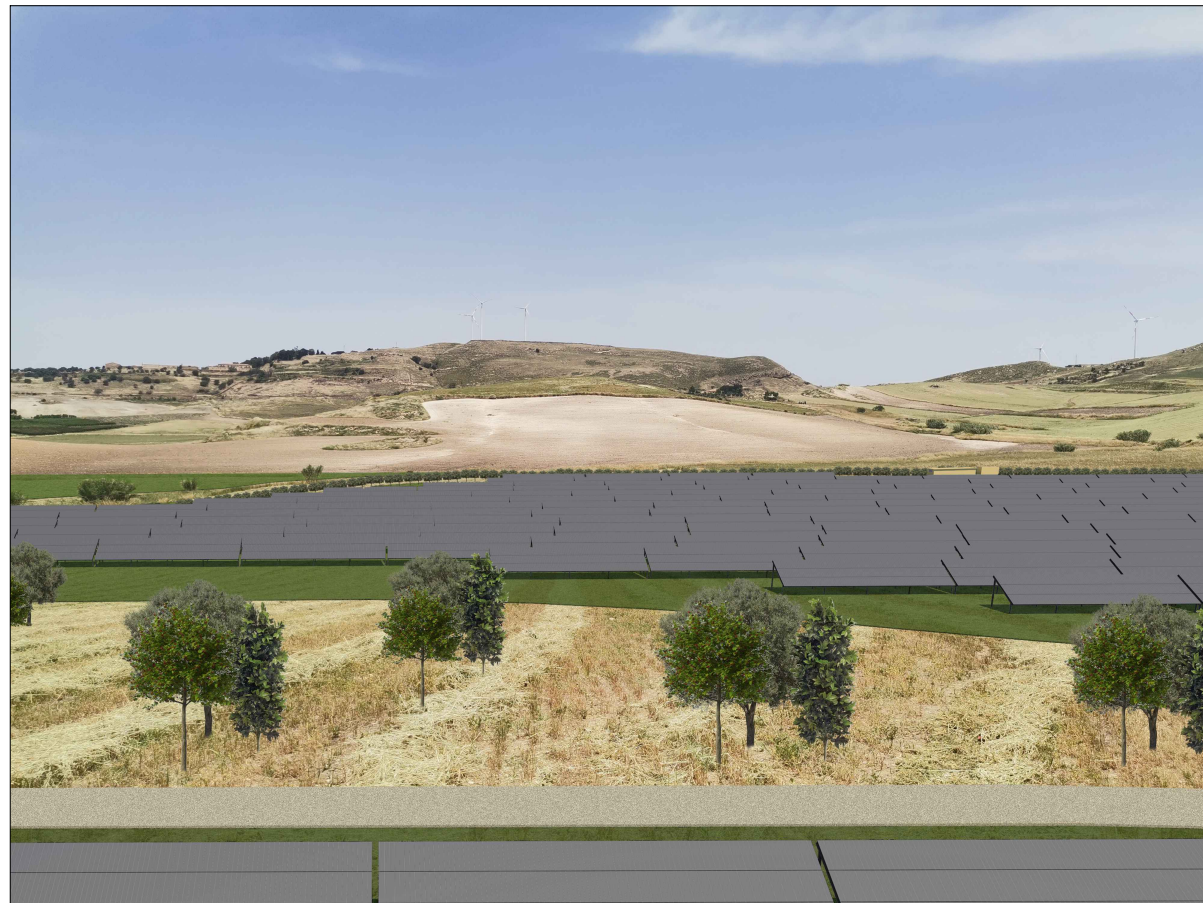
VISTA DETTAGLIO 3