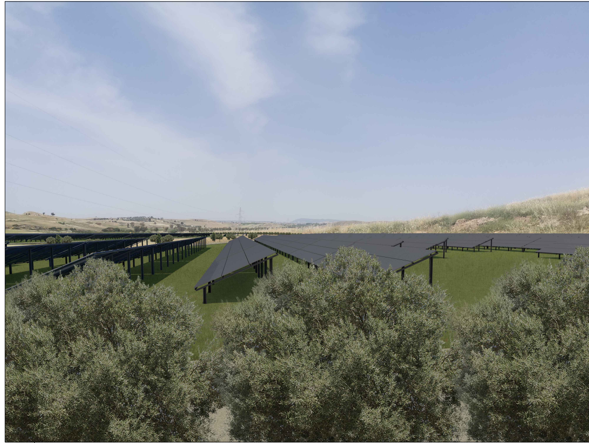
VISTA DETTAGLIO 1