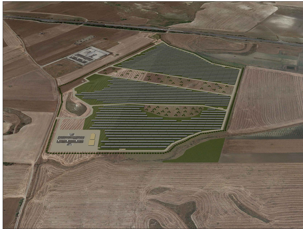
VISTA DA NORD