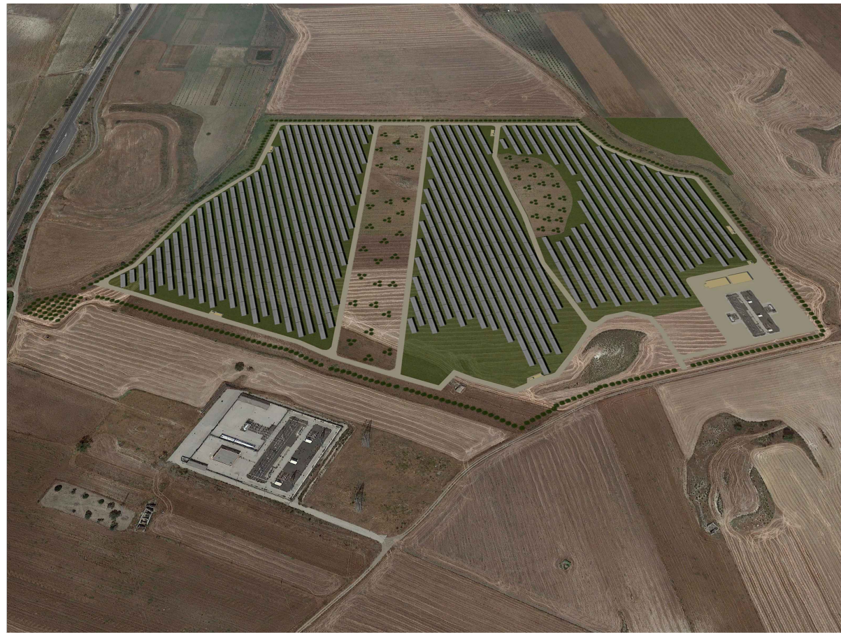
VISTA DA EST