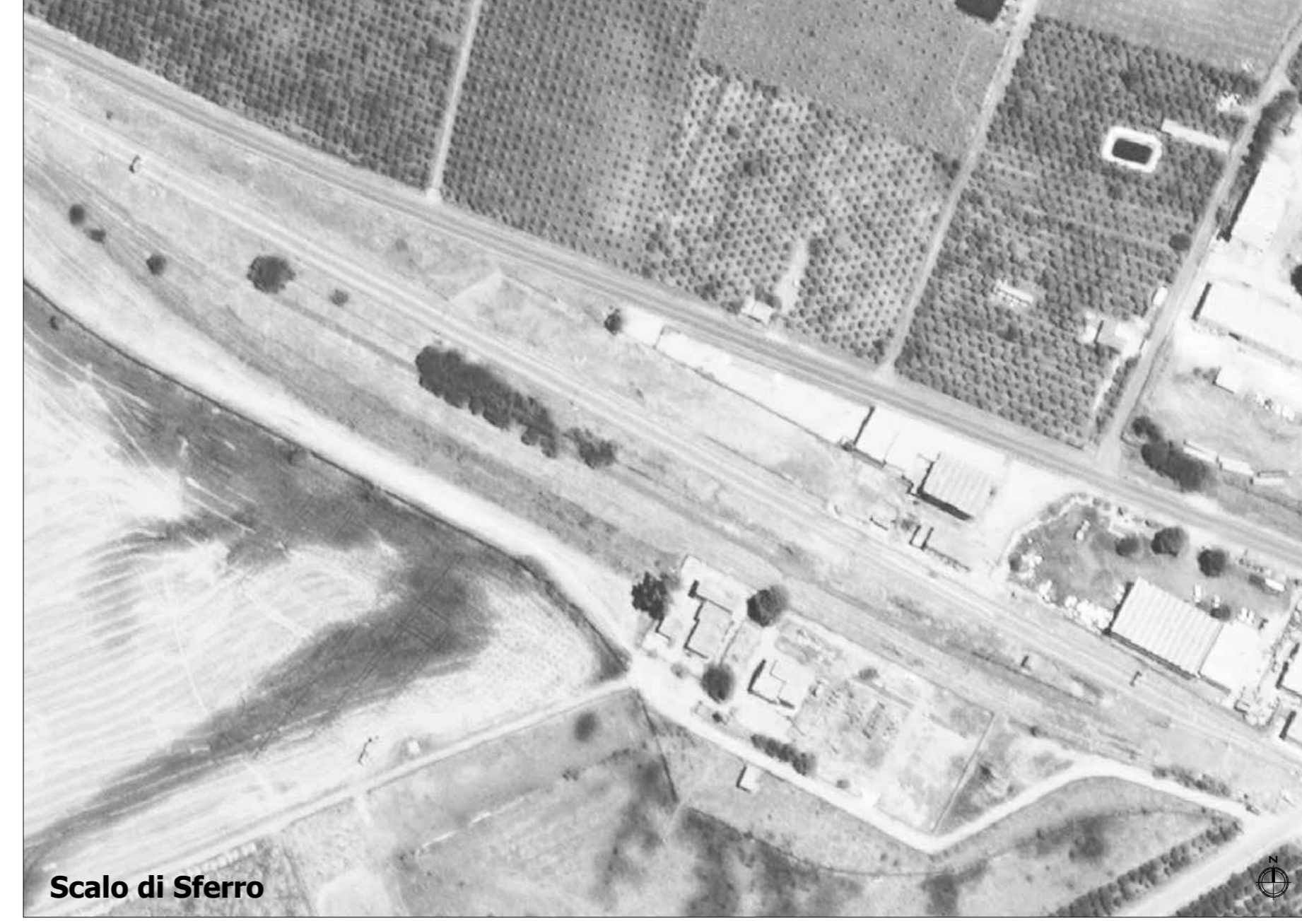
Scalo di Sferro