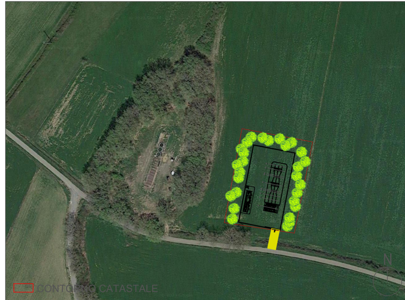
INQUADRAMENTO SU ORTOFOTO | SCALA 1: 1000