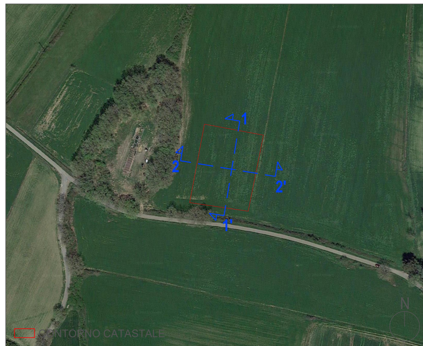
INQUADRAMENTO SU ORTOFOTO | SCALA 1: 2000