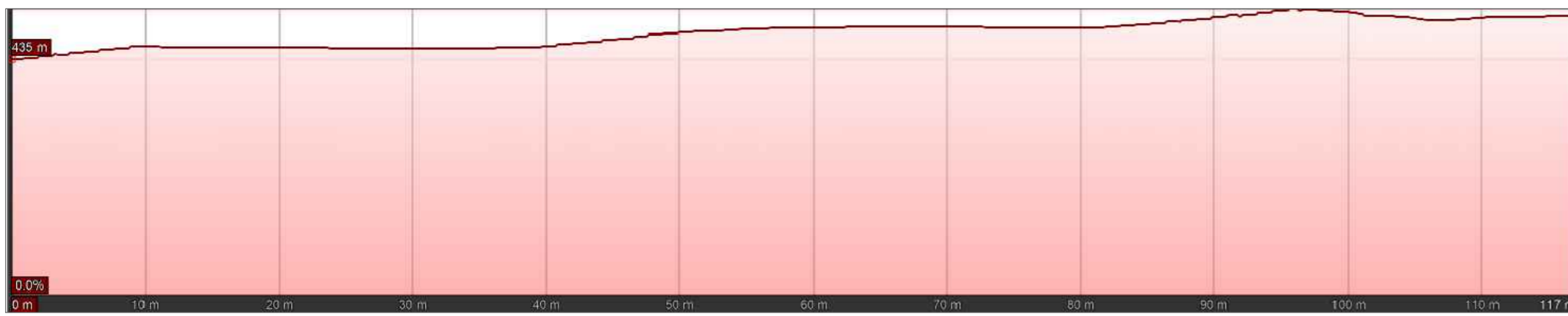
PROFILO PLANO-ALTIMETRICO - SEZIONE 1-1'