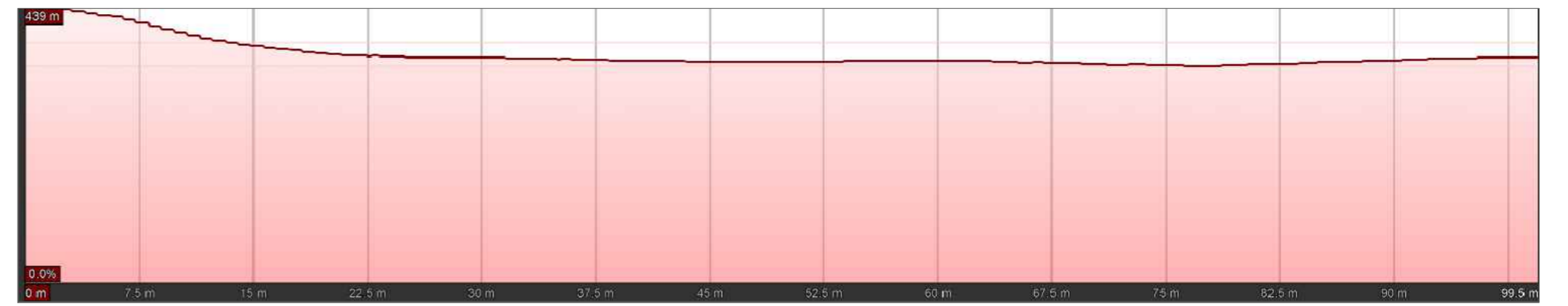
PROFILO PLANO-ALTIMETRICO - SEZIONE 2-2'