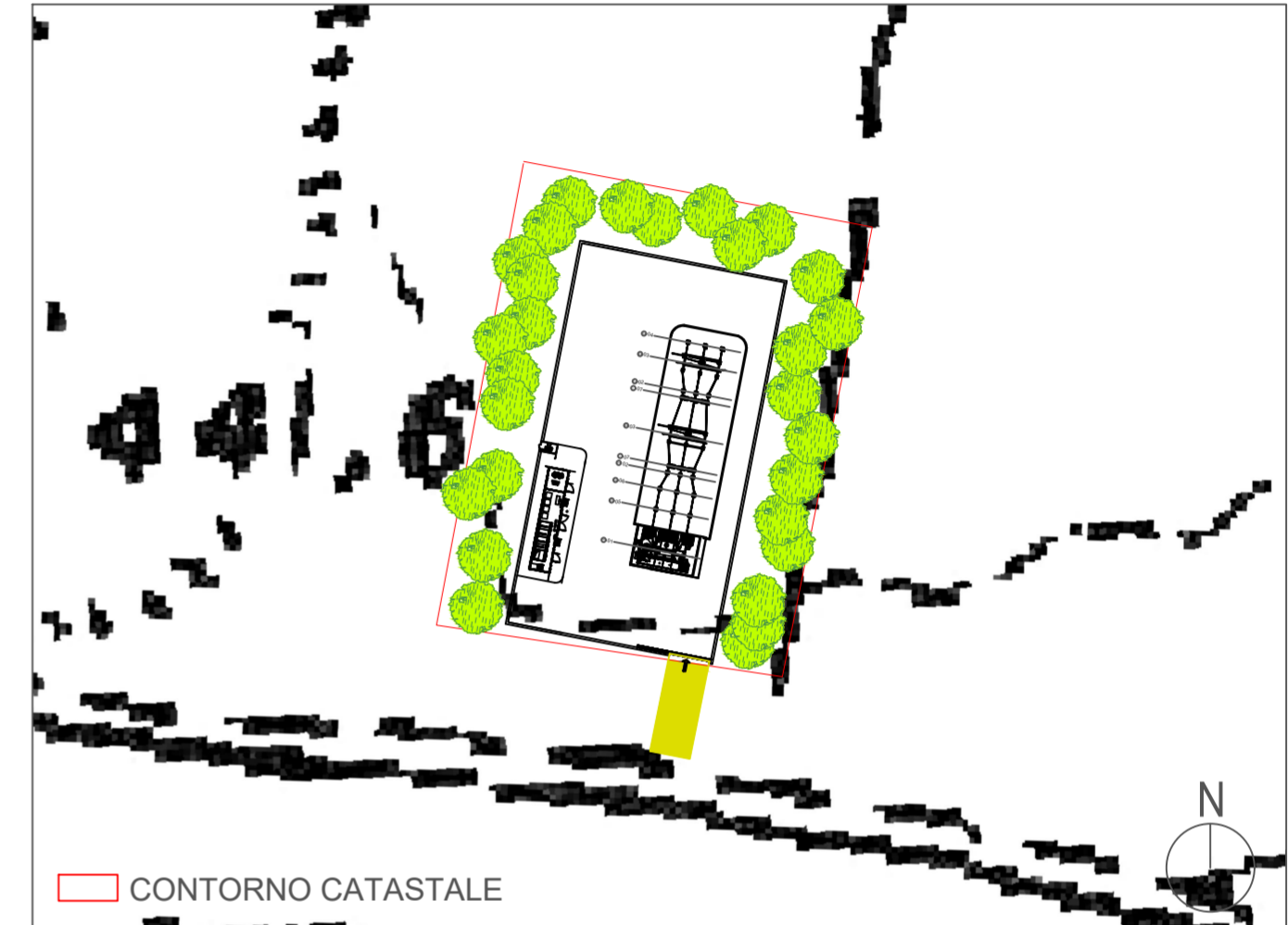
INQUADRAMENTO SU CARTA TECNICA REGIONALE | SCALA 1: 1000