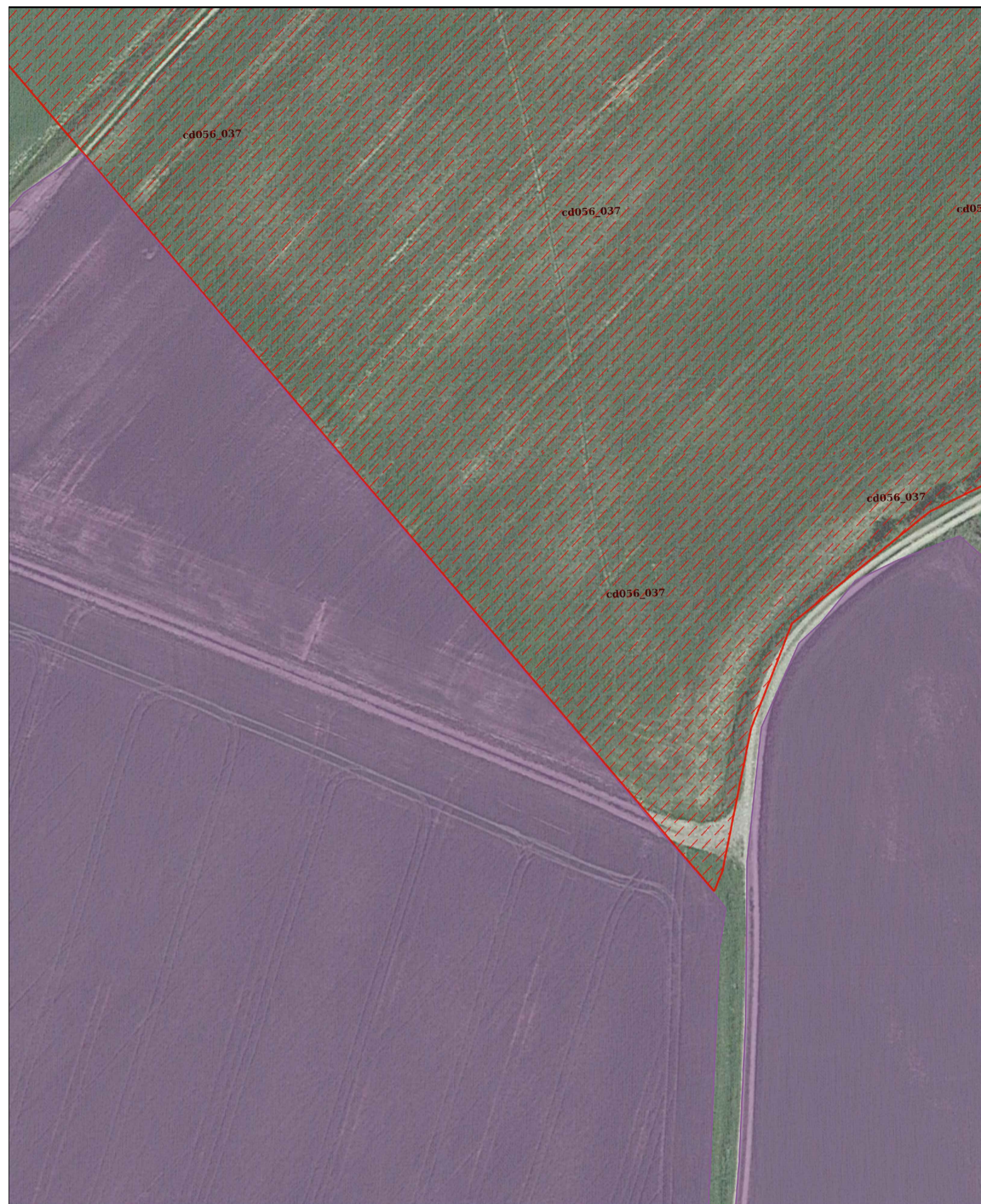
PARTICOLARE IN SCALA 1:1000 Si evidenzia che l'area d'impianto lambisce il vincolo del DM 22-05-1985, ma le due aree non si intersecano tra di loro. La distanza dell'area di impianto rispetto al vincolo è di circa 1,00 m.