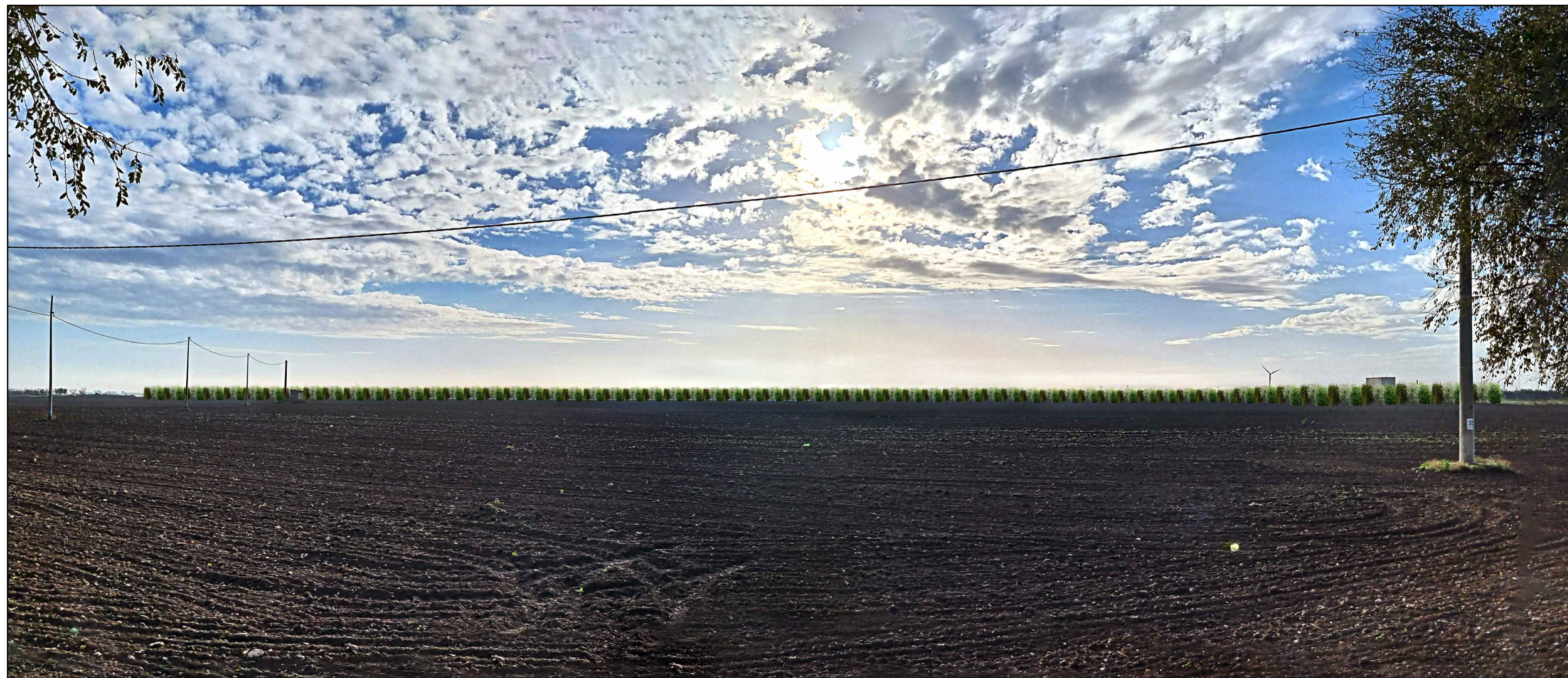
FOTOINSEERIMENTO 5 - STATO DI PROGETTO