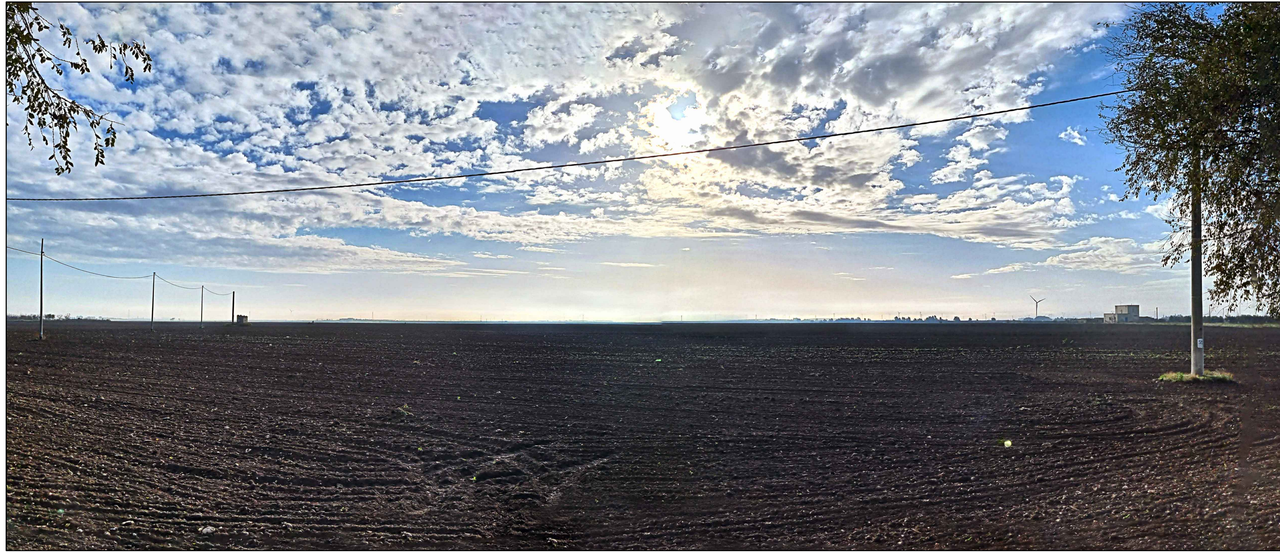
FOTOINSEERIMENTO 5 - STATO DI FATTO