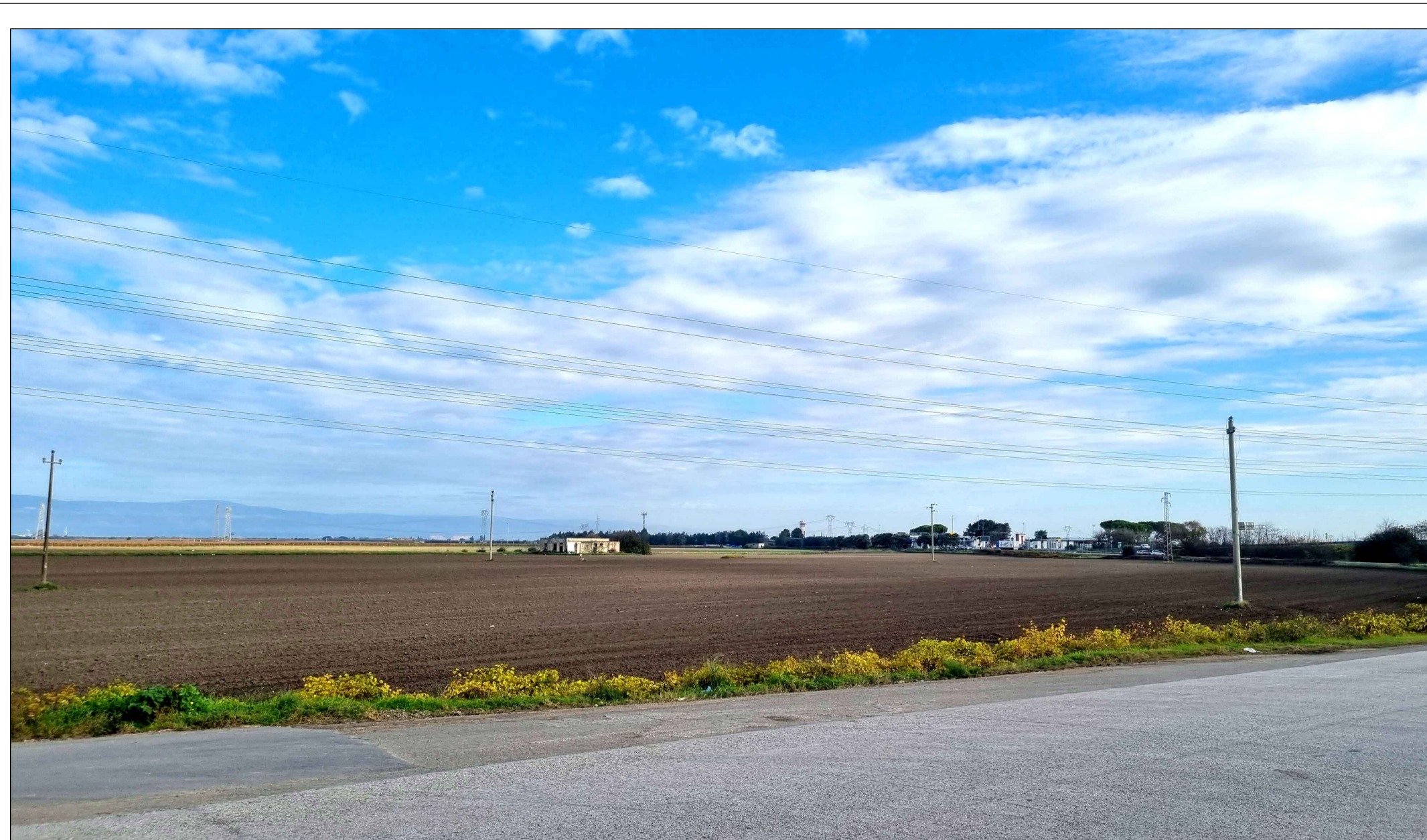
FOTOINSERIMENTO 7 - STATO DI FATTO