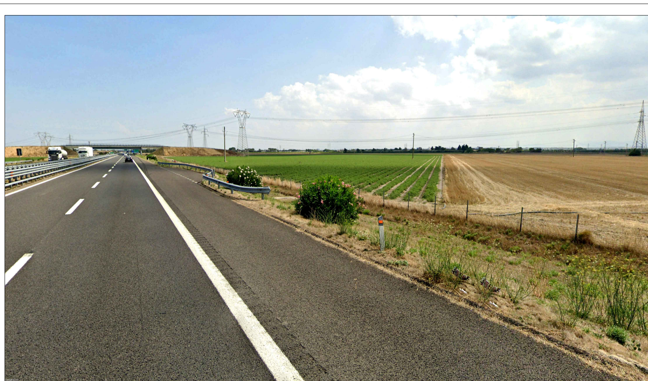
FOTOINSERIMENTO 14 - STATO DI FATTO