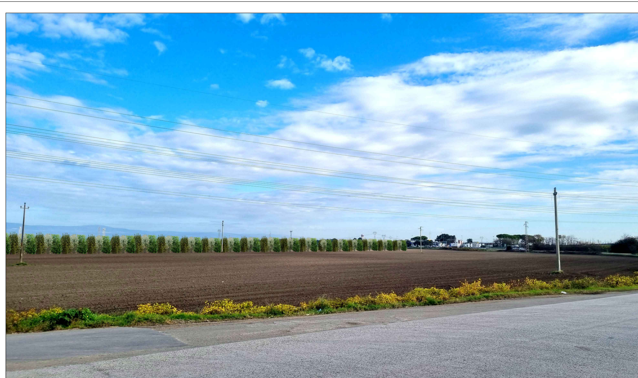
FOTOINSERIMENTO 7 - STATO DI PROGETTO