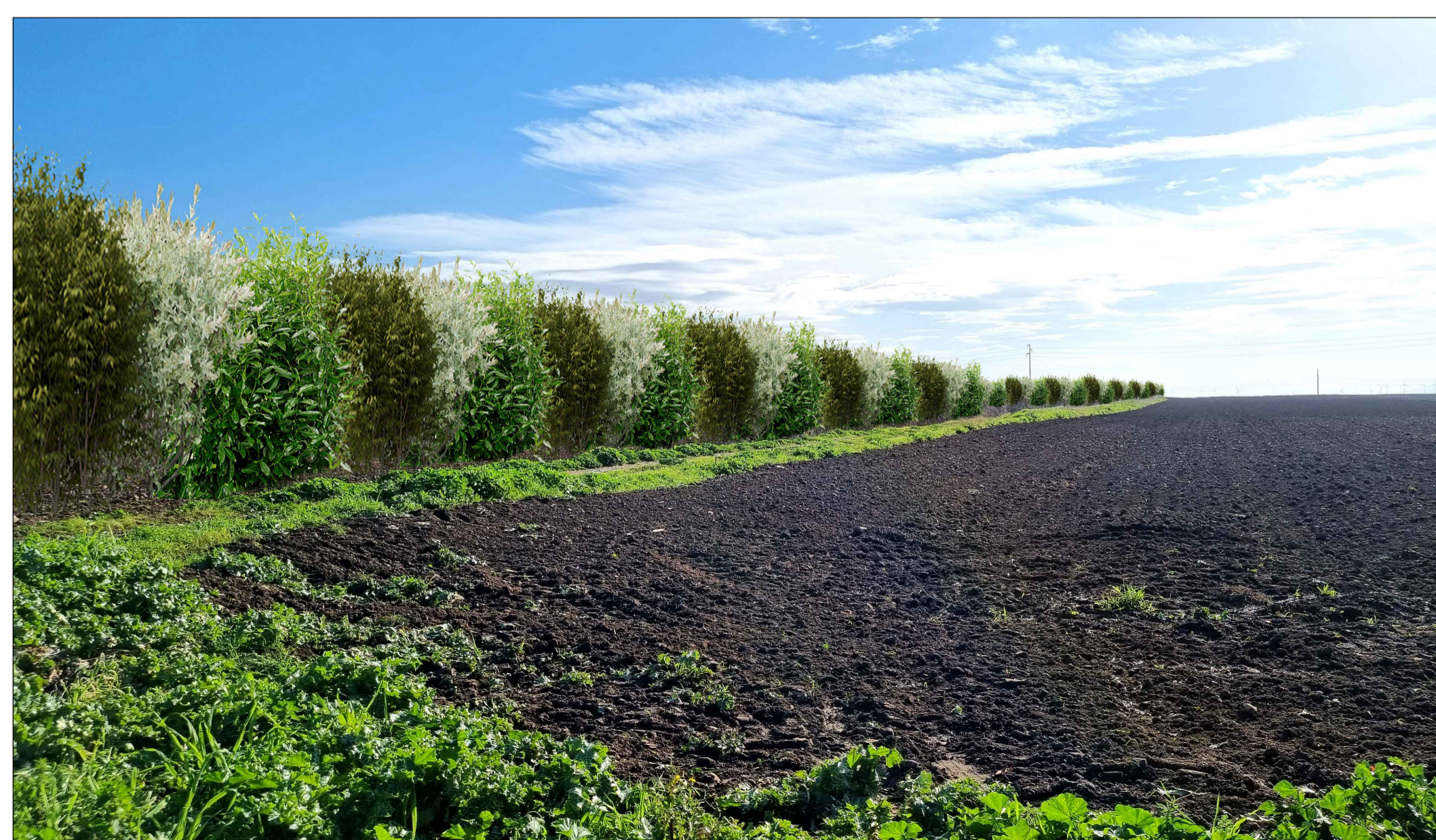
FOTOINSERIMENTO 12 - STATO DI PROGETTO