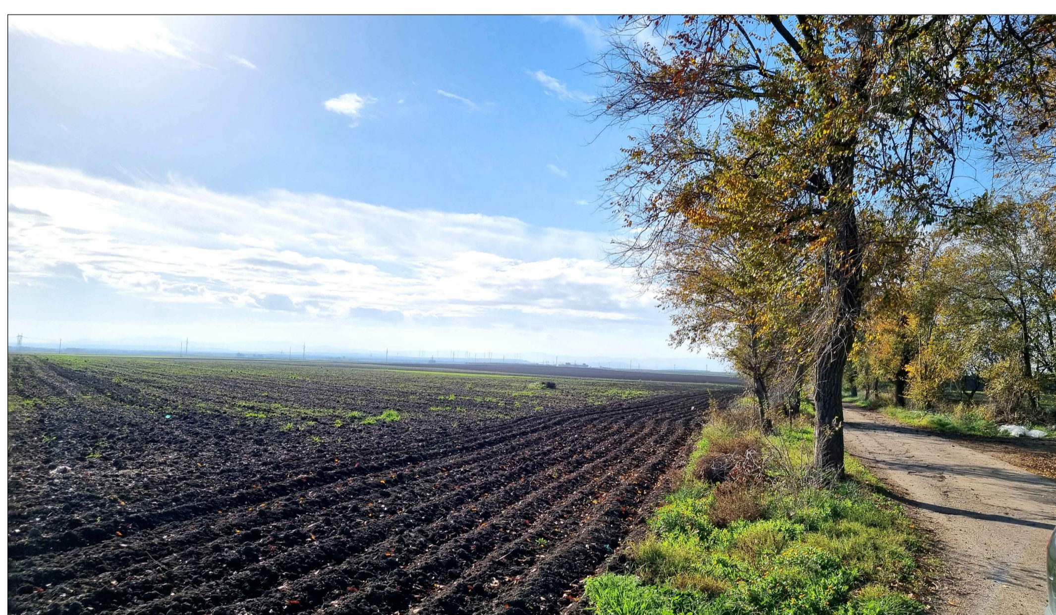
FOTOINSERIMENTO 10 - STATO DI FATTO