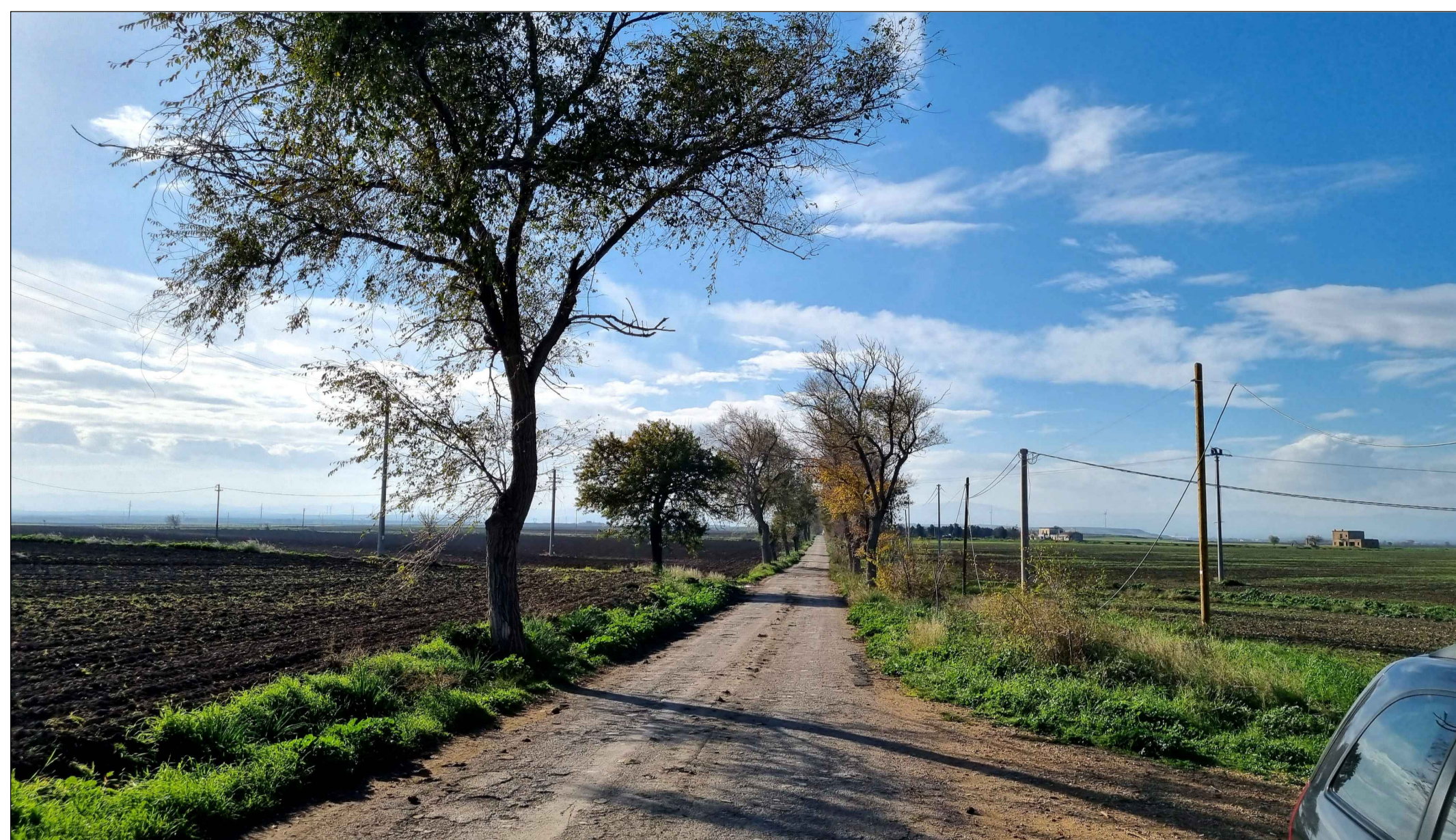
FOTOINSERIMENTO 2 - STATO DI FATTO