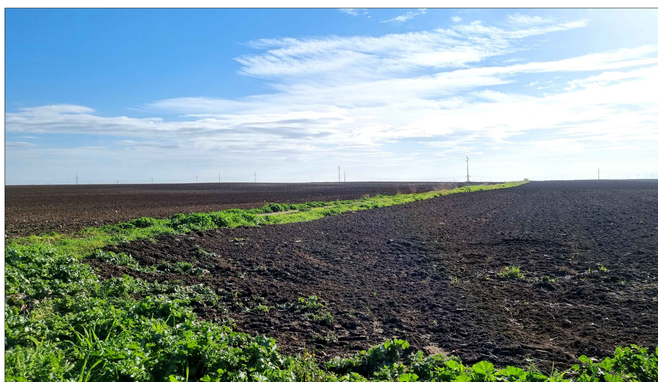
FOTOINSERIMENTO 12 - STATO DI FATTO