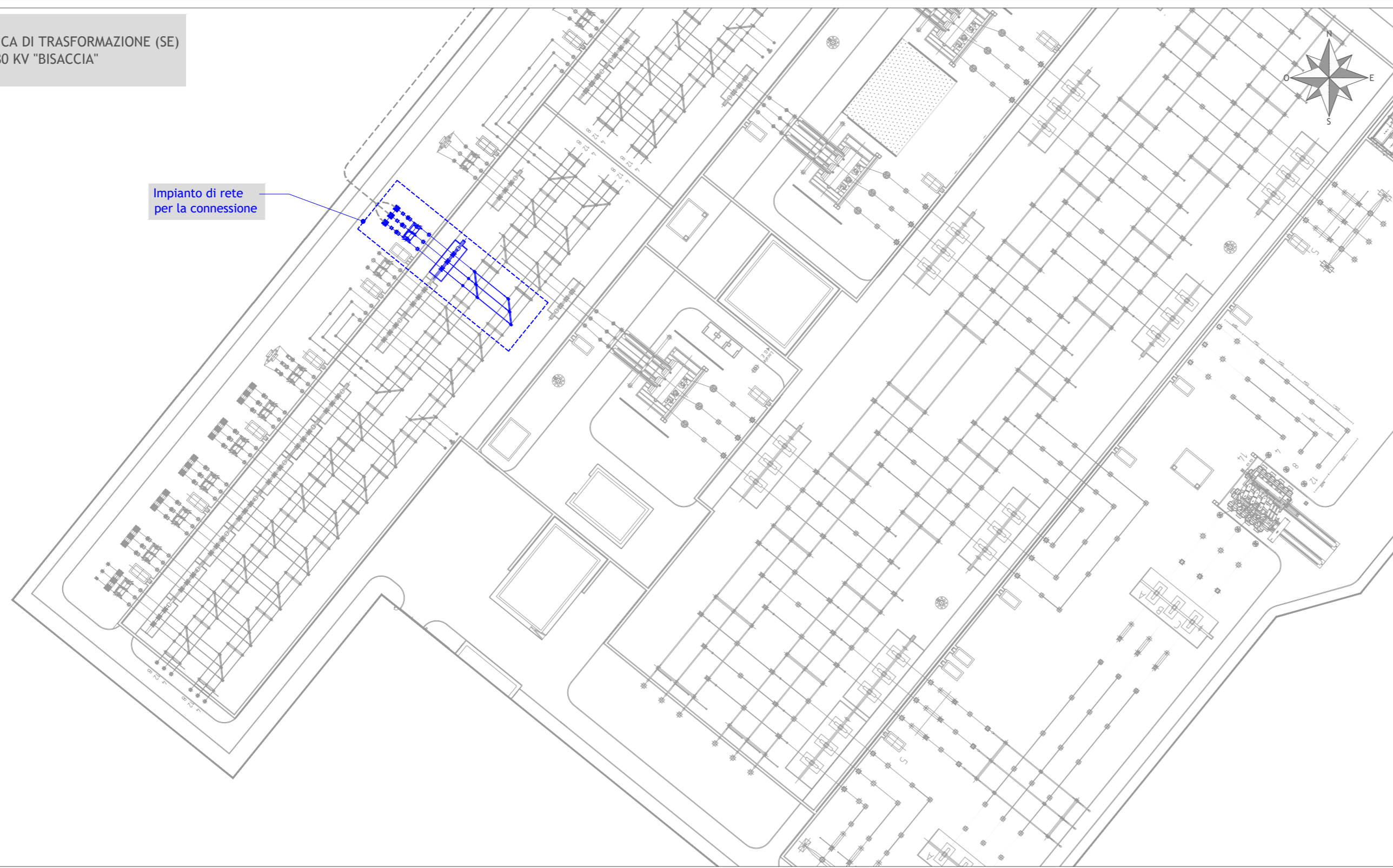
PLANIMETRIA ELETTROMECCANICA STALLO Scala: 200

INQUADRAMENTO STAZIONE ELETTRICA DI TRASFORMAZIONE (SE) DELLA RTN 150/380 KV "BISACCIA" SCALA 1:1.000