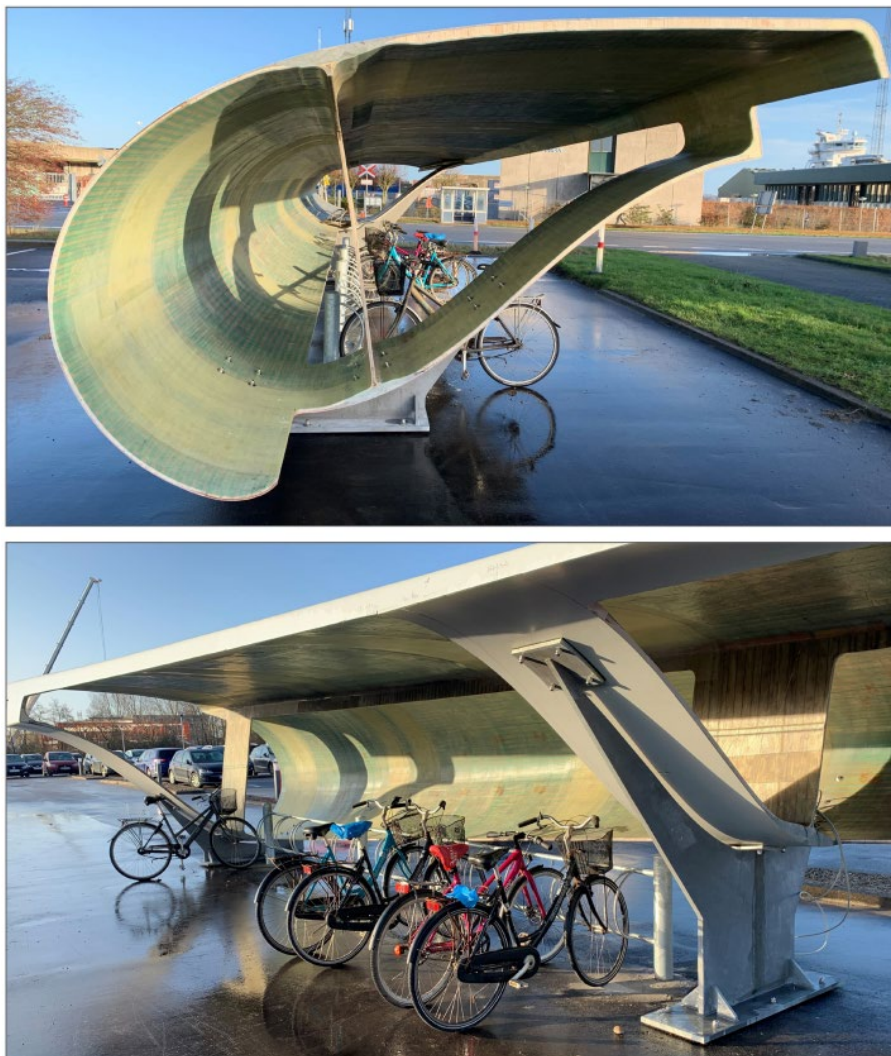
Figura 2 - Bike shed in Aalborg, Denmark