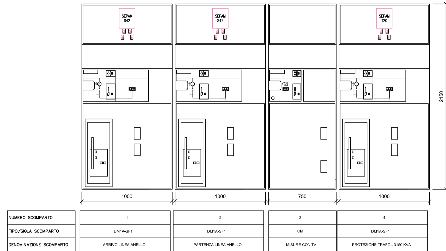
VISTA FRONTALE TIPICO QMT - 30KV DI CAMPO