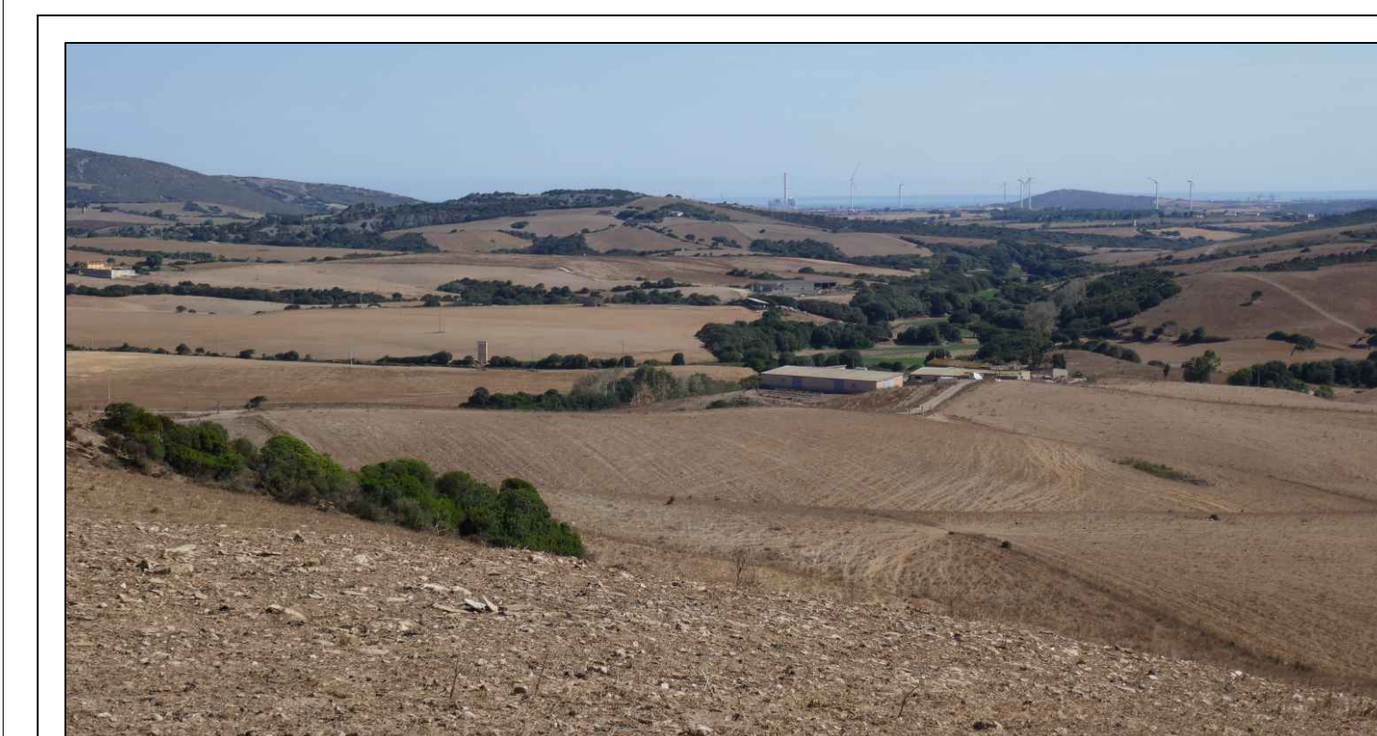
PROGETTO DEFINITIVO DELL'IMPIANTO AGRIVOLTICO DELLA POTENZA DI PICCO DI 360MW CON SISTEMA DI ACCUMULO DI CAPACITA' PARI A 62,5MWH E RELATIVE OPERE DI CONNESSIONE ALLA RETE RTN, DA REALIZZARSI NEL COMUNE DI SASSARI NELLE FRAZIONI DI "PALMAIOLA, LA CORTE, CANAGLIA, LI PIANI, SAN GIORGIO, SCALA ERRE"

TUTTE LE COORDINATE SONO RIFERITE AL SISTEMA ETRS-UTM ZONA 32N