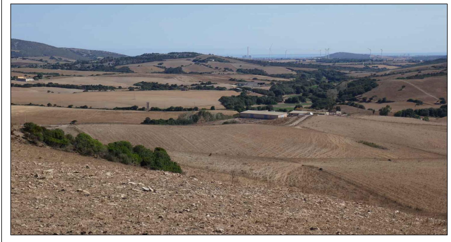
PROGETTO DEFINITIVO DELL'IMPIANTO AGRIVOLTAICO DELLA POTENZA DI PICCO DI 360MW CON SISTEMA DI ACCUMULO DI CAPACITÀ PARI A 82.5MWH E RELATIVE OPERE DI CONNESSIONE ALLA RETE RTN, DA REALIZZARSI NEL COMUNE DI SASSARI NELLE FRAZIONI DI PALMADULA, LA CORTE, CANAGLIA, LI PIANI, SAN GIORGIO, SCALA ERRE"

TUTTE LE COORDINATE SONO REFERITE AL SISTEMA ETRUSUM ZONA 32N