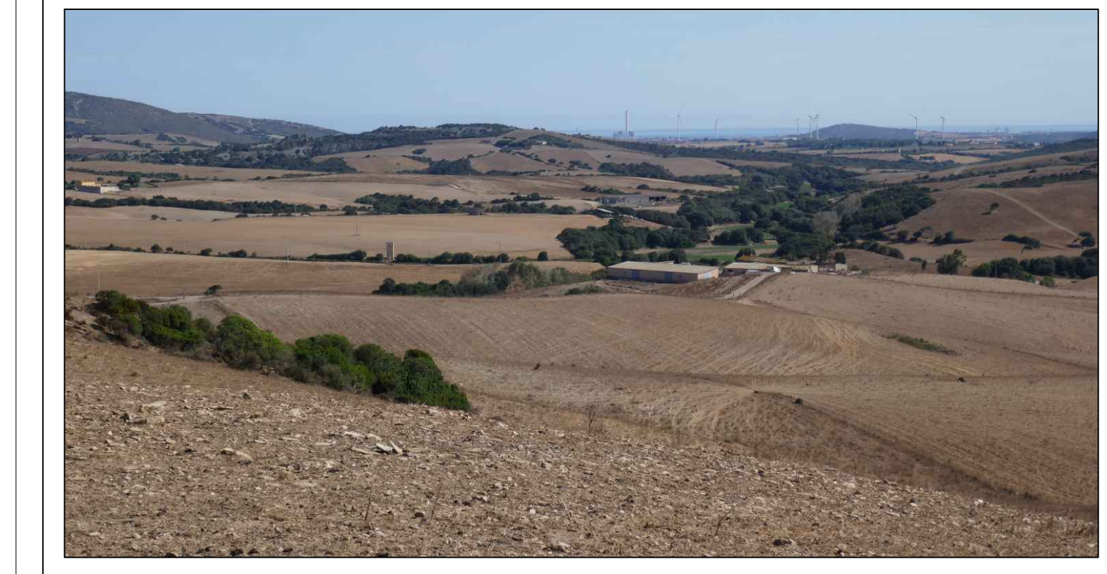
PROGETTO DEFINITIVO DELL'IMPIANTO AGRIVOLTICO DELLA POTENZA DI PICCO DI 360MW CON SISTEMA DI ACCUMULO DI CAPACITÀ PARI A 82,5MWH E RELATIVE OPERE DI CONNESSIONE ALLA RETE RTN, DA REALIZZARSI NEL COMUNE DI SASSARI NELLE FRAZIONI DI PALMADULA, LA CORTE, CANAGLIA, LI PIANI, SAN GIORGIO, SCALA ERRE"

TUTTE LE COORDINATE SONO RIFERITE AL SISTEMA ETRUSUM ZONA 32N