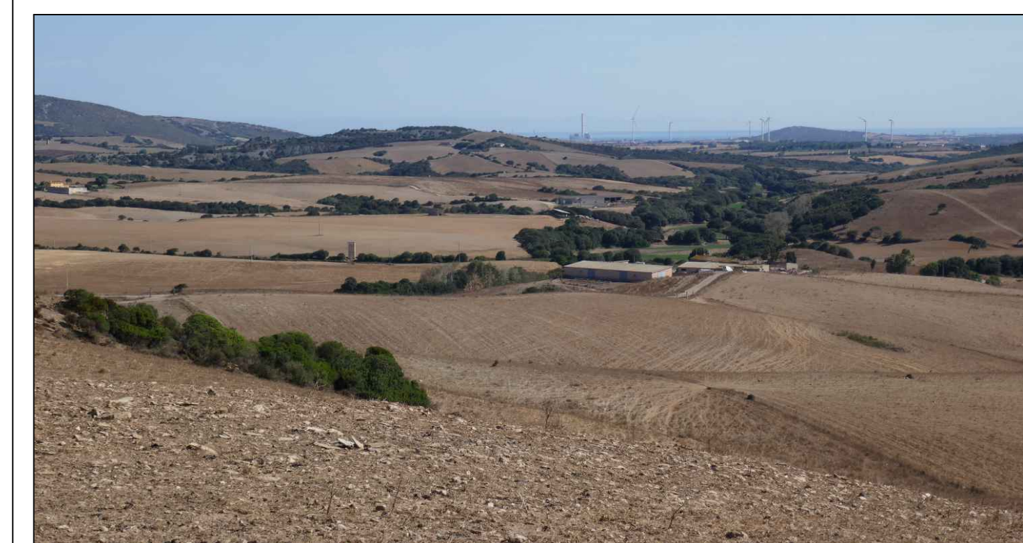
PROGETTO DEFINITIVO DELL'IMPIANTO AGRIVOLTAICO DELLA POTENZA DI PICCO DI 360MW CON SISTEMA DI ACCUMULO DI CAPACITA' PARI A 82,5MWH E RELATIVE OPERE DI CONNESSIONE ALLA RETE RTN, DA REALIZZARSI NEL COMUNE DI SASSARI NELLE FRAZIONI DI 'PALMADULA, LA CORTE, CANAGLIA, LI PIANI, SAN GIORGIO, SCALA ERRE''

TUTTE LE COORDINATE SONO RIFERITE AL SISTEMA ETRS-UTM ZONA 32N