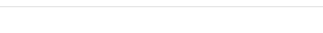
SCHEMA DI PERCORSO TATTILE