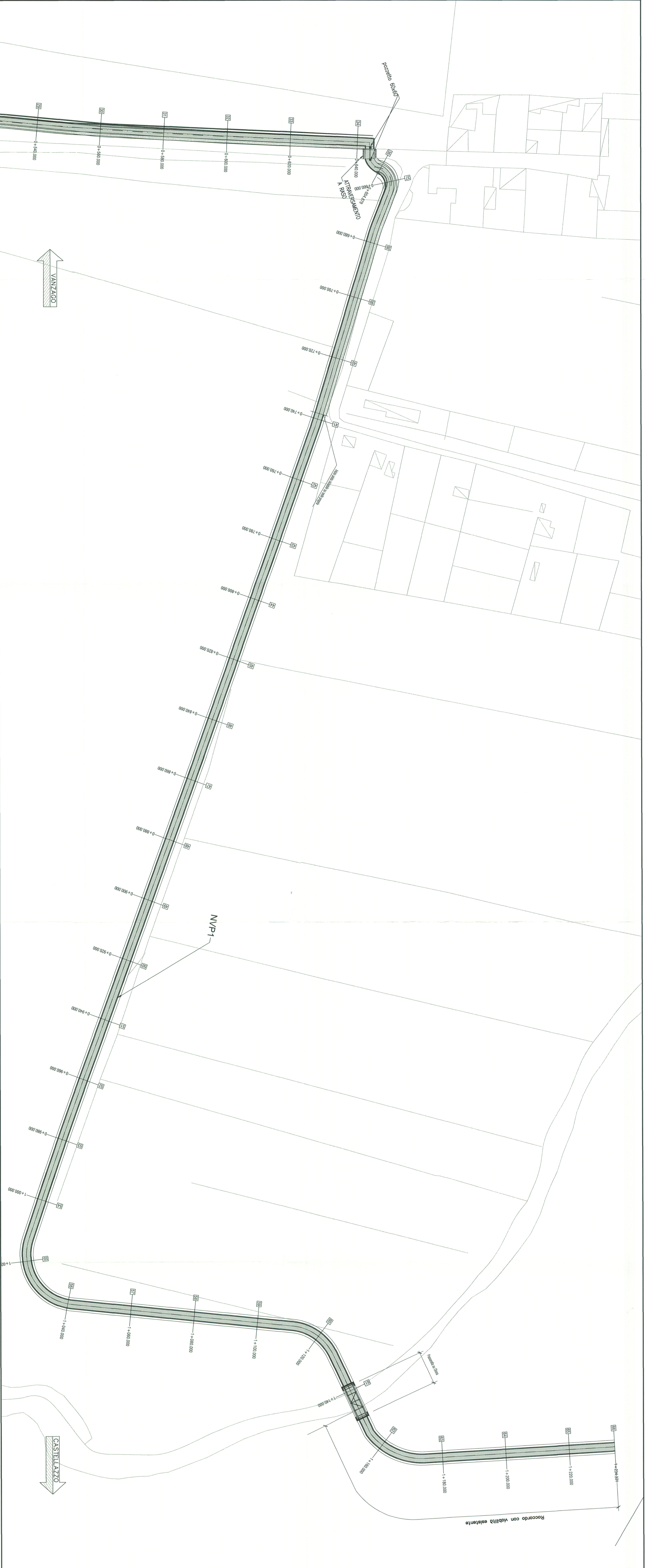
PLANIMETRIA DI TRACCIAMENTO SCALA 1:500