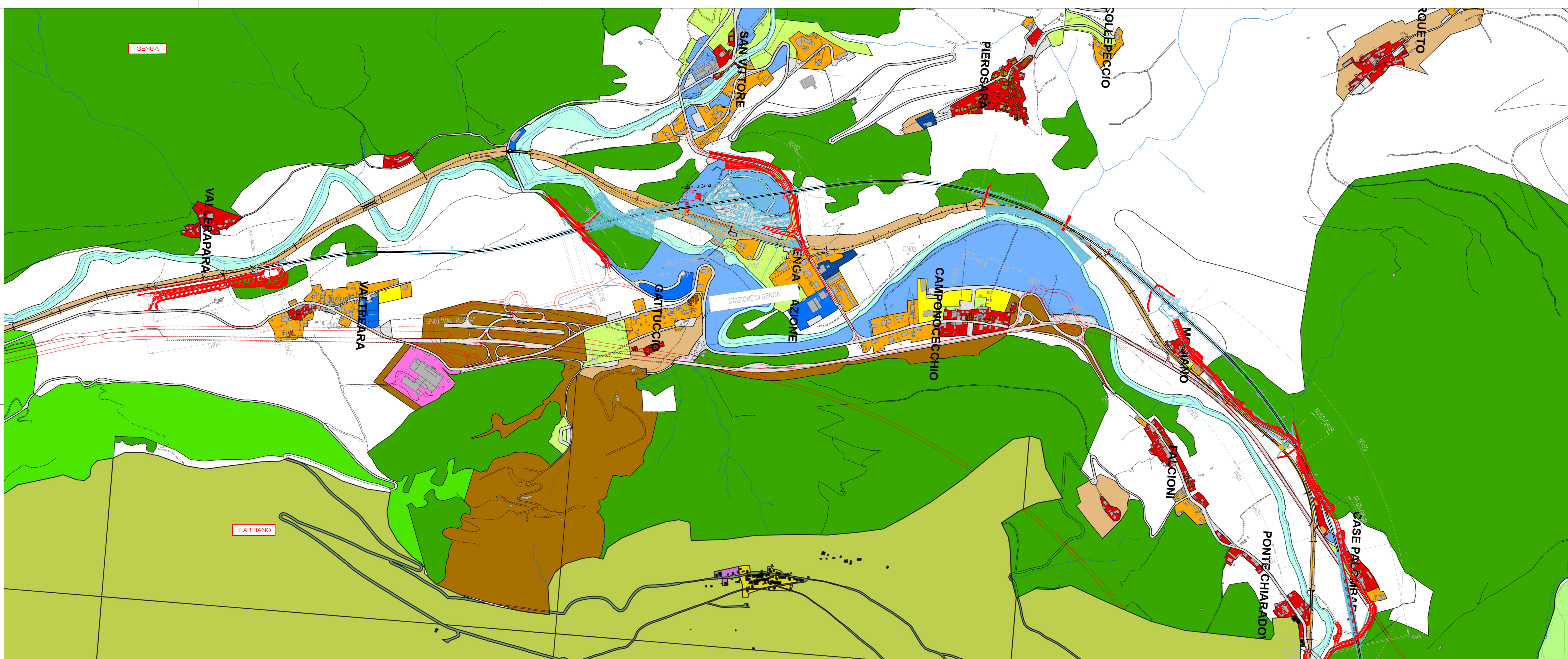
TRATTO A - PLANIMETRIA DELL'USO PROGRAMMATO DEL SUOLO