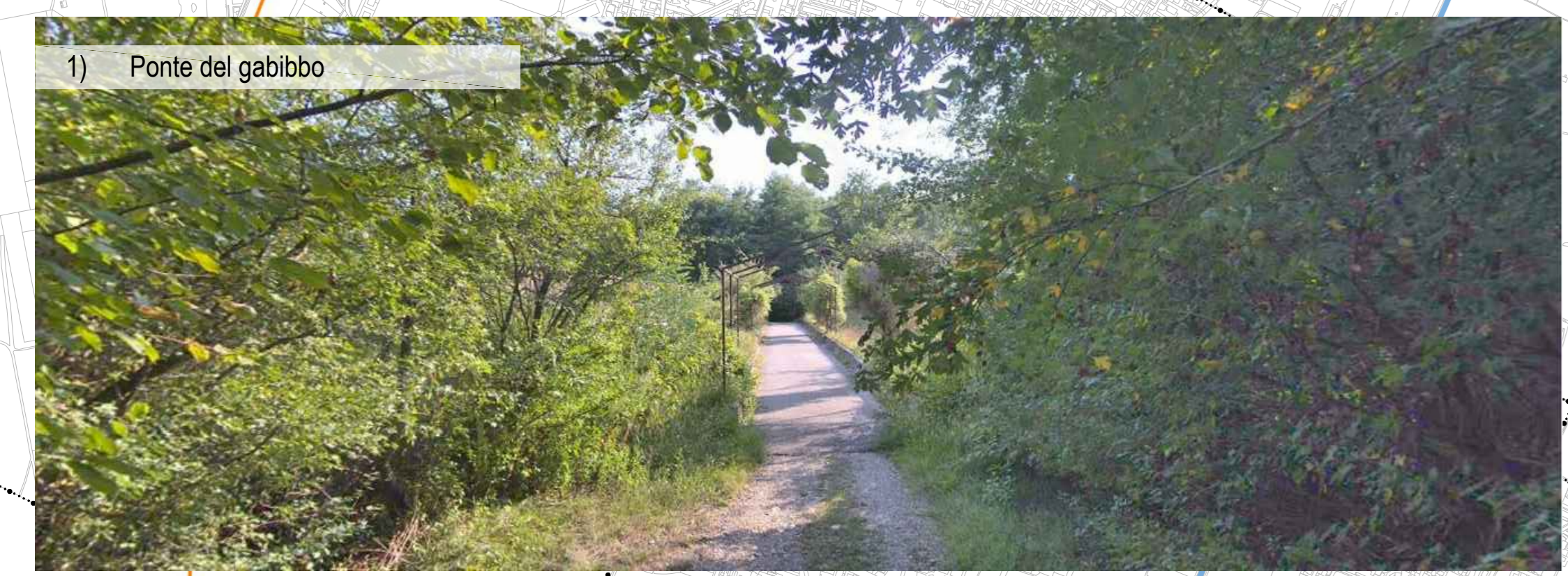
1) Ponte del gabibbo