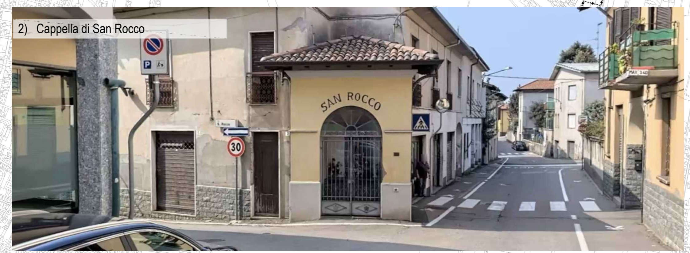
2) Cappella di San Rocco