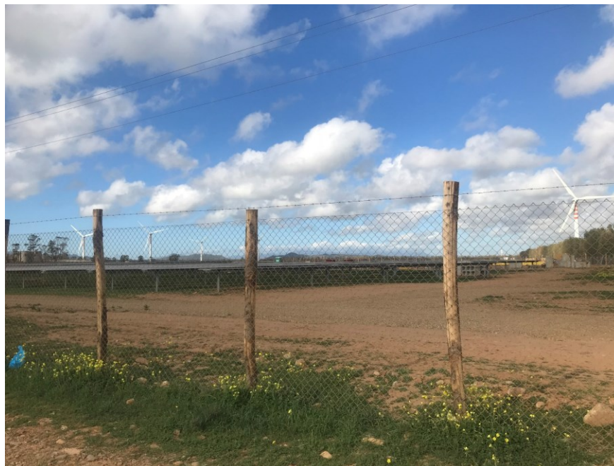
Tipologia di recinzione utilizzata

Al fine di permettere alla piccola fauna presente nella zona di utilizzare l'area di impianto, sono previsti dei ponti ecologici consistenti nel rialzare la rete perimetrale di recinzione di circa 25 cm.