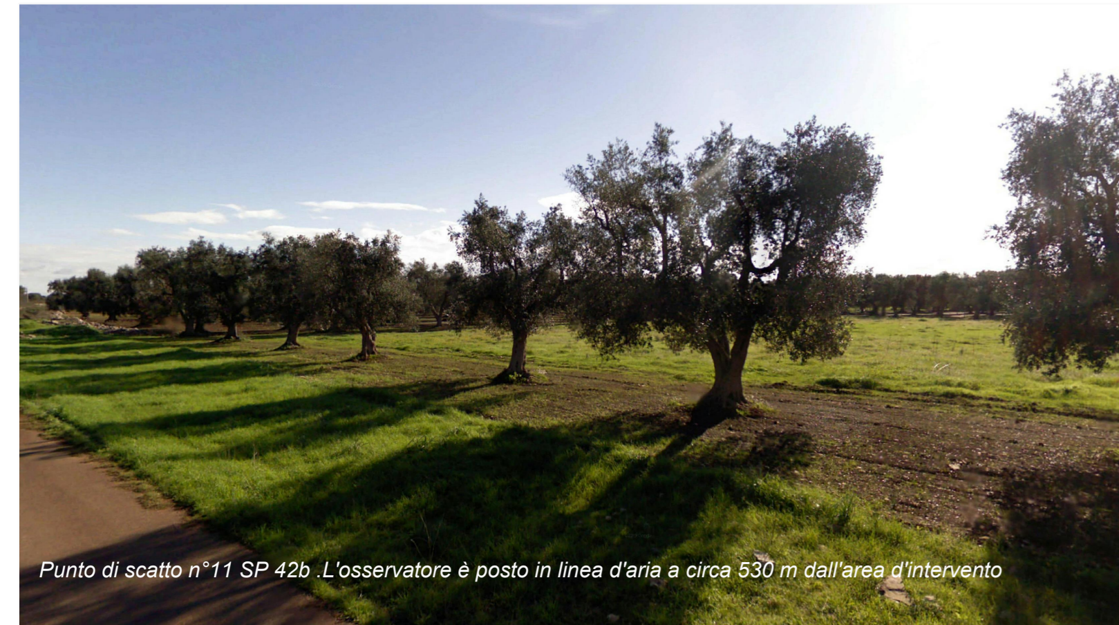
Punto di scatto n°11 SP 42b .L'osservatore è posto in linea d'aria a circa 530 m dall'area d'intervento