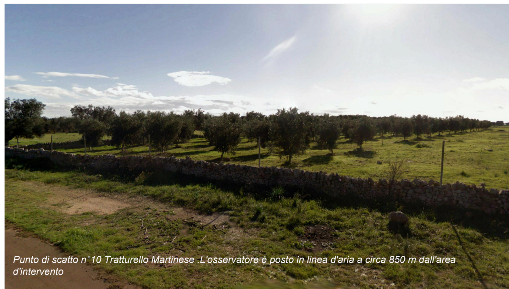
Punto di scatto n°10 Tratturello Martinese .L'osservatore è posto in linea d'aria a circa 850 m dall'area d'intervento