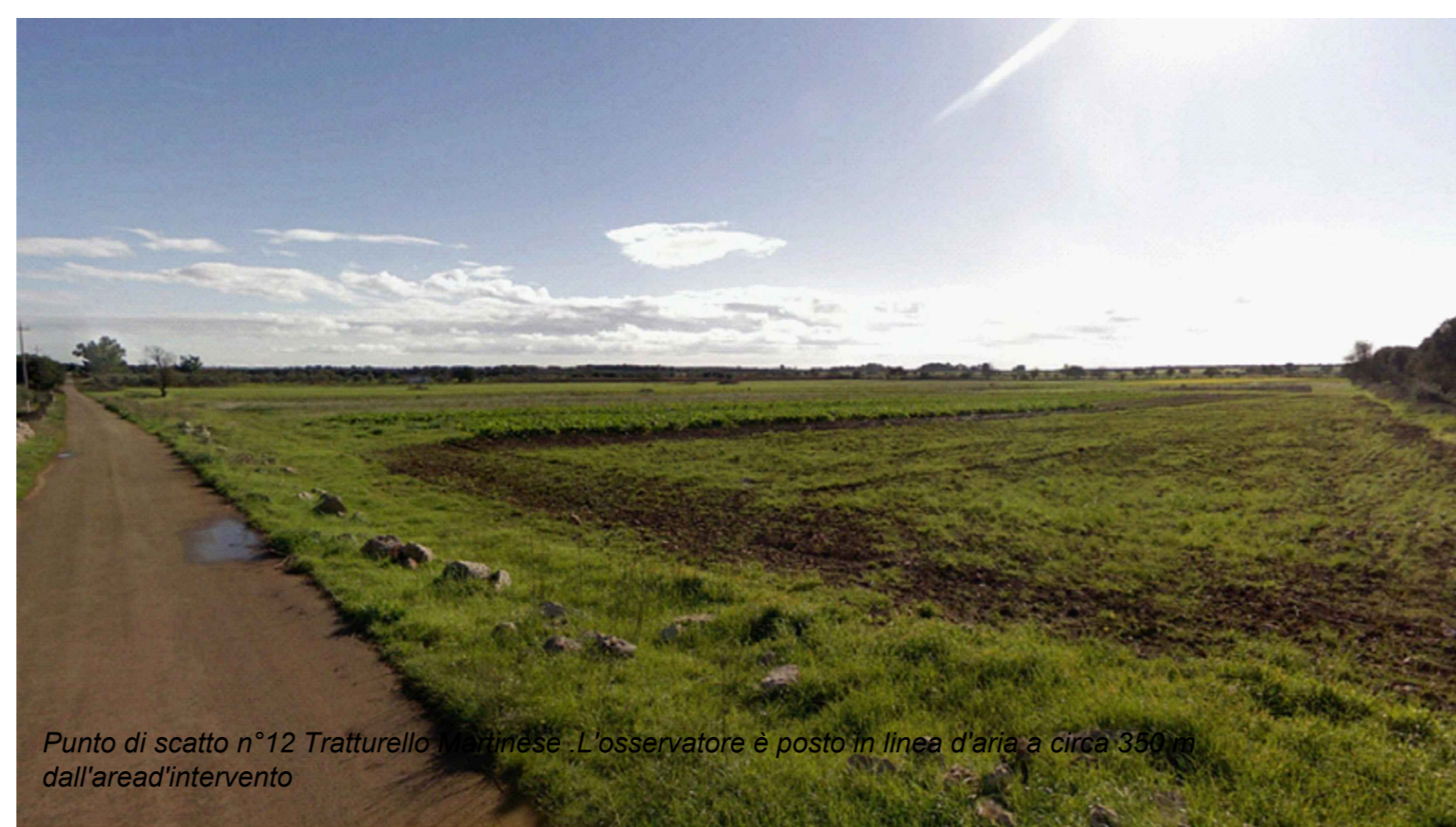
Punto di scatto n°12 Tratturello Martinese .L'osservatore è posto in linea d'aria a circa 350 m dall'area d'intervento