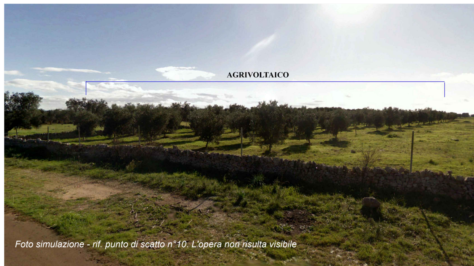
Foto simulazione - rif. punto di scatto n°10. L'opera non risulta visibile