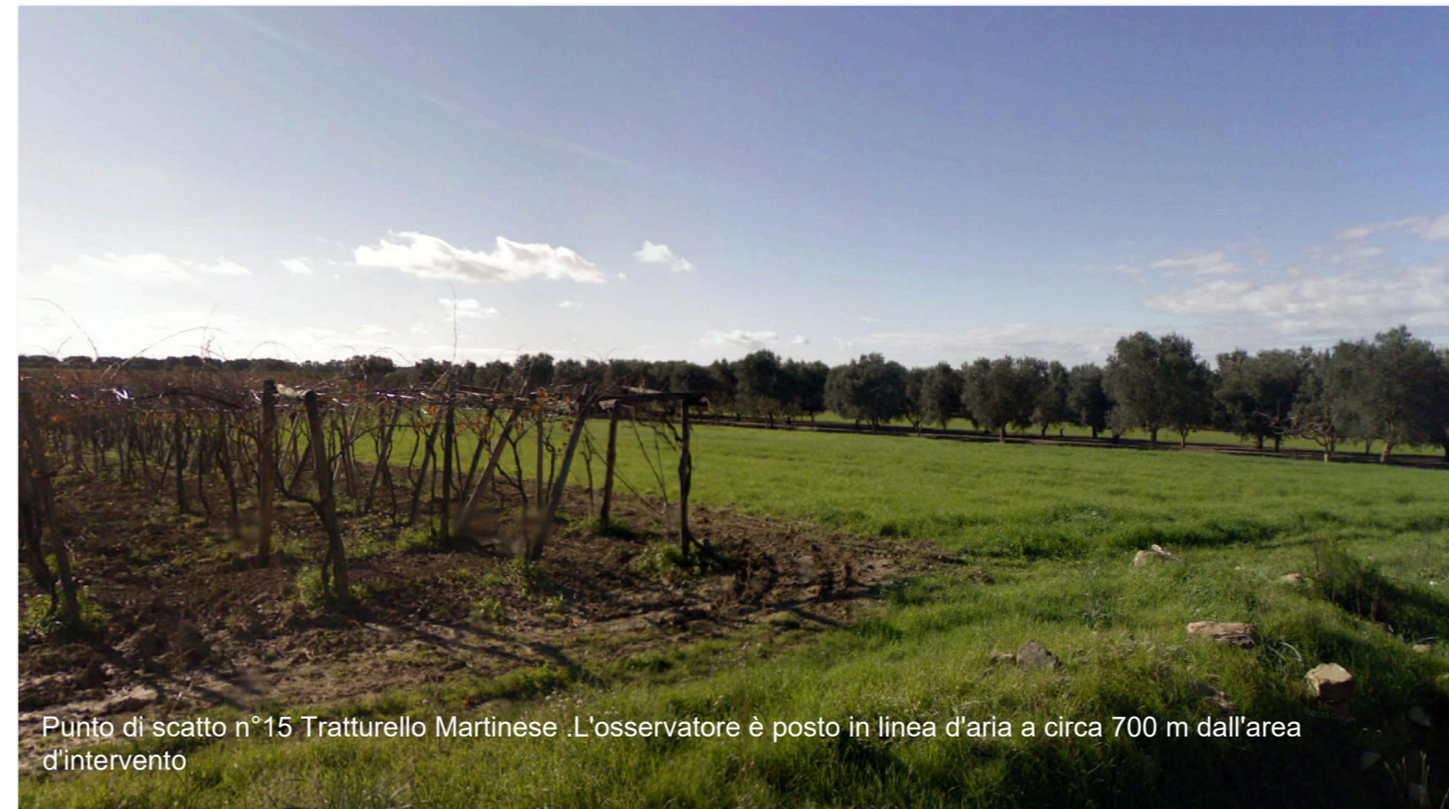
Punto di scatto n°15 Tratturello Martinese .L'osservatore è posto in linea d'aria a circa 700 m dall'area d'intervento