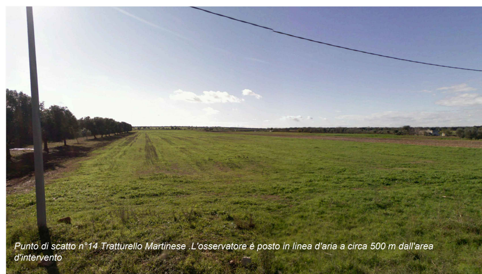
Punto di scatto n°14 Tratturello Martinese .L'osservatore è posto in linea d'aria a circa 500 m dall'area d'intervento