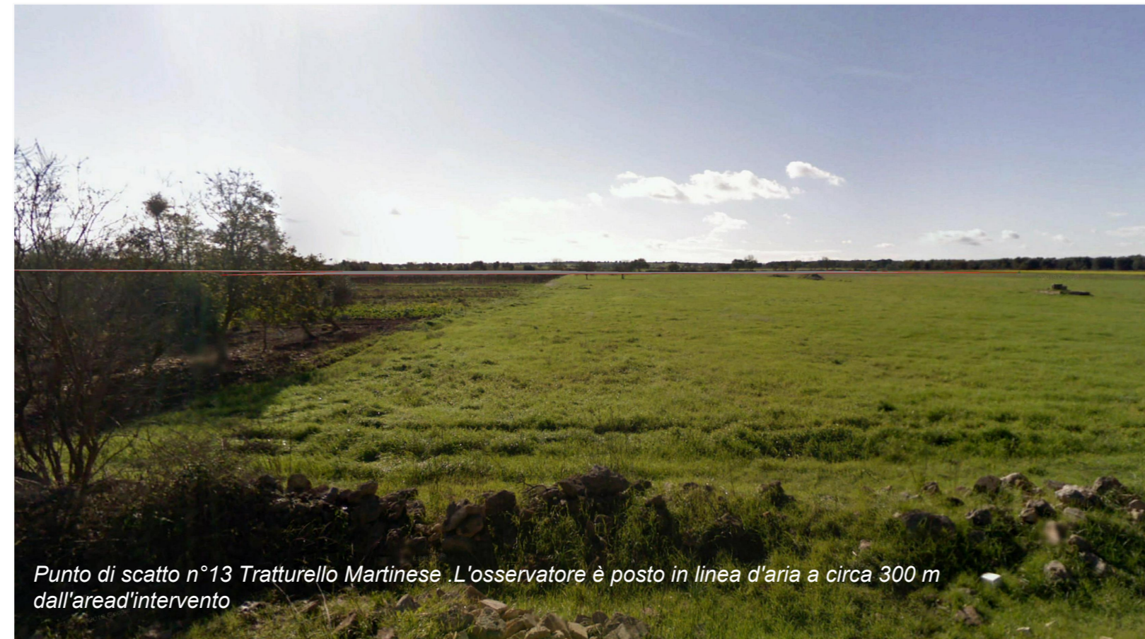
Punto di scatto n°13 Tratturello Martinese .L'osservatore è posto in linea d'aria a circa 300 m dall'area d'intervento