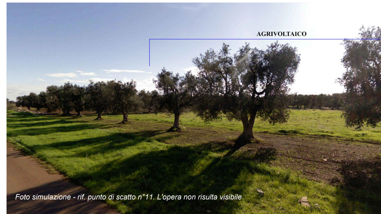
Foto simulazione - rif. punto di scatto n°11. L'opera non risulta visibile