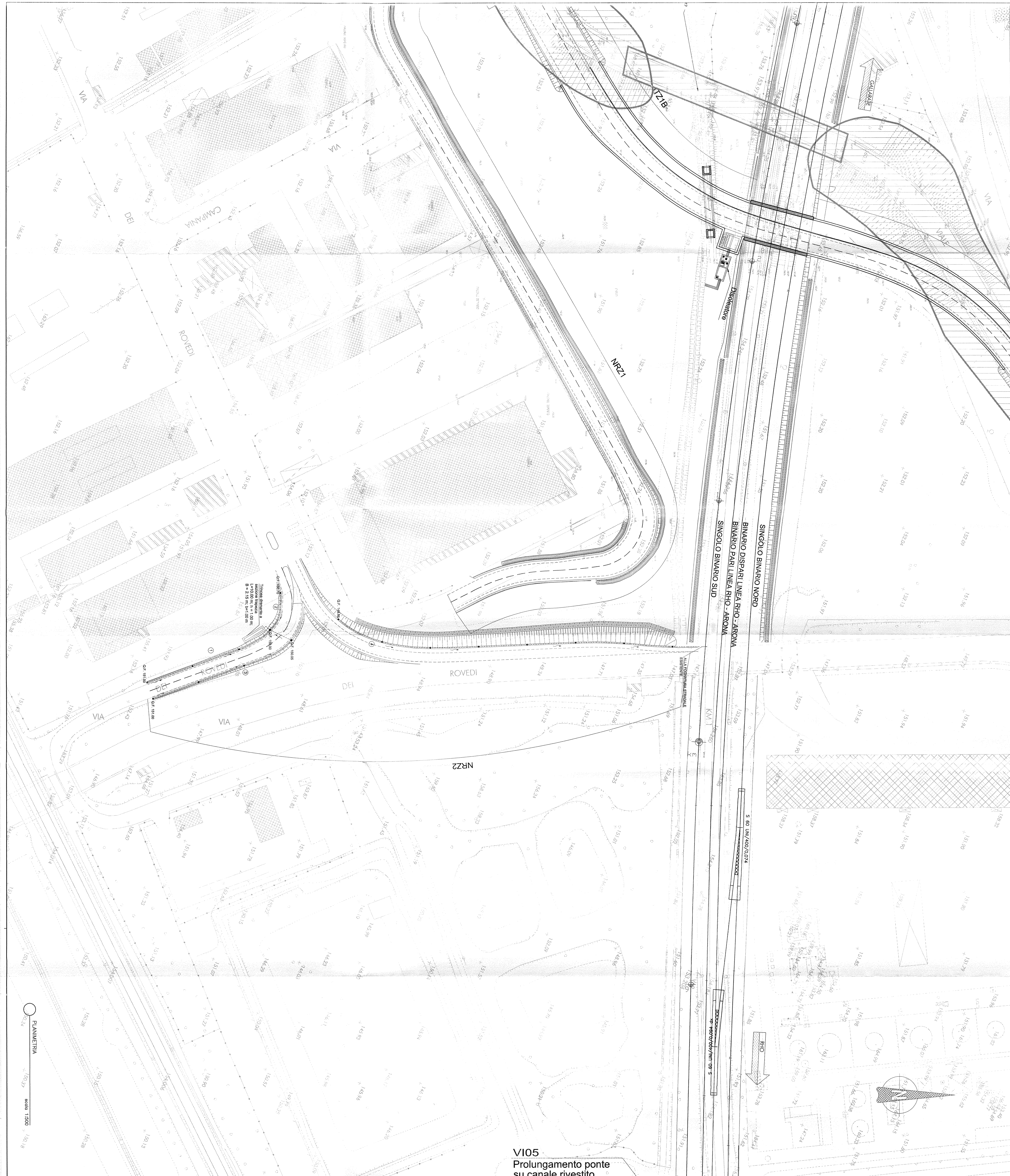
V105 Prolungamento ponte su canale rivestito