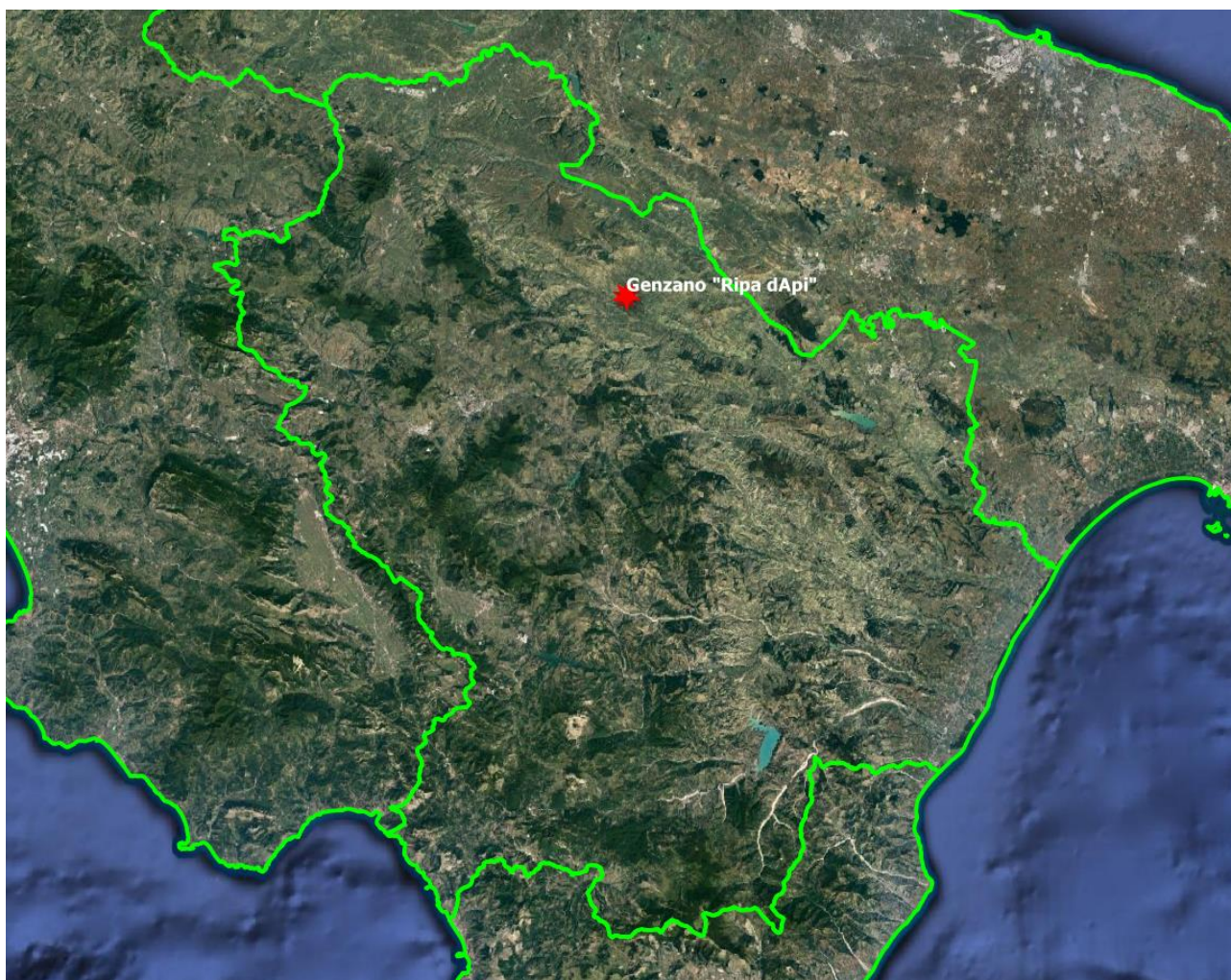
Figura 1 – Inquadramento dell'impianto FV "Ripa d'Api" su immagine satellitare

In Figura 1 è riportata la posizione del sito interessato su immagine satellitare, inquadrato nel territorio della Regione Basilicata.