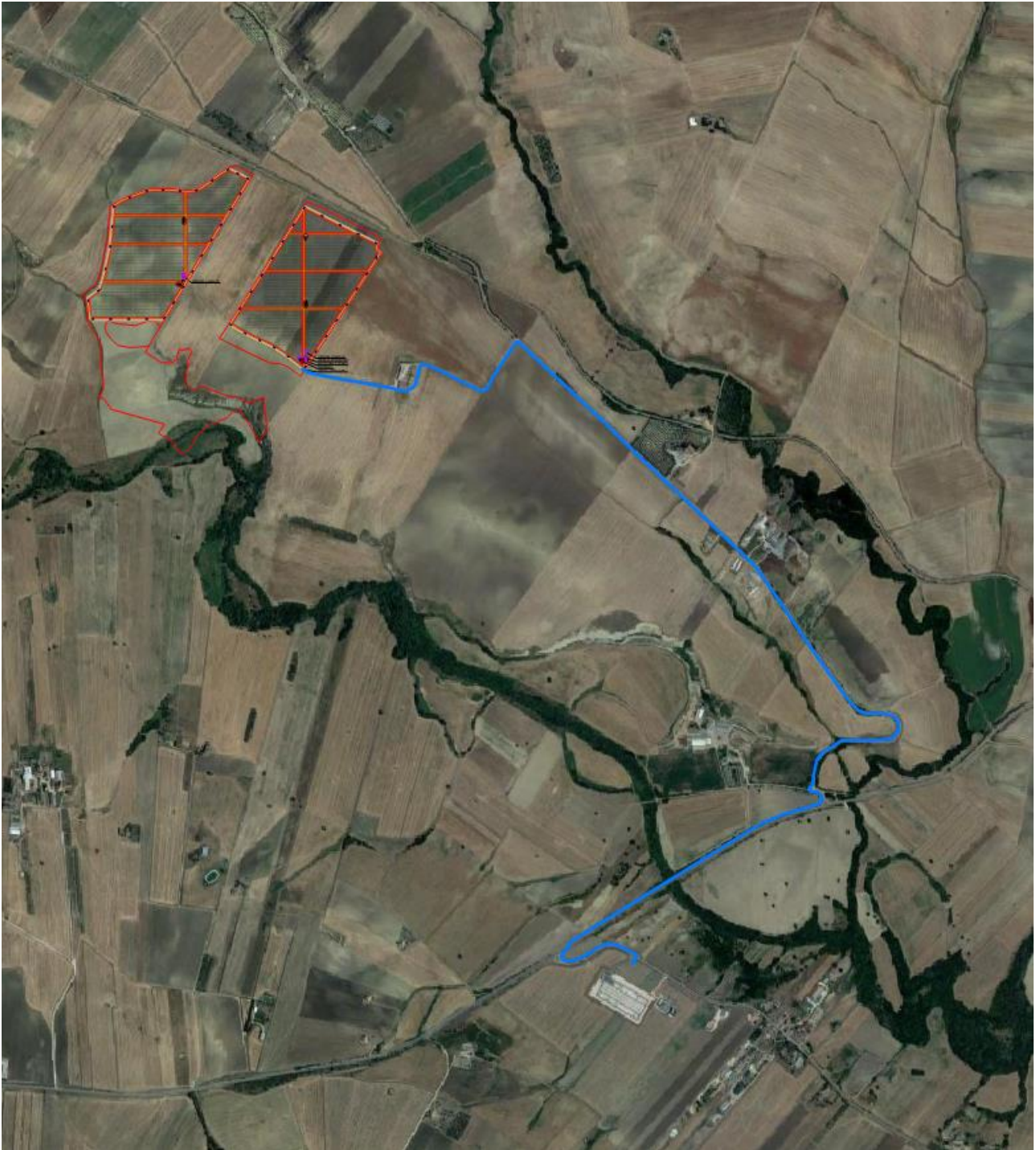
Figura 2 - Inquadramento dell'impianto FV e relative opere di connessione su ortofoto