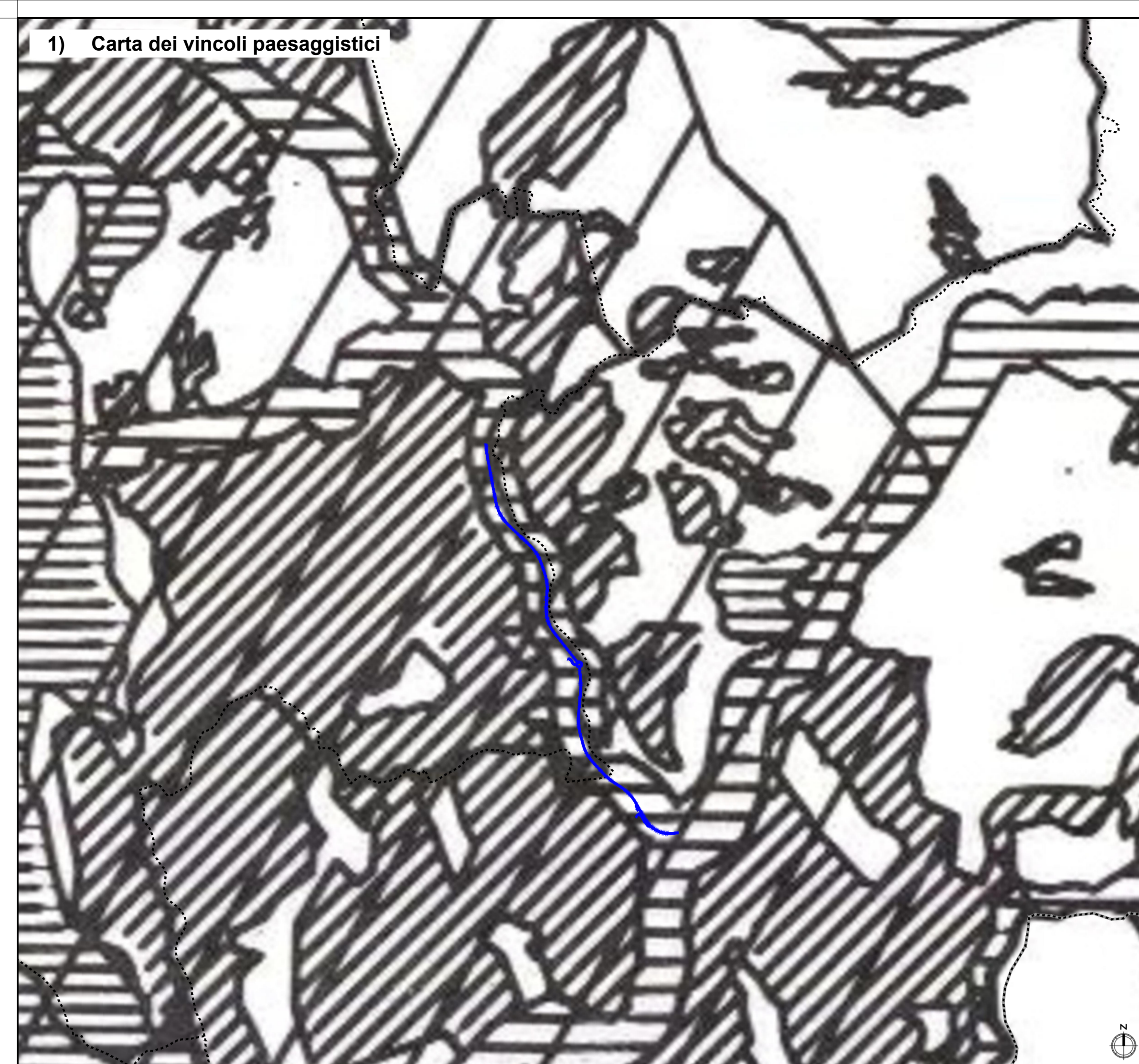
1) Carta dei vincoli paesaggistici