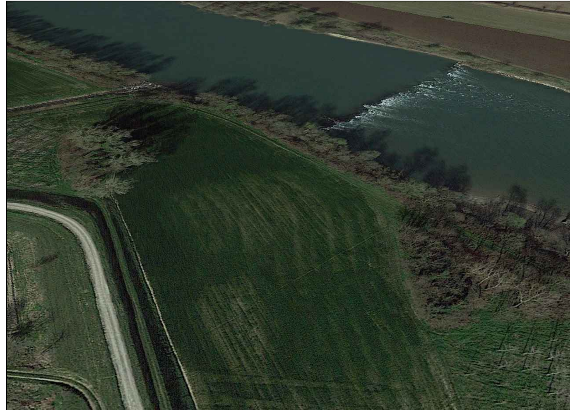
VISTA DALL'ARGINE DESTRO (F2) STATO DI FATTO