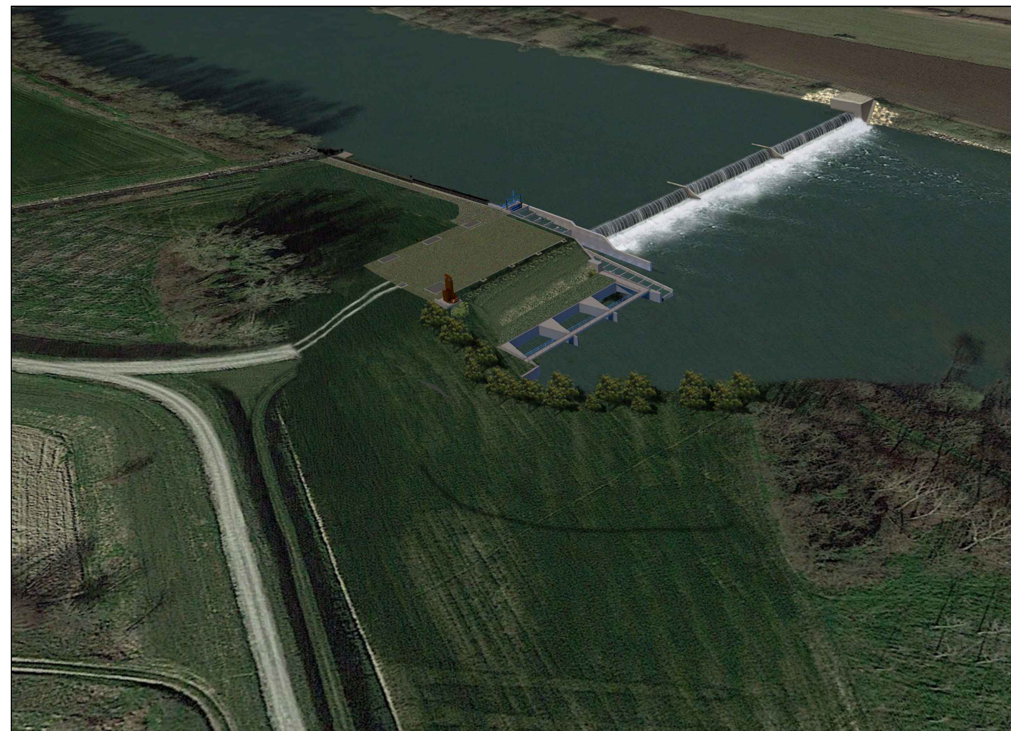
VISTA DALL'ARGINE DESTRO (F2) SIMULAZIONE FOTOGRAFICA