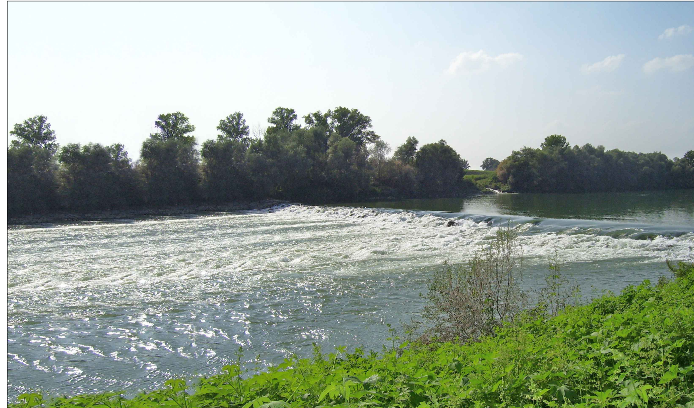
VISTA DALL'ARGINE SINISTRO (F3) STATO DI FATTO