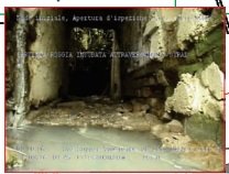
Ingresso della tombinatura sottostante la sede stradale da nord verso sud (immagine da videoispezione)