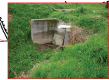
Uscita del tratto tombinato presso località Caselle