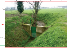
Manufatto di regolazione a monte della località Caselle