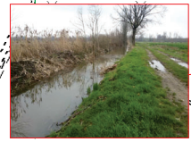
Cavo Tombone nel tratto iniziale (ristagno idrico e deflusso impedito da manufatti esistenti a valle)