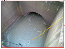
Pozzetto di ispezione della tombinatura presso località Caselle (tubazione in uscita)