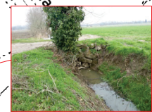
Manufatto di attraversamento con sezione ostruita