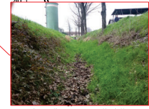
Tratto immediatamente a valle della tombinatura in località Caselle