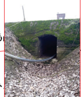
Manufatto di attraversamento dell'argine maestro, lato nord