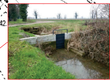
Manufatto di sbarramento (la sua chiusura provoca l'invaso d'acqua e ne impedisce lo smaltimento)