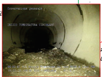
Inizio tombinatura circolare vista da nord verso sud (immagine da videoispezione)