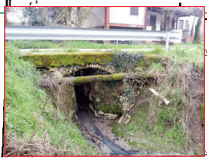
Ingresso della tombinatura presso Località Caselle (tratto in evidente contropendenza)