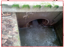
Pozzetto di ispezione della tombinatura presso località Caselle (tubazione in ingresso)