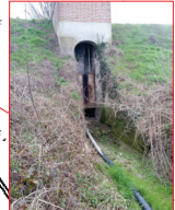
Manufatto di attraversamento dell'argine maestro, lato sud