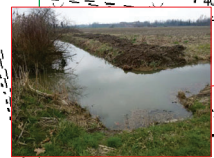
Tratto iniziale del Cavo Tombone (deflusso impedito dai manufatti a valle)