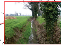
Cavo Tombone a monte della località Caselle