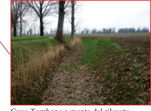
Cavo Tombone a monte del rilevato arginale