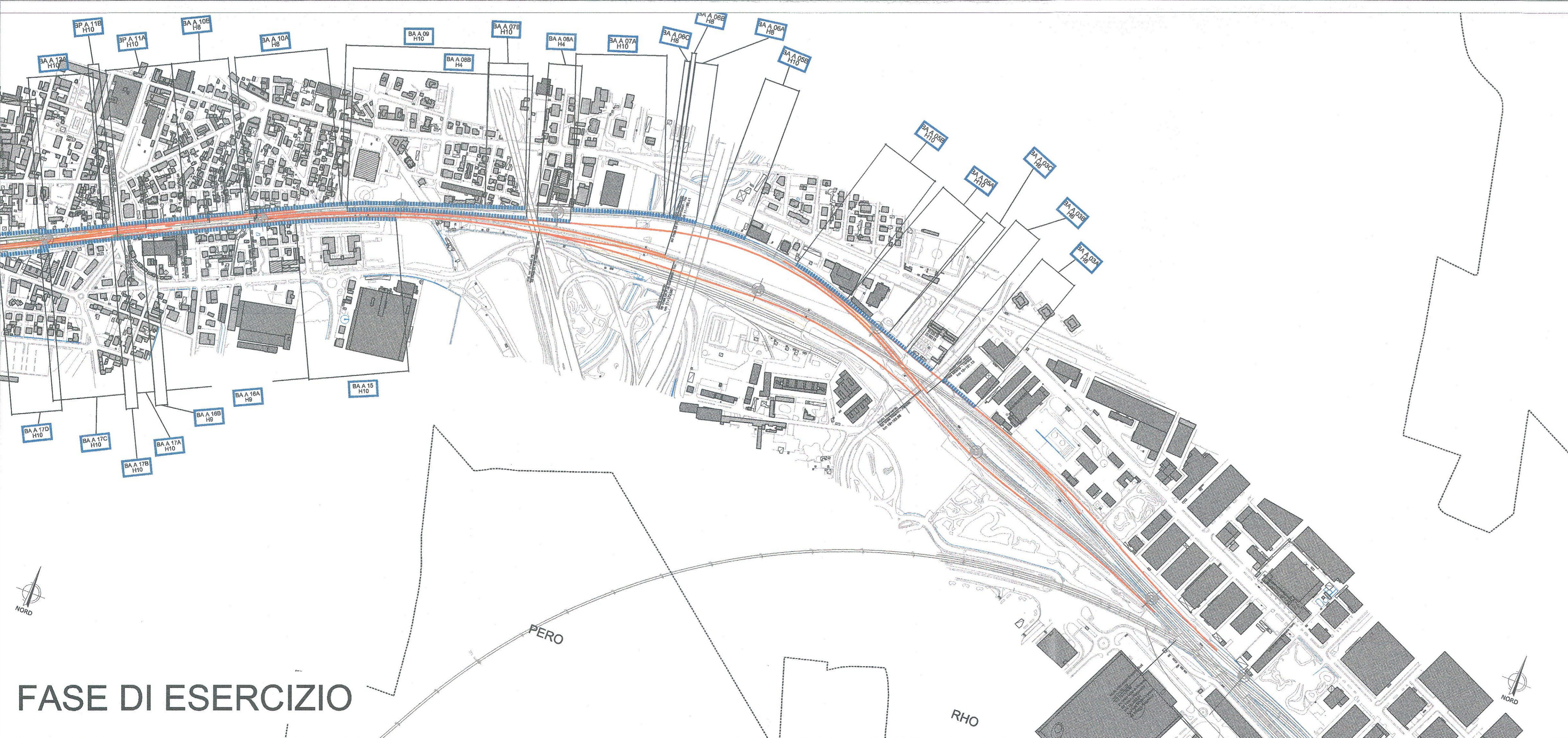
FASE DI ESERCIZIO