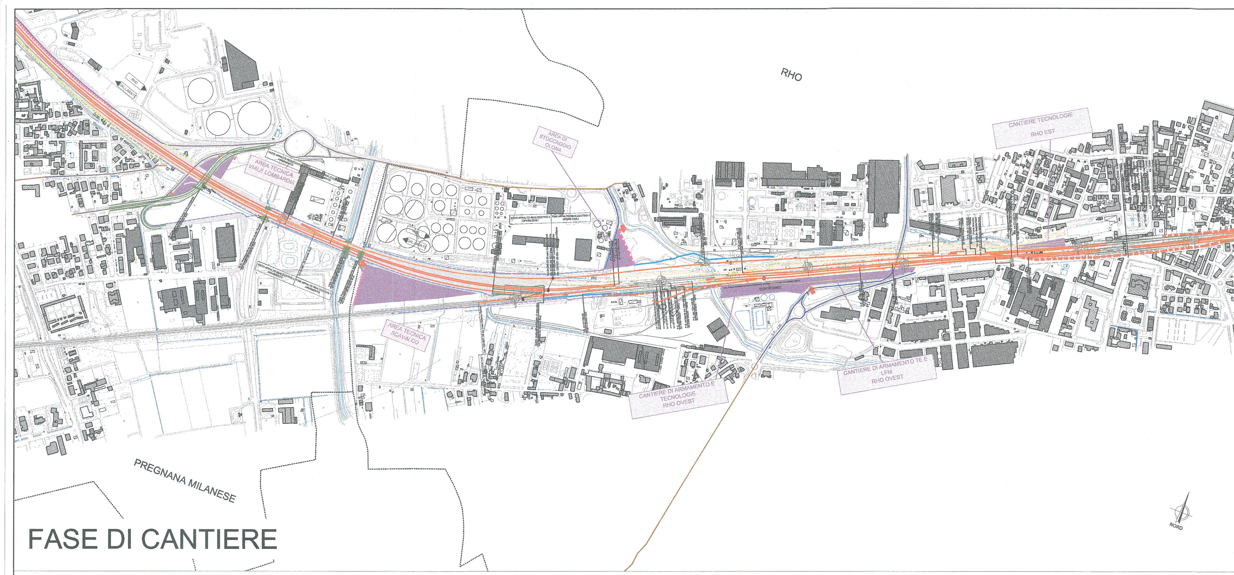
FASE DI CANTIERE