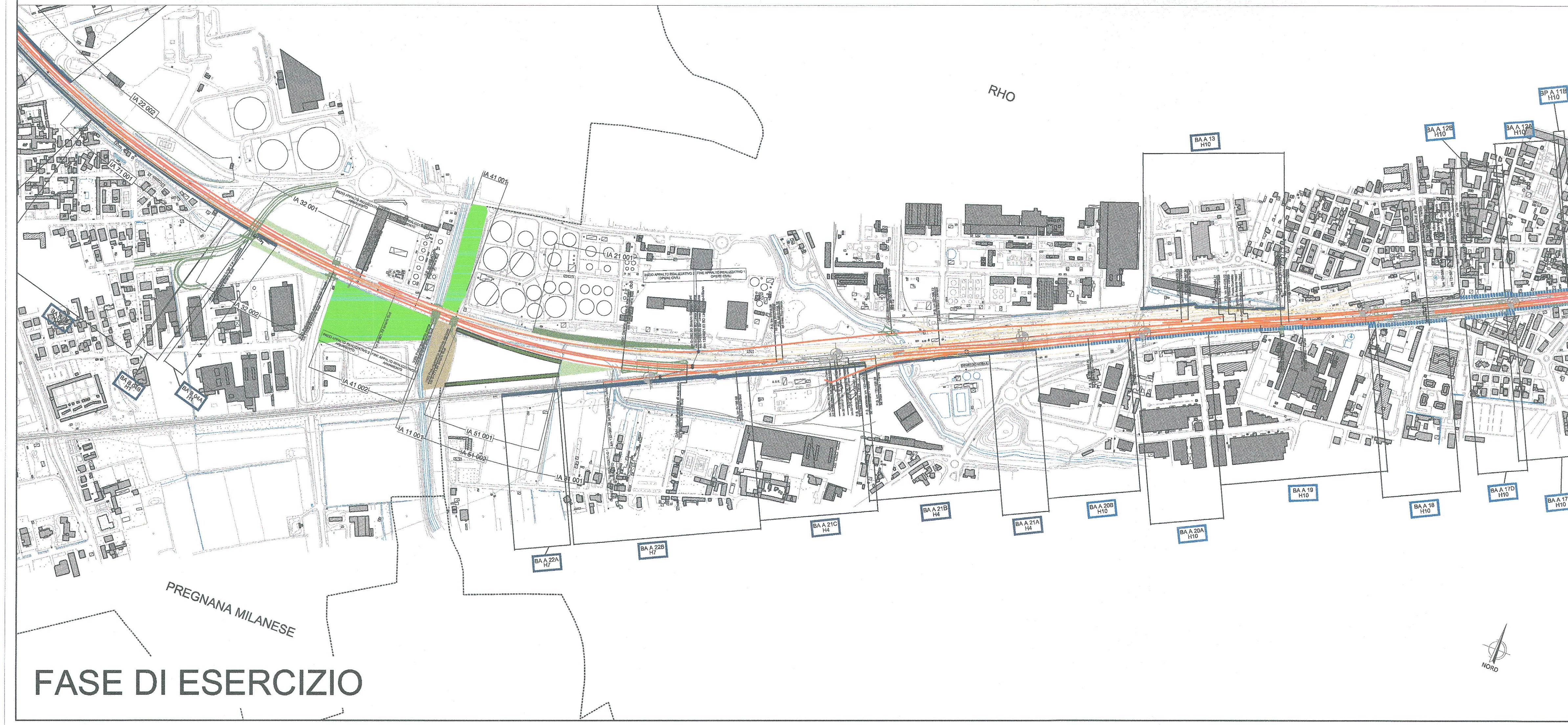
FASE DI ESERCIZIO