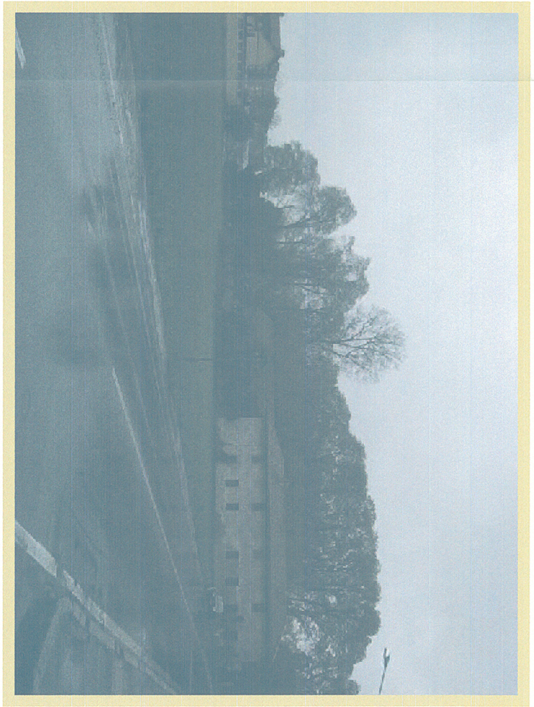
Cascinale nel comune di Vanzago