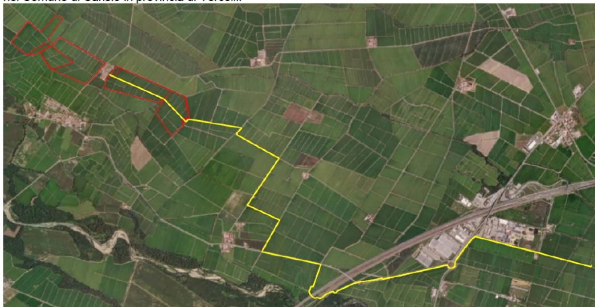
Figura 14 - Inquadramento su Ortofoto dell'area di impianto (in rosso) e del cavidotto in AT (in giallo)

L'energia prodotta dal campo fotovoltaico verrà veicolata mediante un cavidotto interrato in alta tensione a 36 kV lungo circa 9,46 km fino alla sottostazione Terna in prossimità dell'area industriale "La Baraggia" sita nel Comune di Carisio in provincia di Vercelli.