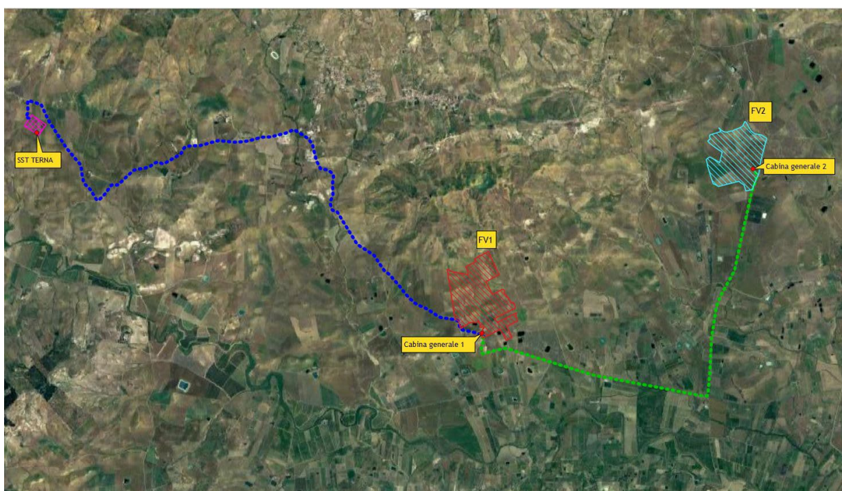
1. Vista satellitare generale ubicazione impianto