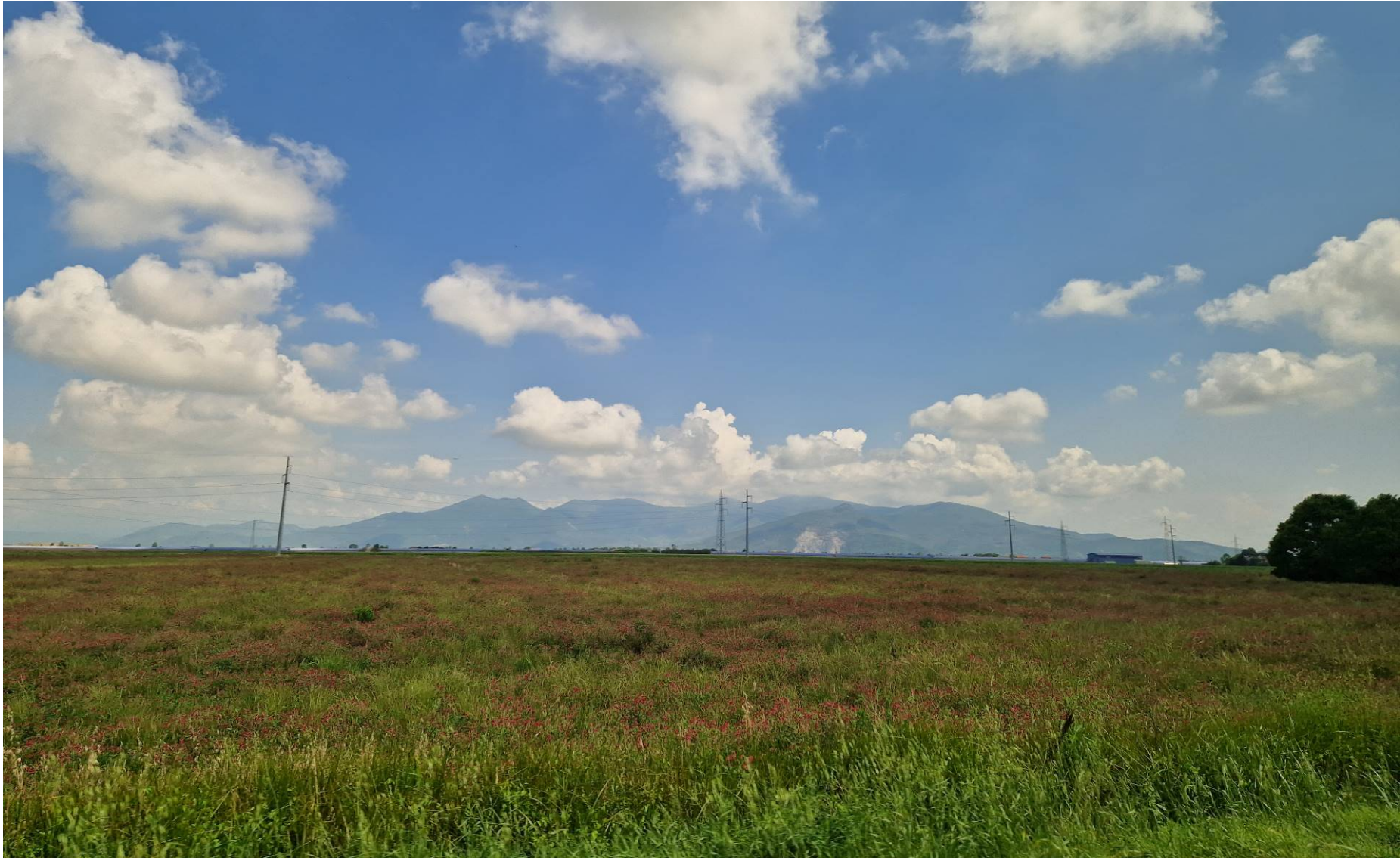
Fotografia 5 vista verso nord da Via dello Zannone