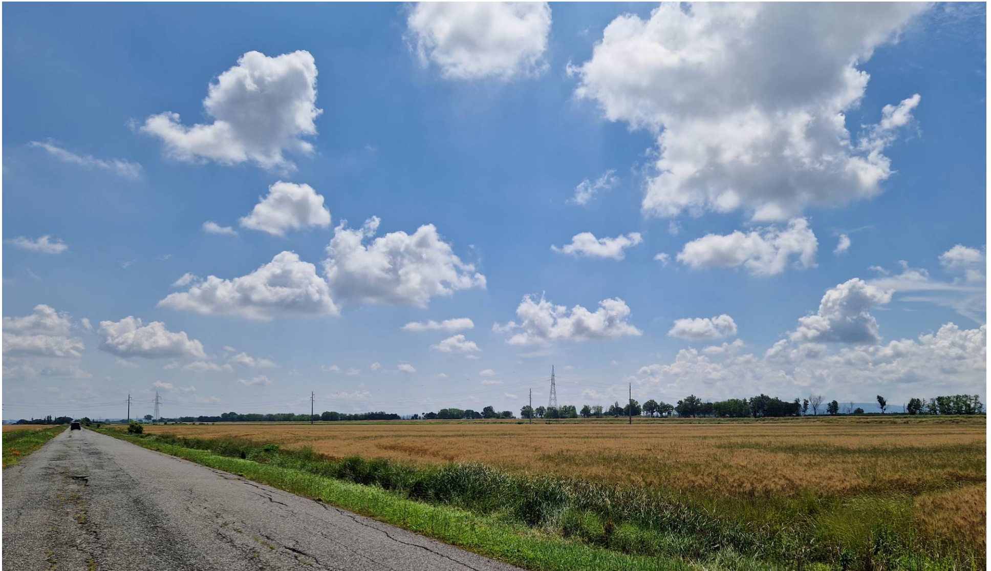
Fotografia 15 vista verso est da via dello Zannone