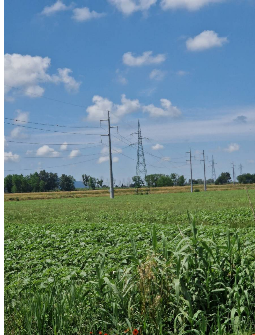
Fotografia 13 vista dei tralicci Terna presenti nel lotto a nord e sud di Via dello Zannone