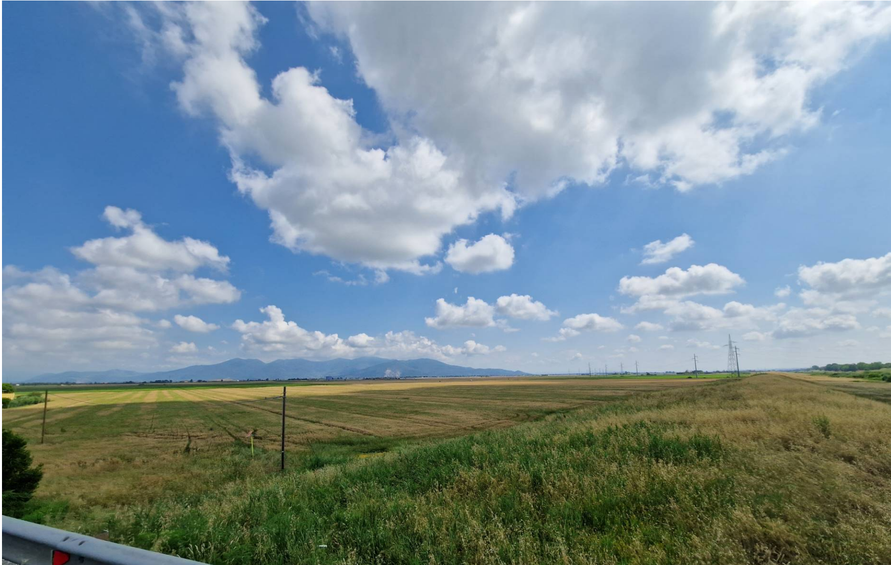
Fotografia 2 vista verso nord-est dall'Argine destro dello Scolmatore dell'Arno presso la SR 206