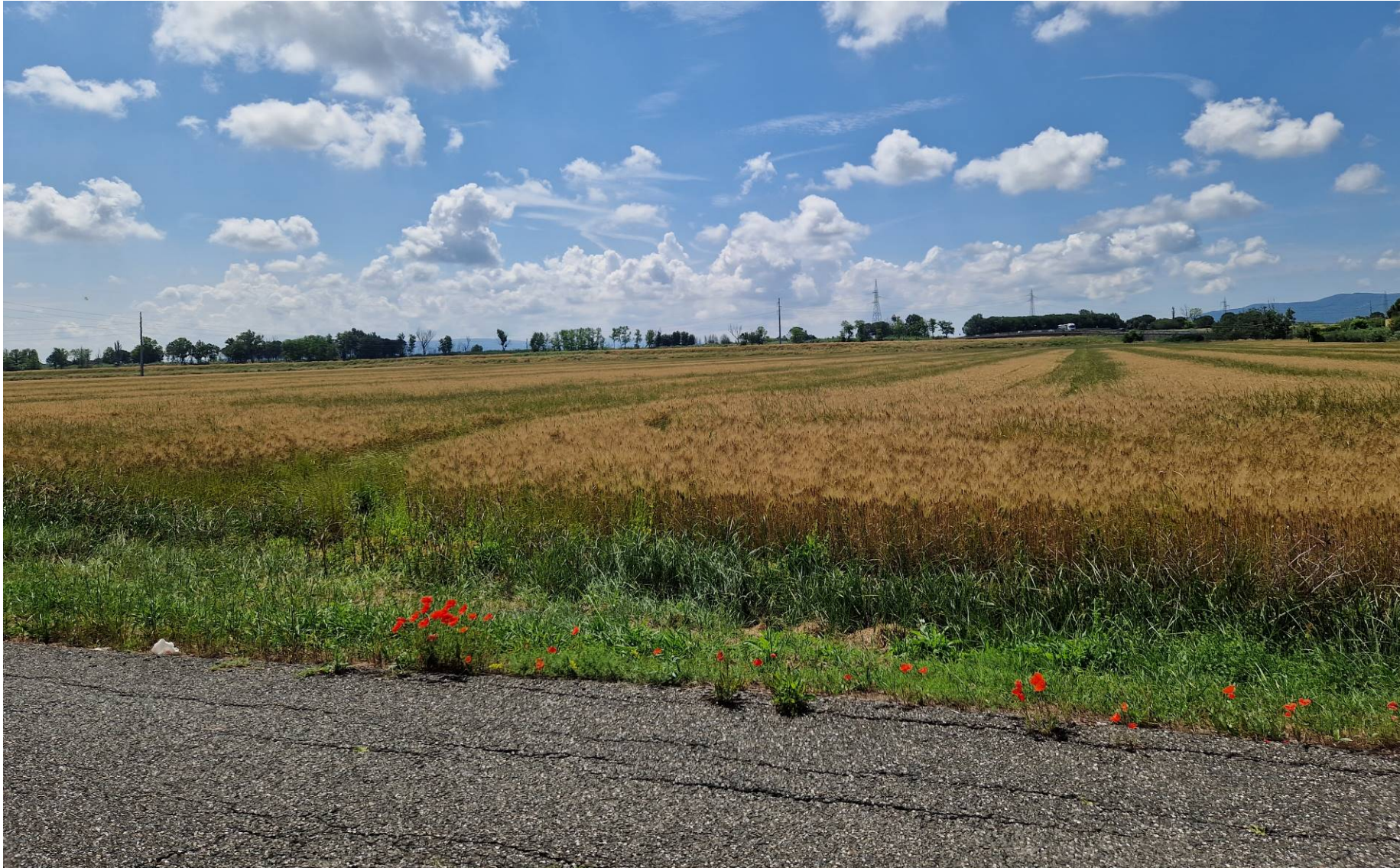
Fotografia 16 vista verso sud da via dello Zannone