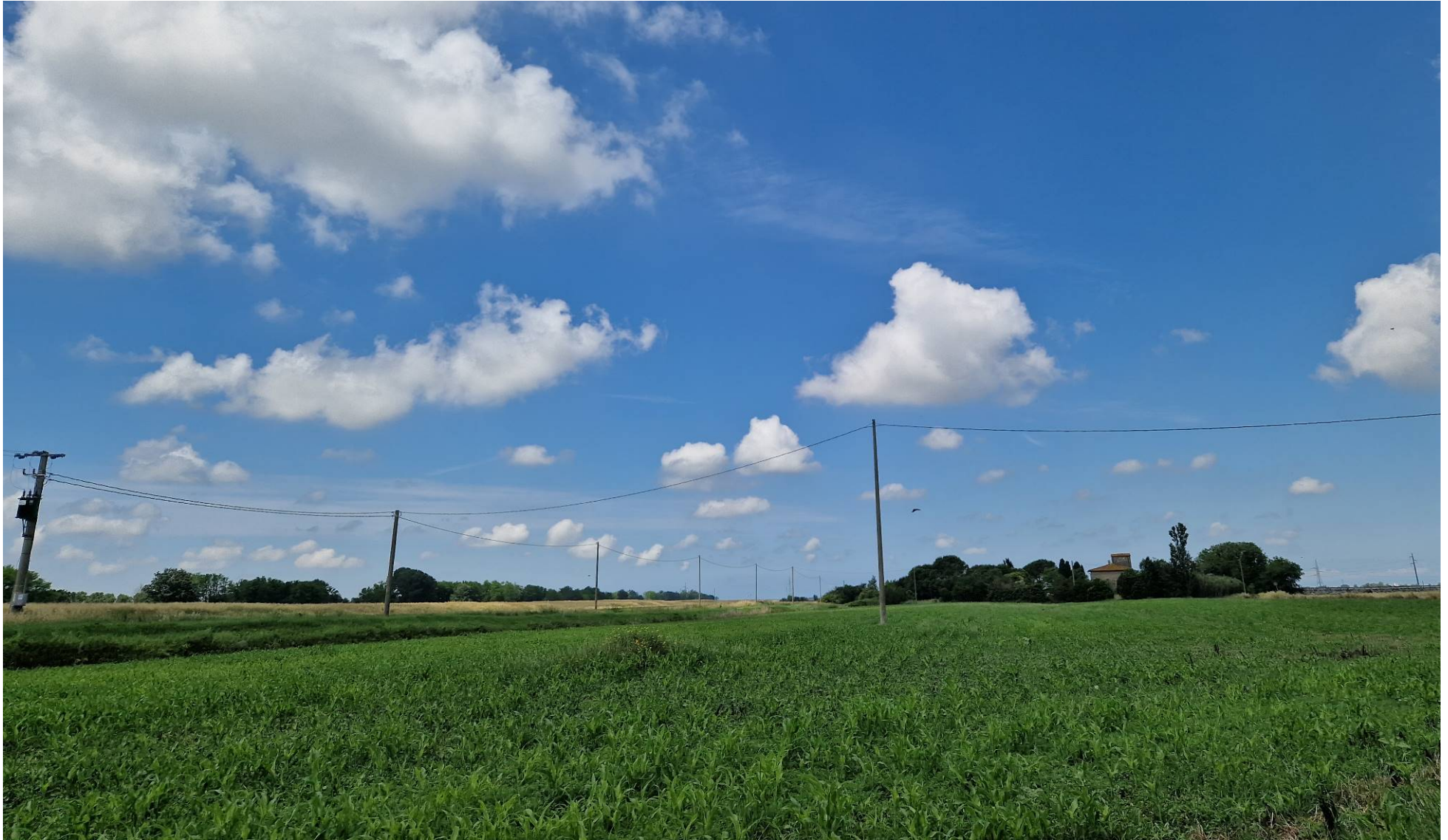
Fotografia 11 vista verso ovest all'incrocio tra via dello Zannone e Via Santa Maria