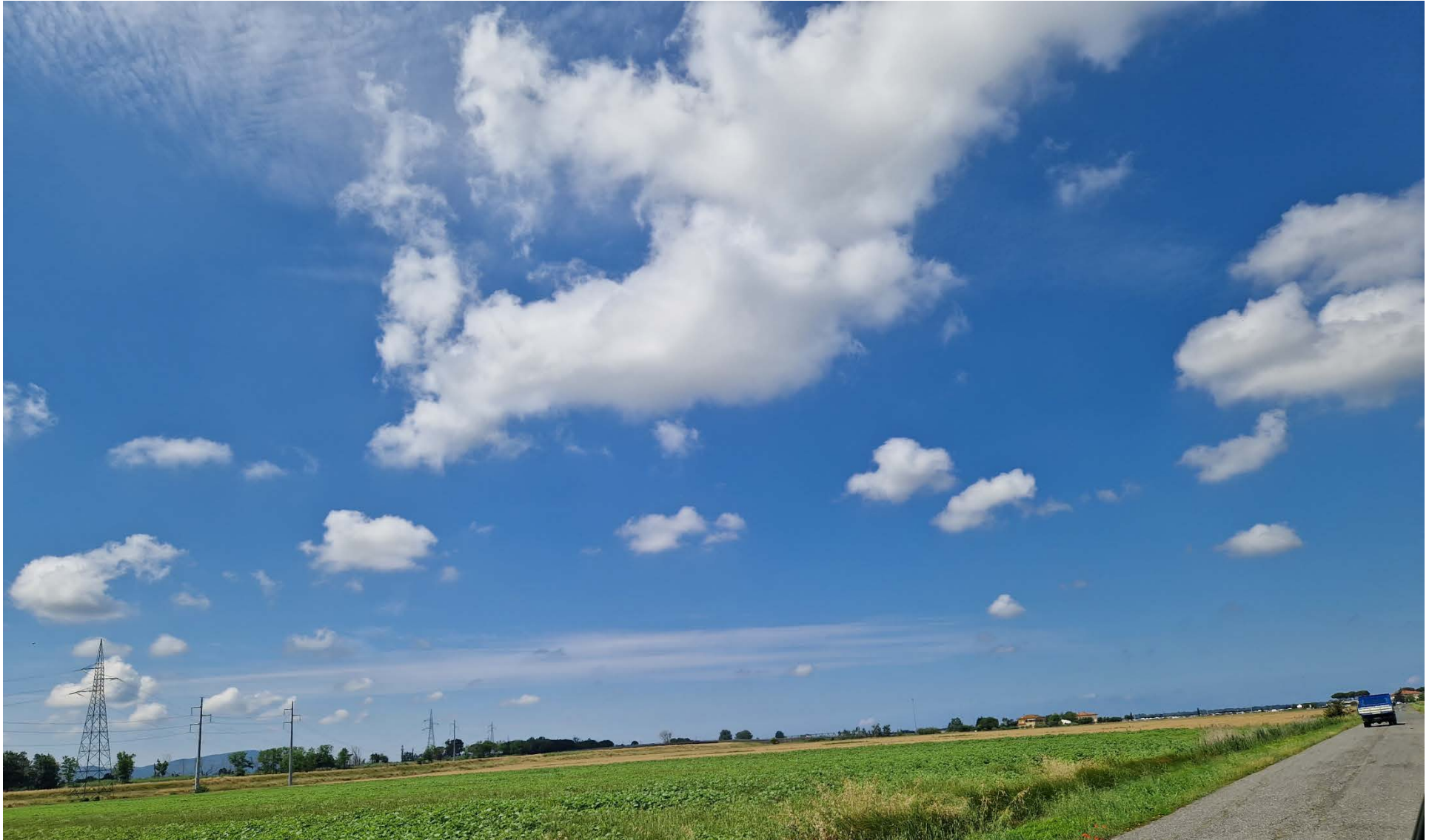
Fotografia 14 vista verso ovest da via dello Zannone