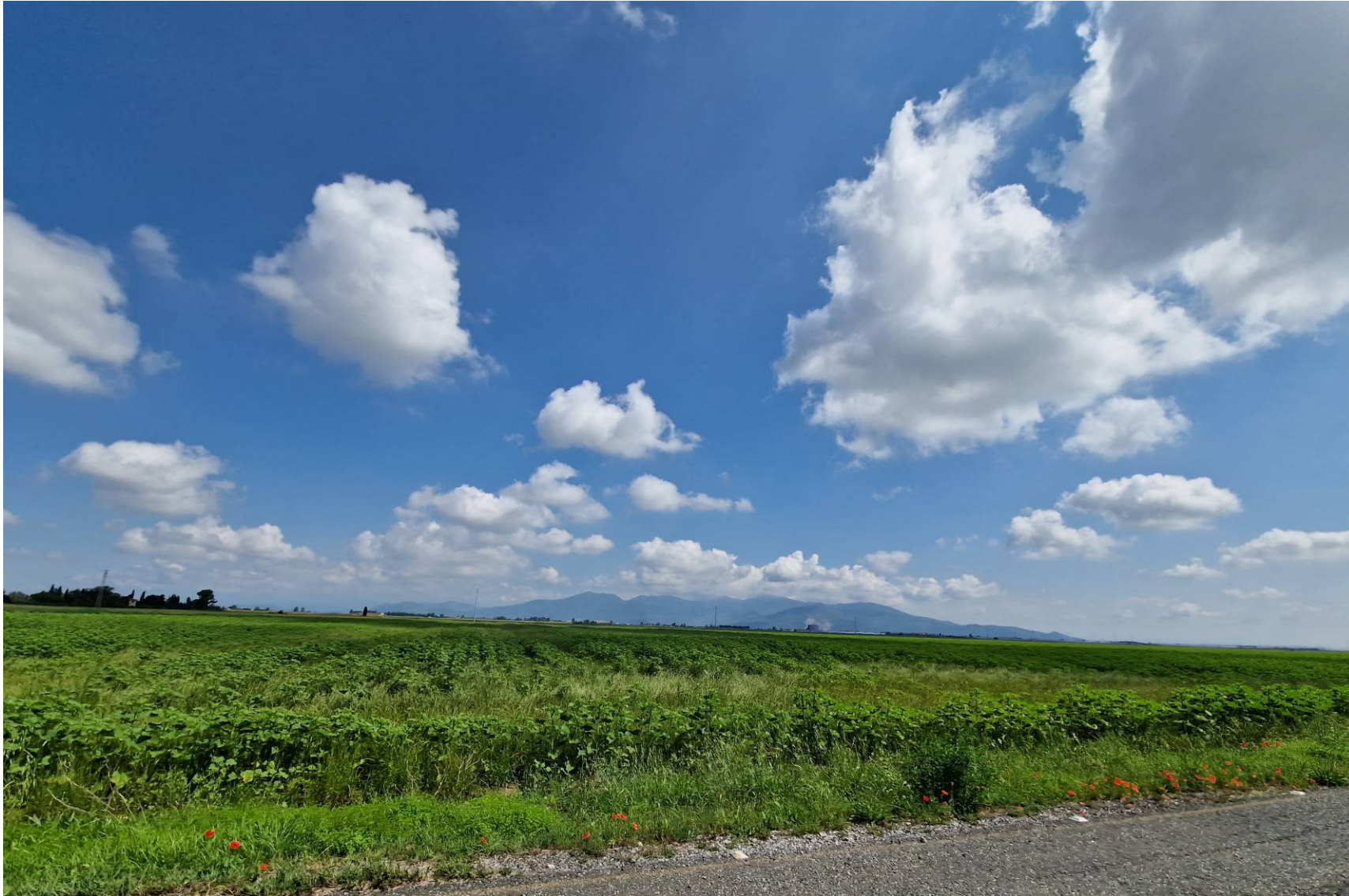
Fotografia 4 vista verso nord da Via dello Zannone