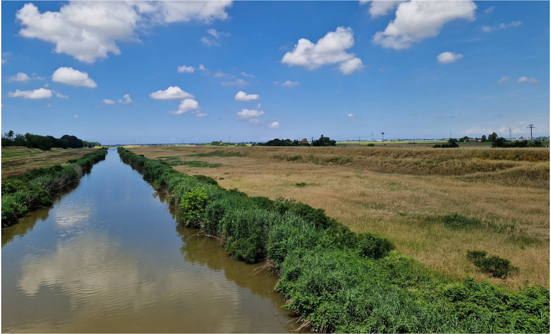
Fotografia 18 vista verso nord ovest dello Scolmatore dell'Arno presso il ponte di Via della Marginata