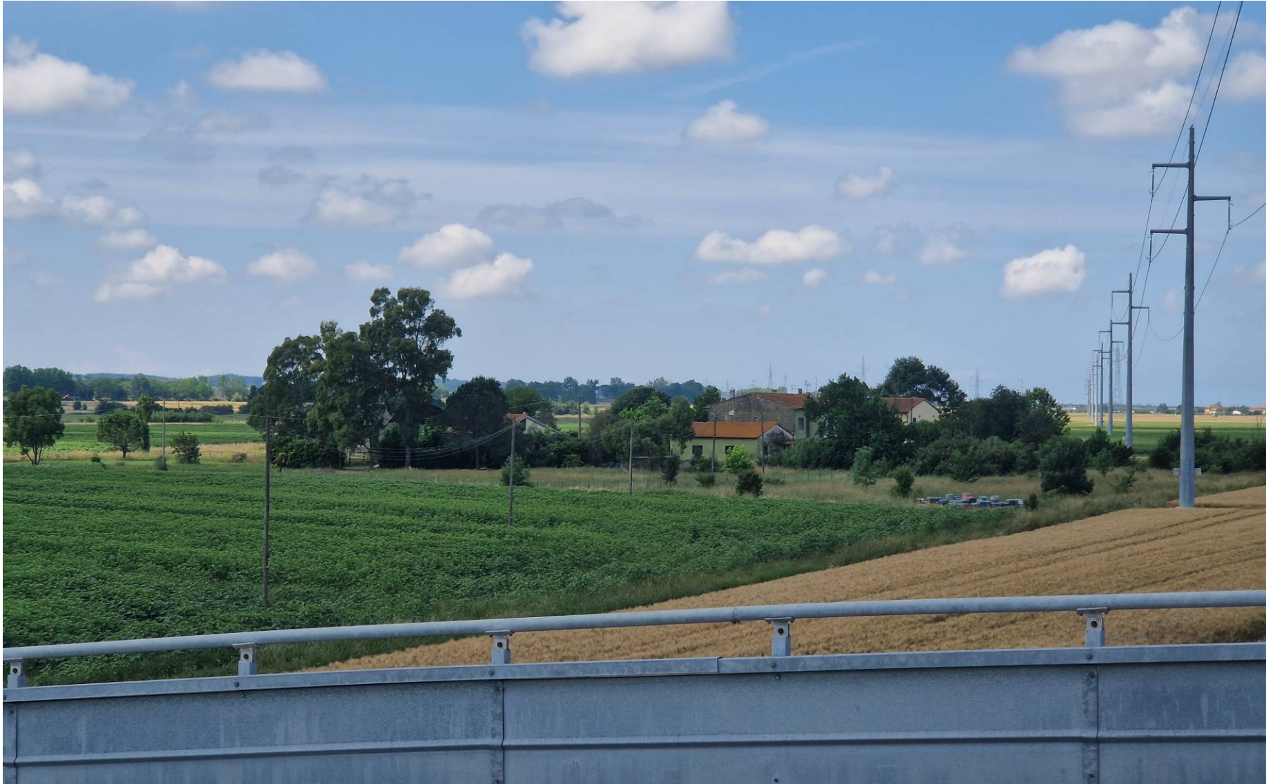
Fotografia 12 vista verso ovest dal cavalcavia di Via Santa Maria