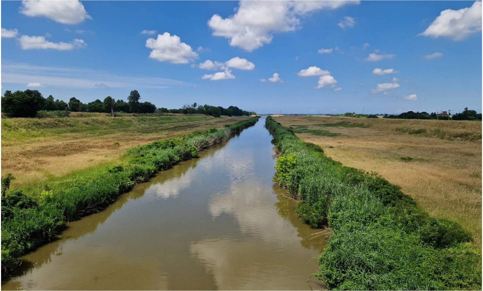
Fotografia 17 vista verso ovest dello Scolmatore dell'Arno presso il ponte di Via della Marginata