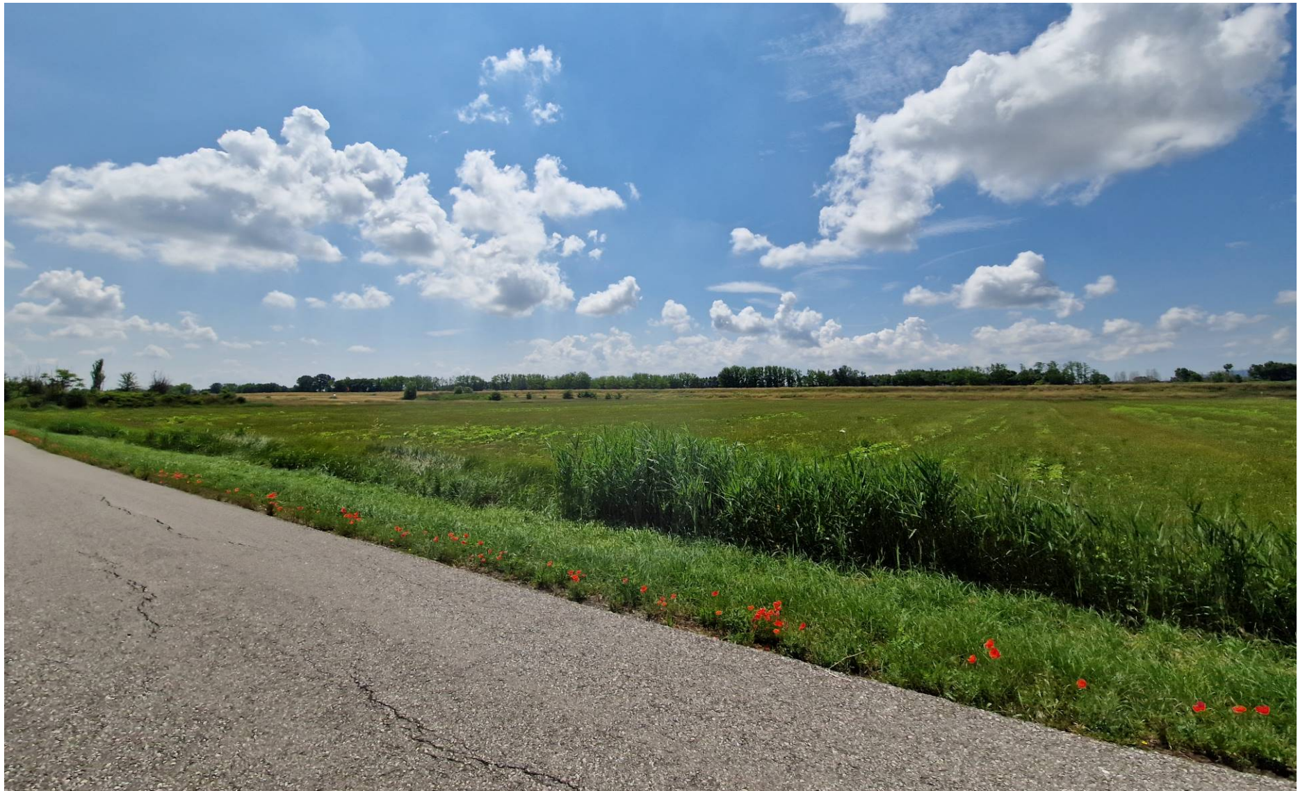
Fotografia 8 vista verso sud da Via dello Zannone