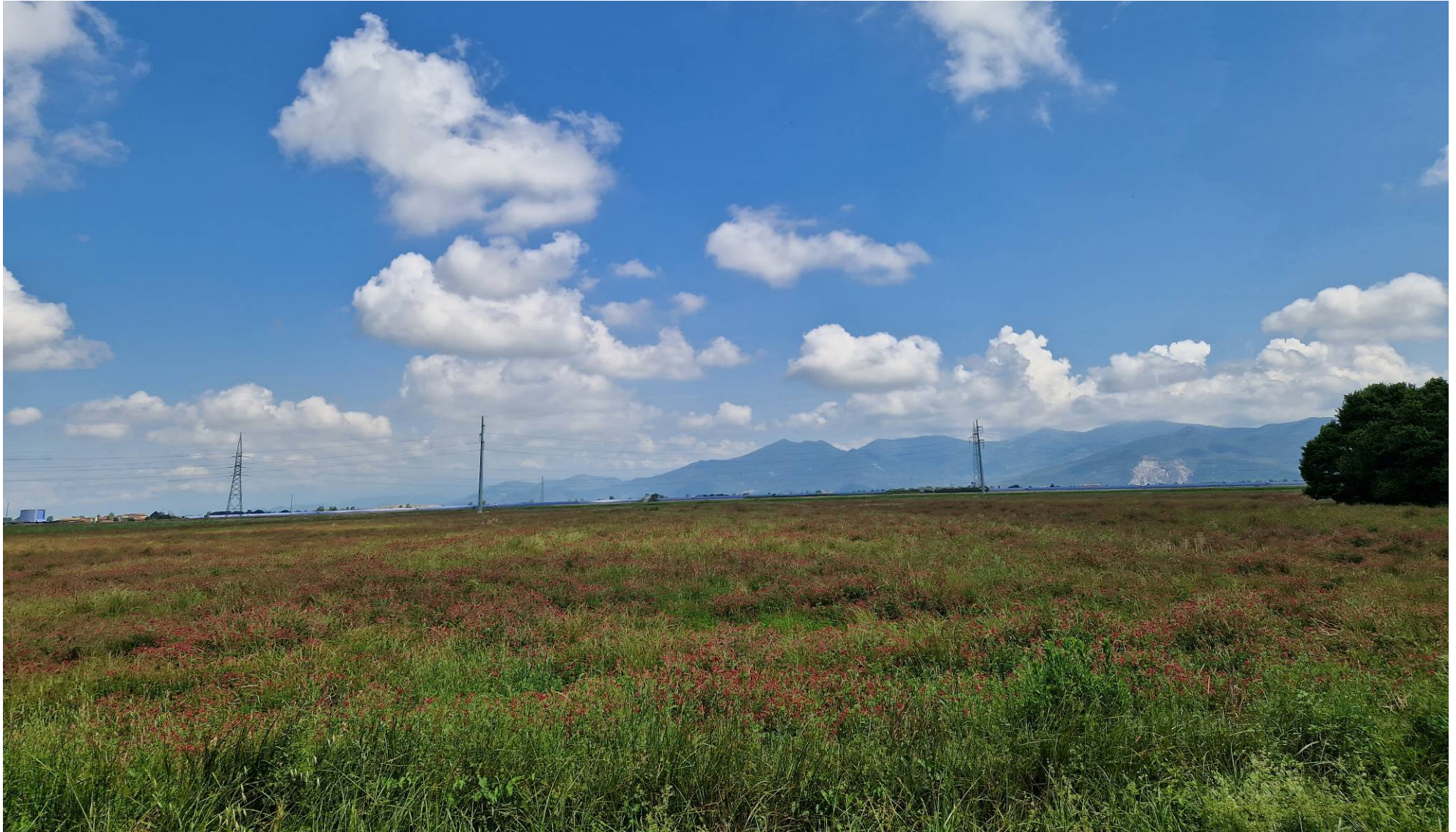
Fotografia 6 vista verso nord da Via dello Zannone