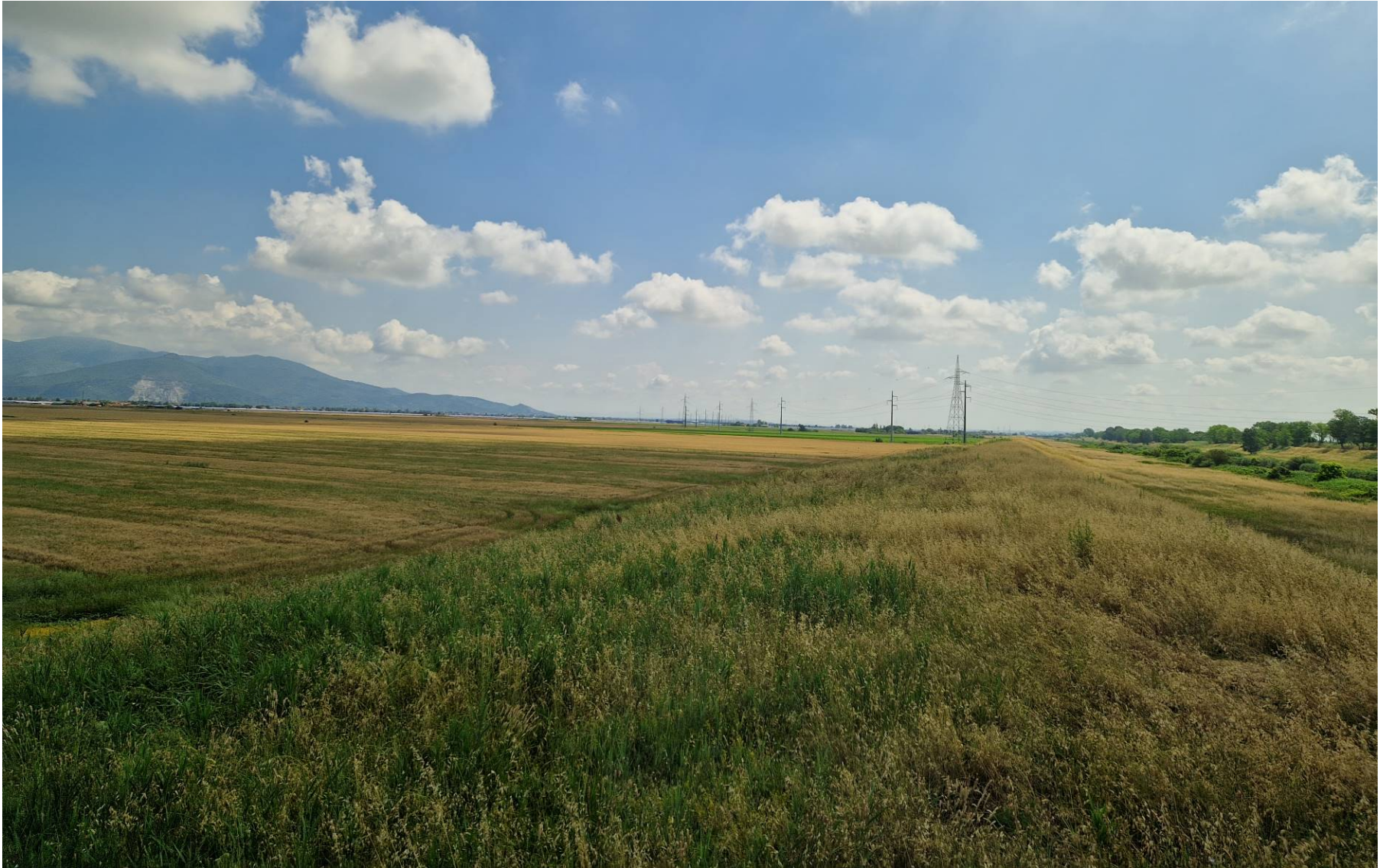
Fotografia 1 vista verso est dall'Argine destro dello Scolmatore dell'Arno presso la SR 206