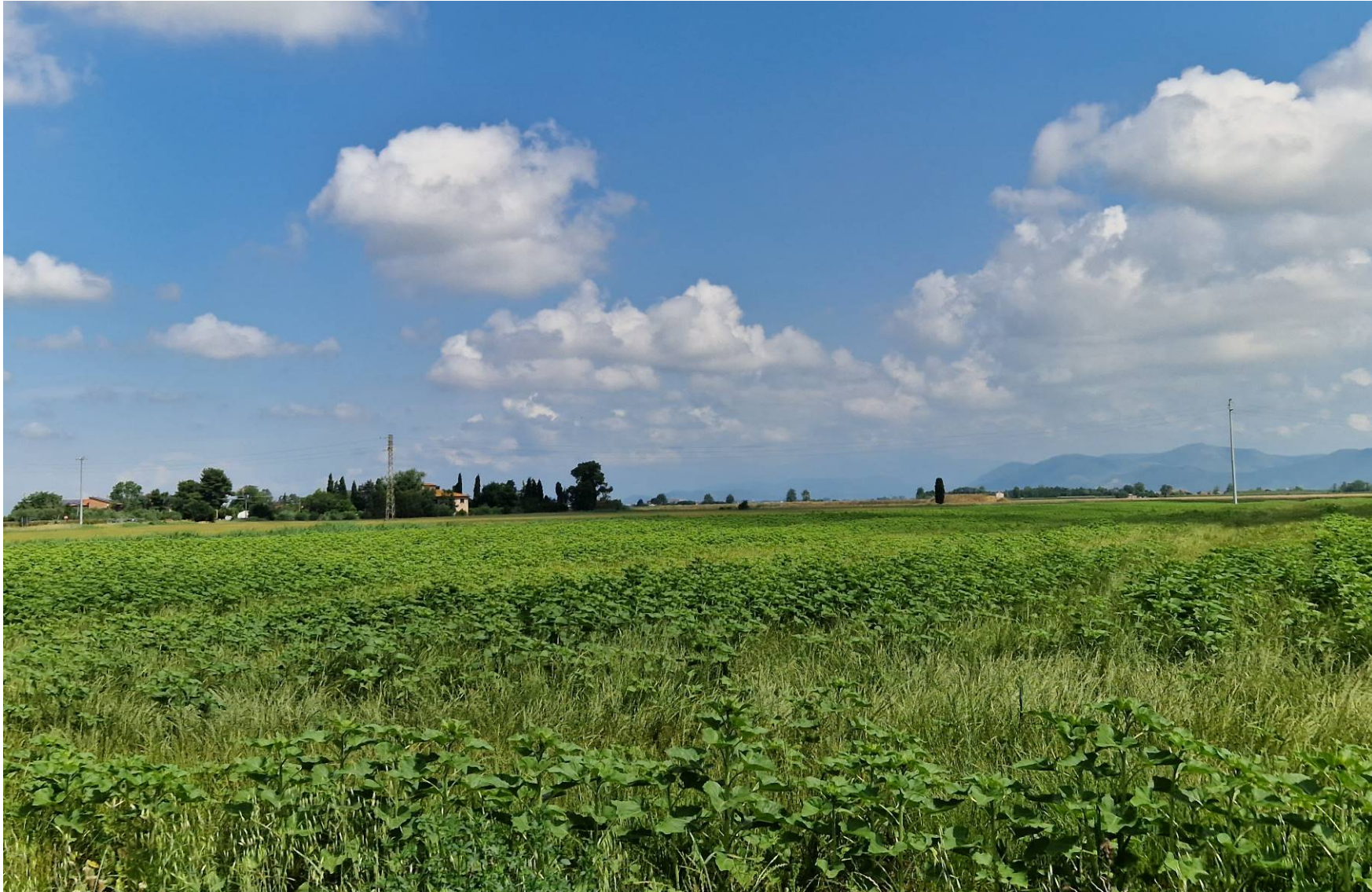
Fotografia 3 vista verso nord da Via dello Zannone