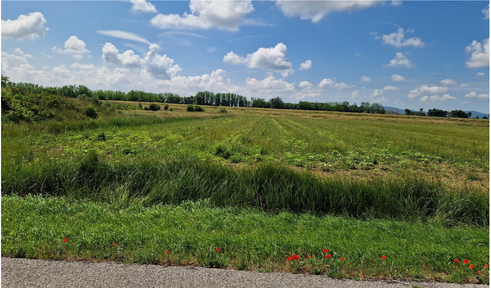
Fotografia 7 vista verso sud da Via dello Zannone