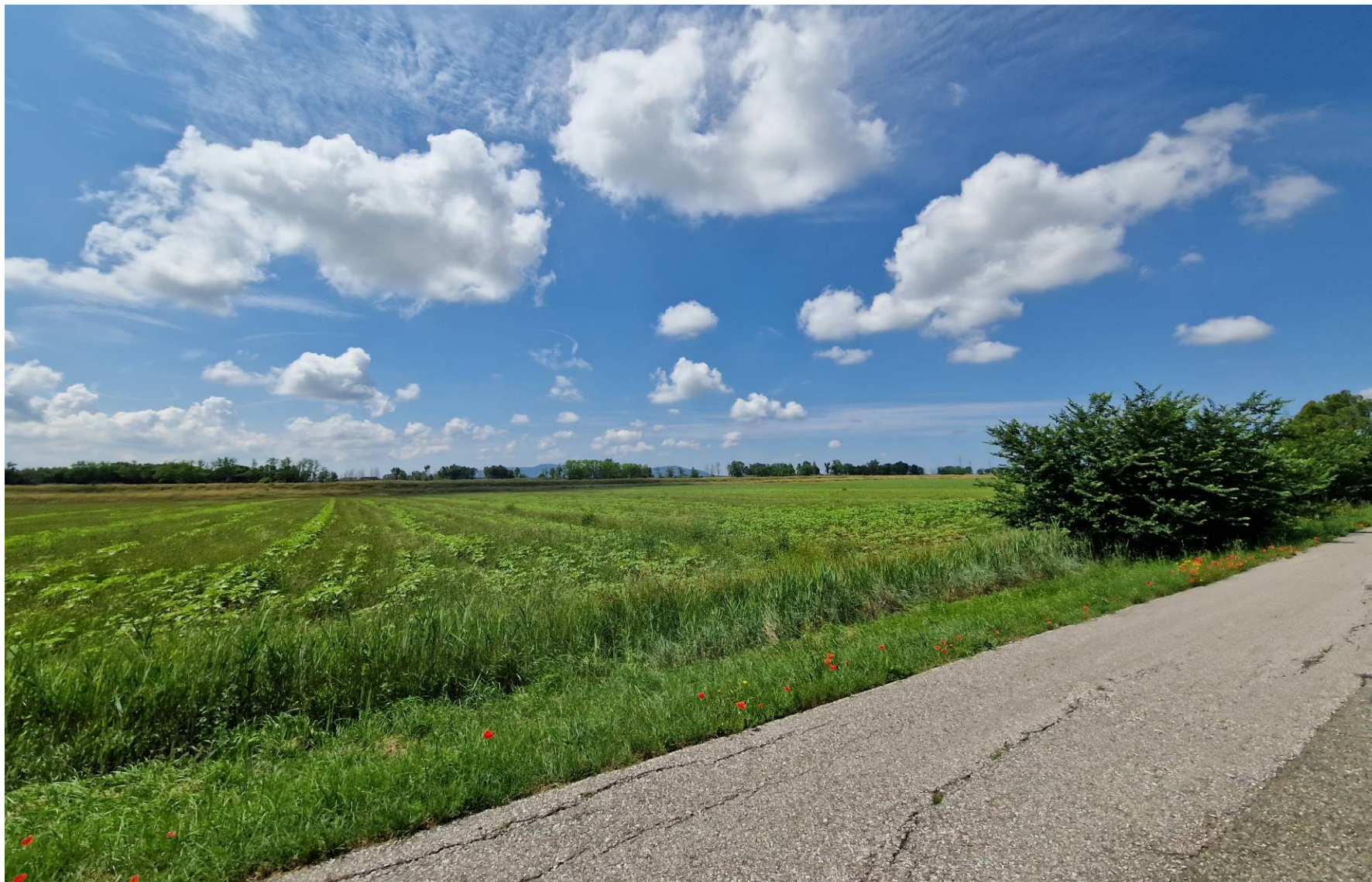
Fotografia 10 vista verso sud-ovest da Via dello Zannone