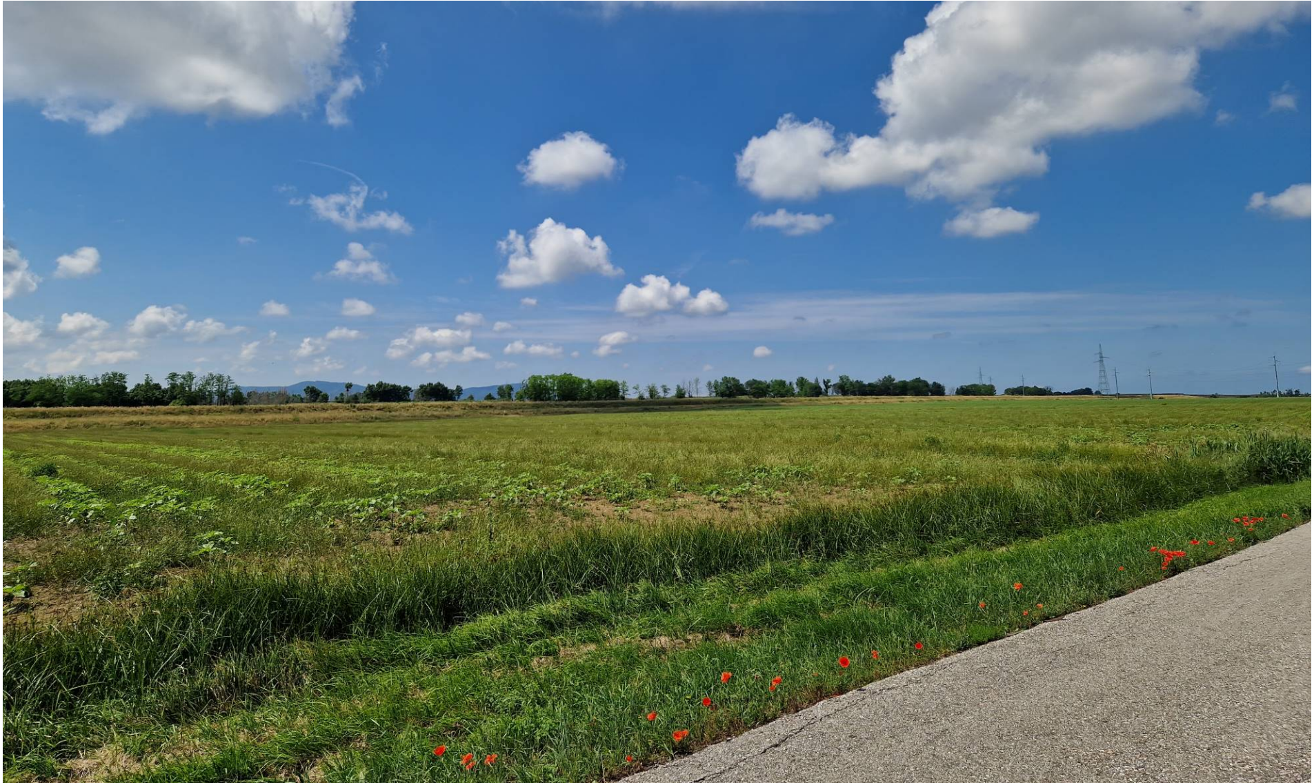
Fotografia 9 vista verso sud-ovest da Via dello Zannone