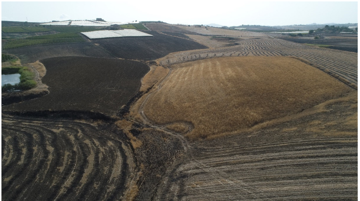
SCATTO FOTOGRAFICO N°8