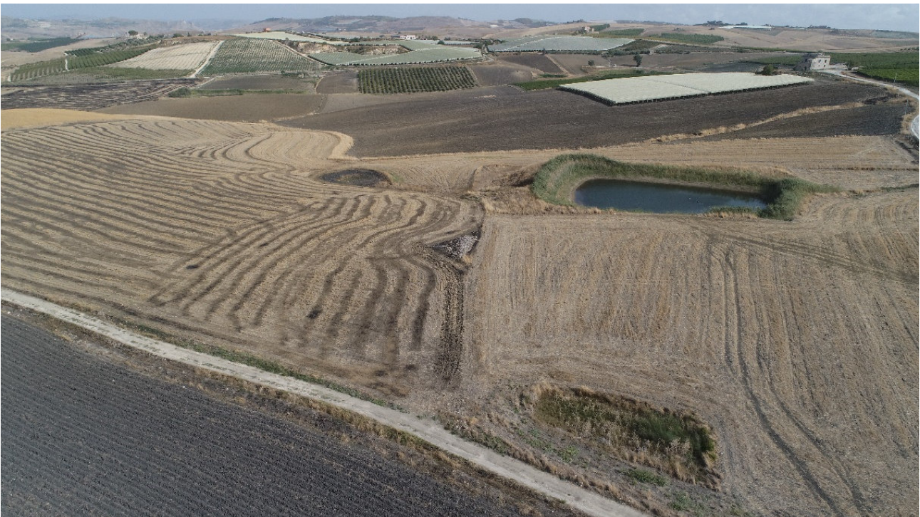
SCATTO FOTOGRAFICO N°2