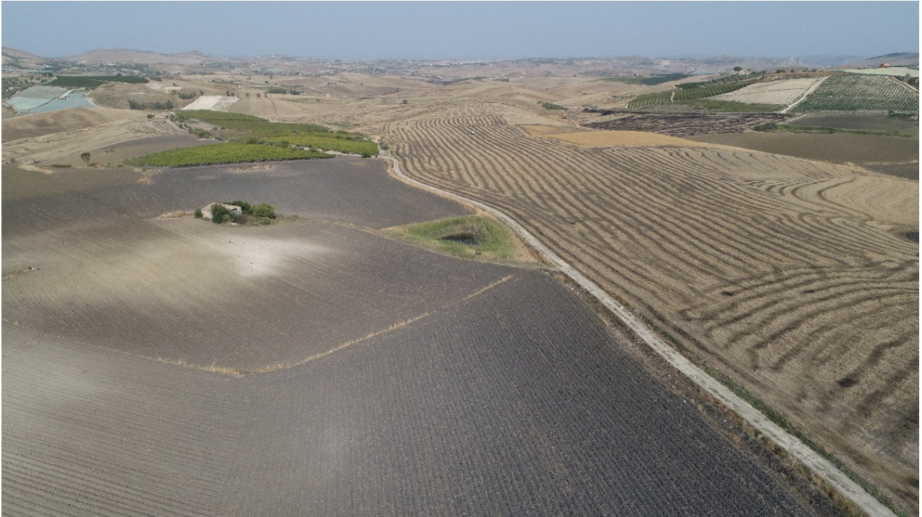
SCATTO FOTOGRAFICO N°1