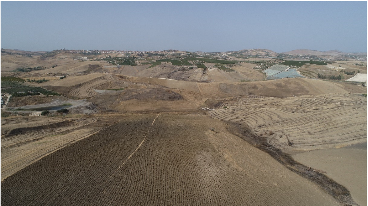
SCATTO FOTOGRAFICO N°4