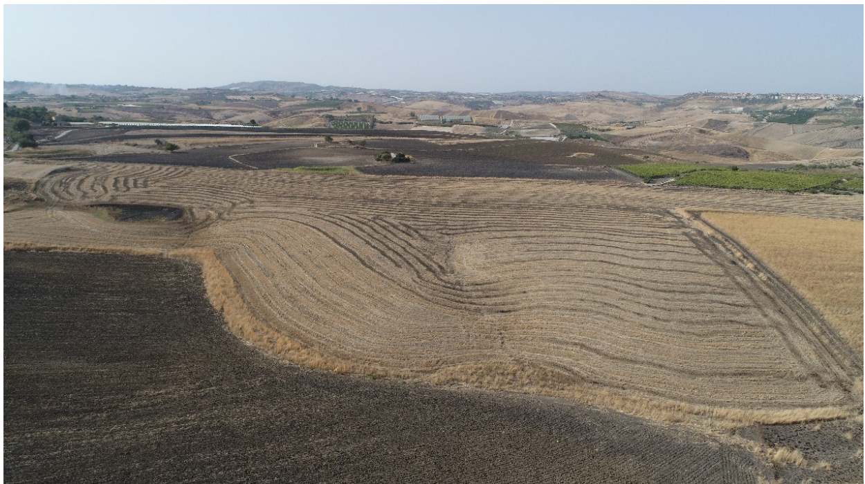
SCATTO FOTOGRAFICO N°6