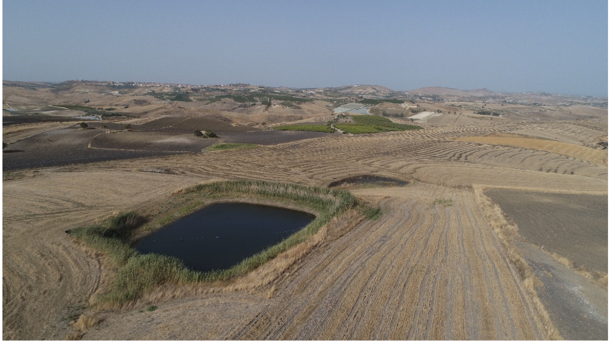
SCATTO FOTOGRAFICO N°9