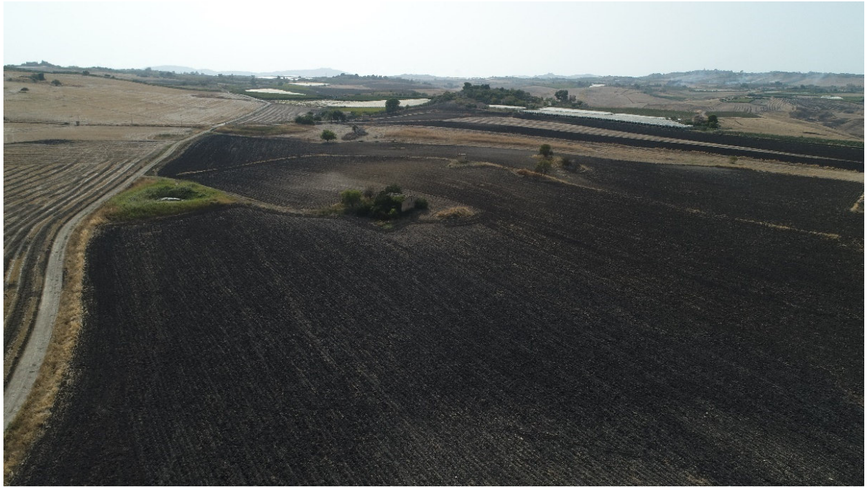
SCATTO FOTOGRAFICO N°7