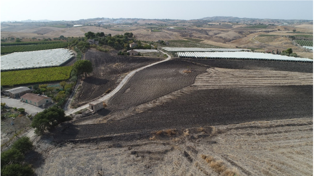
SCATTO FOTOGRAFICO N°3