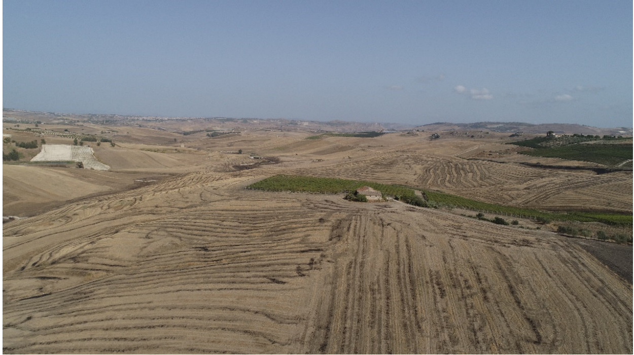
SCATTO FOTOGRAFICO N°5