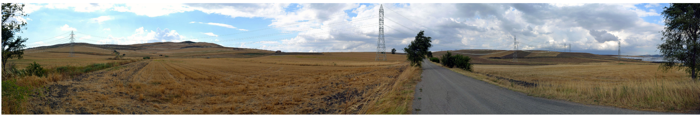
Foto 1 - Fotosimulazione dell'opera in progetto