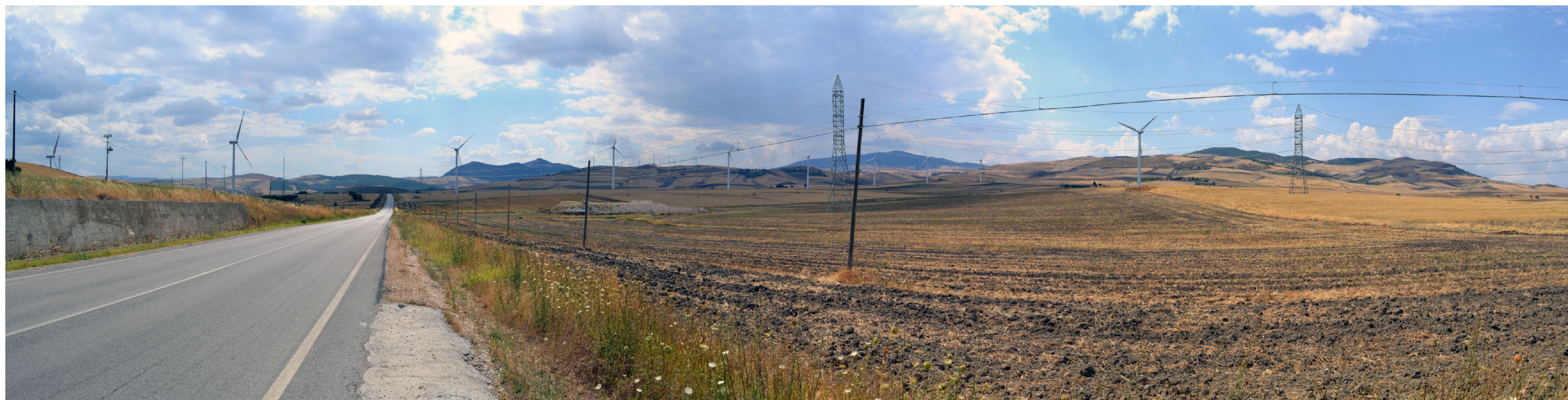
Foto 03 - Fotosimulazione dell'opera in progetto