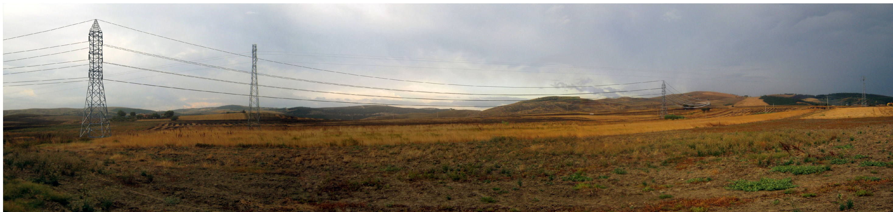
Foto 04 - Fotosimulazione dell'opera in progetto