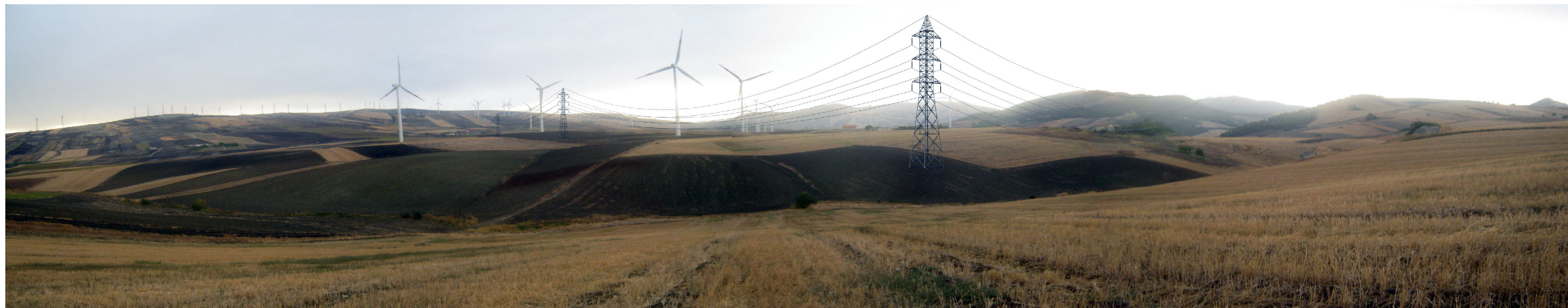
Foto 06 - Fotosimulazione dell'opera in progetto