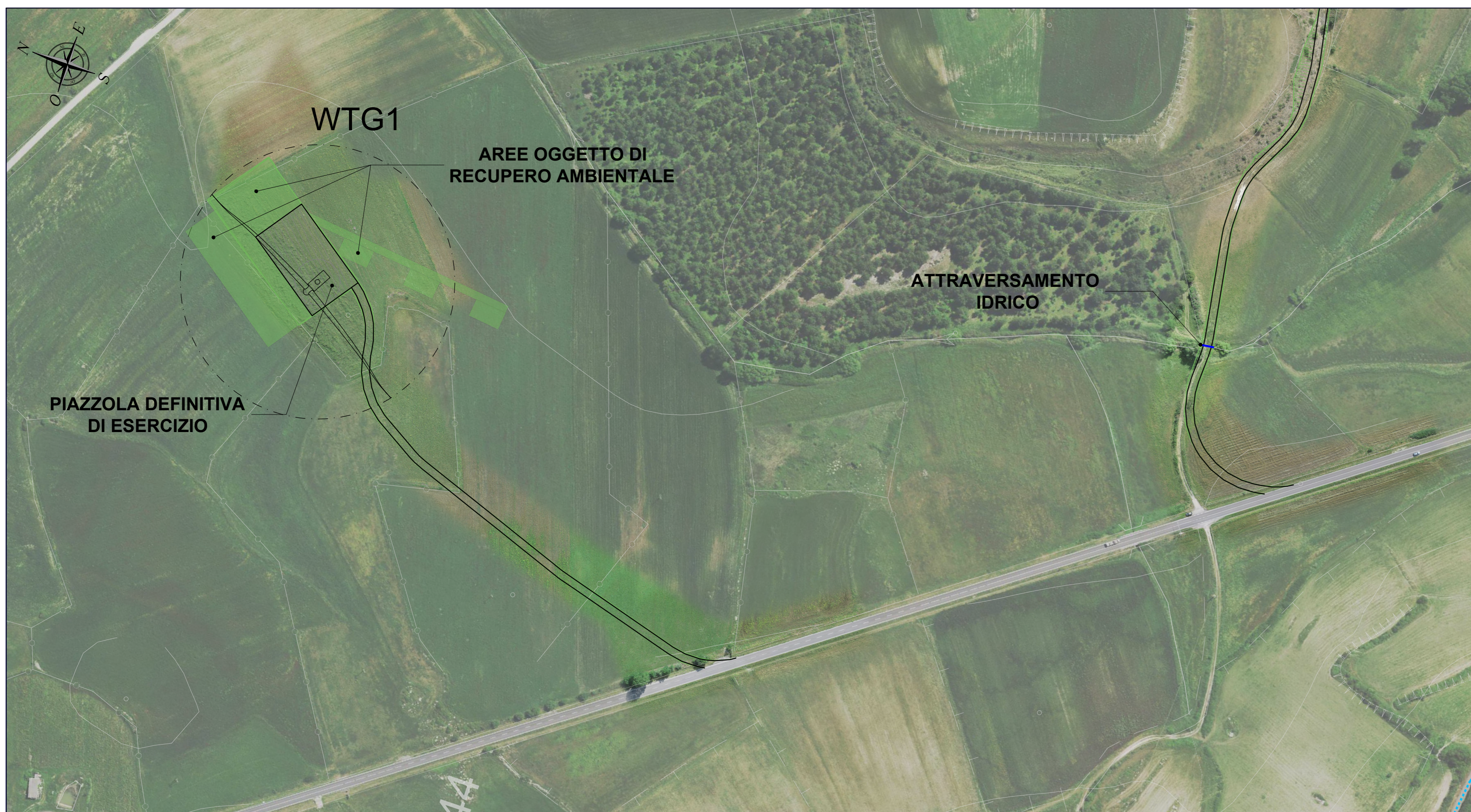
PLANIMETRIA QUADRO 1 - SCALA 1:2.000