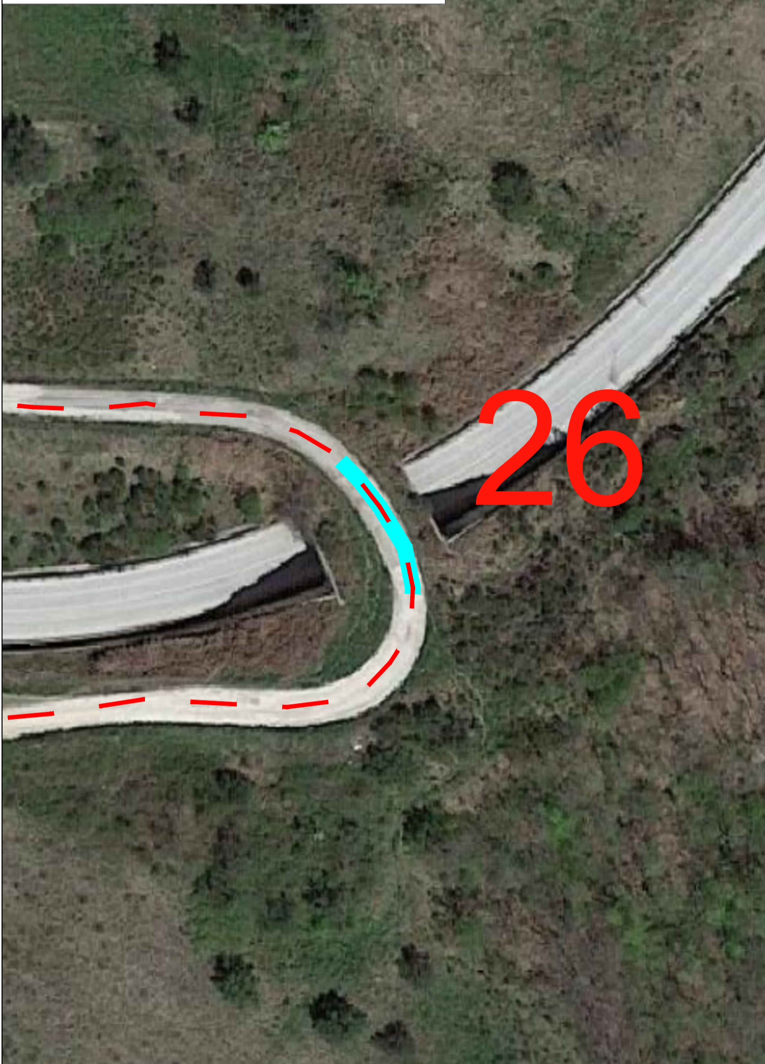
Interferenza con sovrappasso - Posa in canalina