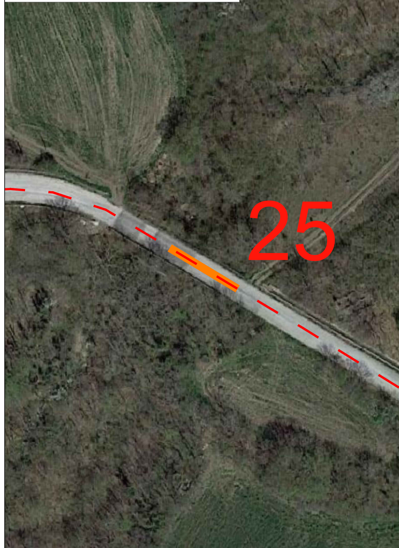
Interferenza con reticolo idrografico su IGM - T.O.C.